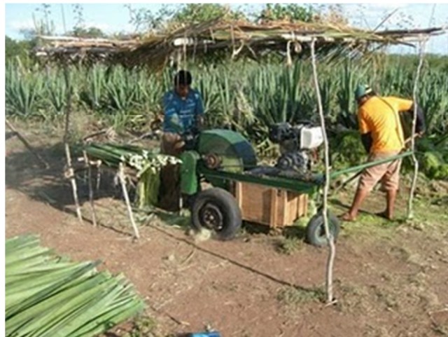
FIGURA 2 – TRABALHADORES NO MOTOR DE DESFIBRAMENTO DE SISAL