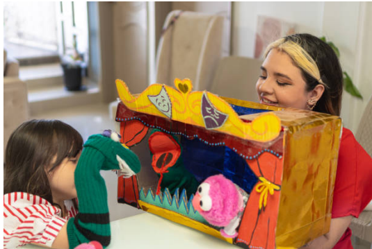
Figura 2 – Teatro de Fantoche

CONTADORA: é mesmo? Deve ser linda, depois você conta para a gente como ela é? Pois nesse momento a princesa já havia caminhado muito na chuva, quando [...]. [continua a história]