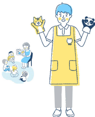
Figura 3 – Figura com fantoche nas mãos

Segundo Paul Zumthor (2007), a performance é um saber que implica e comanda uma presença e uma conduta, um Dasein (estar lá, compromisso, implicação) comportando coordenadas espaço-temporais e fisiopsíquicas concretas, uma ordem de valores encarnada em um corpo vivo. A performance, para esse autor, e o conhecimento daquilo que se transmite estão ligados naquilo que afeta o que é conhecido. A performance, de qualquer jeito, modifica o conhecimento. Ela não é simplesmente um meio de comunicação: comunicando, ela o marca.