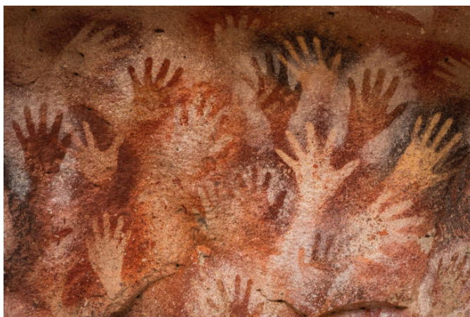
Figura 1 – Cueva de las Manos, río Pinturas, em Santa Cruz (Patagônia argentina)

Indícios antropológicos e arqueológicos sugerem que a espécie Homo sapiens conquistou o mundo há 70 mil anos, depois de milênios de existência de diversos homínídeos que foram, por diversos motivos, sendo extintos até sobrar apenas nossa espécie atual. Segundo Yuval Noah Harari (2017), isso se deu graças à capacidade de imaginar coisas que não existiam de fato. Ele chama isso de revolução cognitiva e defende que ela ocorreu por conta da capacidade do Homo Sapiens de contar histórias uns para os outros. Assim, podemos inferir que há aproximadamente 70 mil anos contamos histórias uns para os outros e passamos essas histórias de geração a geração. Somente há aproximadamente 44 mil anos começamos a reproduzir essas histórias nas cavernas, na forma de desenhos. Inventamos a escrita há aproximadamente 5 mil anos e a disseminação dos livros, nos quais foram registradas essas narrativas, só aconteceu por volta dos últimos 400 anos. Portanto, não é inverossímil concluirmos que contar histórias, extrapolando ou diversificando coisas que existem e não existem de fato, é o que nos torna verdadeiramente humanos.