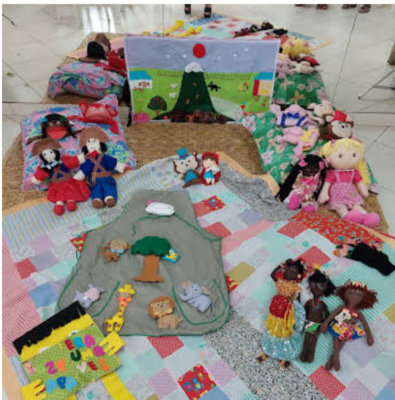
Figura 7 – Cenário criado

Criar cenário é uma ação acolhedora que promove a ambientação e encantamento da narrativa. Não precisa ser nada muito elaborado, colocar um avental, abrir um tapete ou um banner, cobrir a mesa com uma toalha diferente ou pôr uma toalha no chão e se sentar em círculo já produz um cenário diferente. O cenário pode ser mental ou físico.