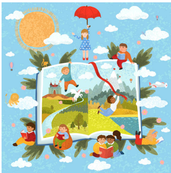
Figura 8 – Construindo repertório

Para a construção de repertório, talvez uma das ações mais importantes seja ouvir. Ouça pais, mães, avós, avôs, tios e tias, vizinhos, contadores locais. Peça para contarem histórias e ouça com atenção. Esse é um repertório muito rico que ensina sobre quem somos e de onde viemos, mesmo que sejam repertórios muito eurocentrados, afinal, as histórias ensinam a entender quem somos e o que podemos ser.