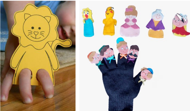
Figura 5 e 6 – Dedoches

de revistas, deixando um espaço para prendê-los em seus dedos. Podem ser feitos de crochê, tricô, ou de pano ou outro material semelhante. Sempre importante fazê-los de forma que possam ser vestidos em seus dedos. Eles são recursos interessantes, mas é preciso treino para lidar com eles de forma satisfatória. Ter um cenário pequeno com uma cortininha, por onde pode-se apresentar o fantoche, pode ser bastante interessante.