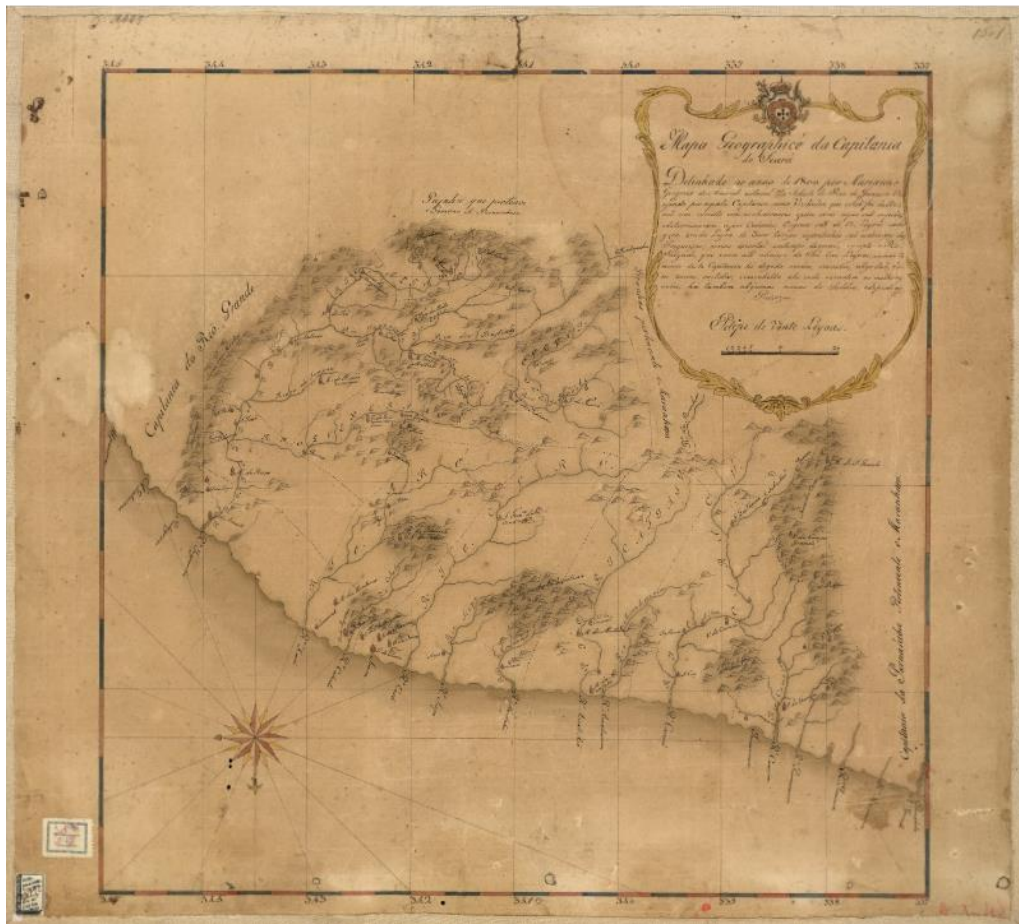
Figura 1 — Mapa Geographice da Capitania do Seará.