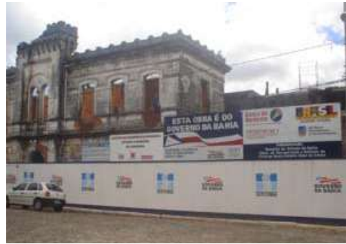
Figura 2. Foto do Forte durante a reforma