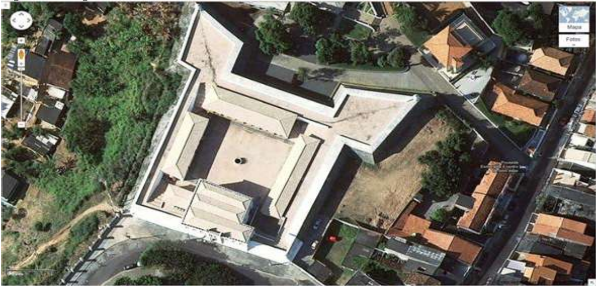
Figura 3. Imagem do Forte via Satélite