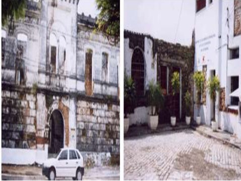
Figura1. Foto do Forte antes da reforma