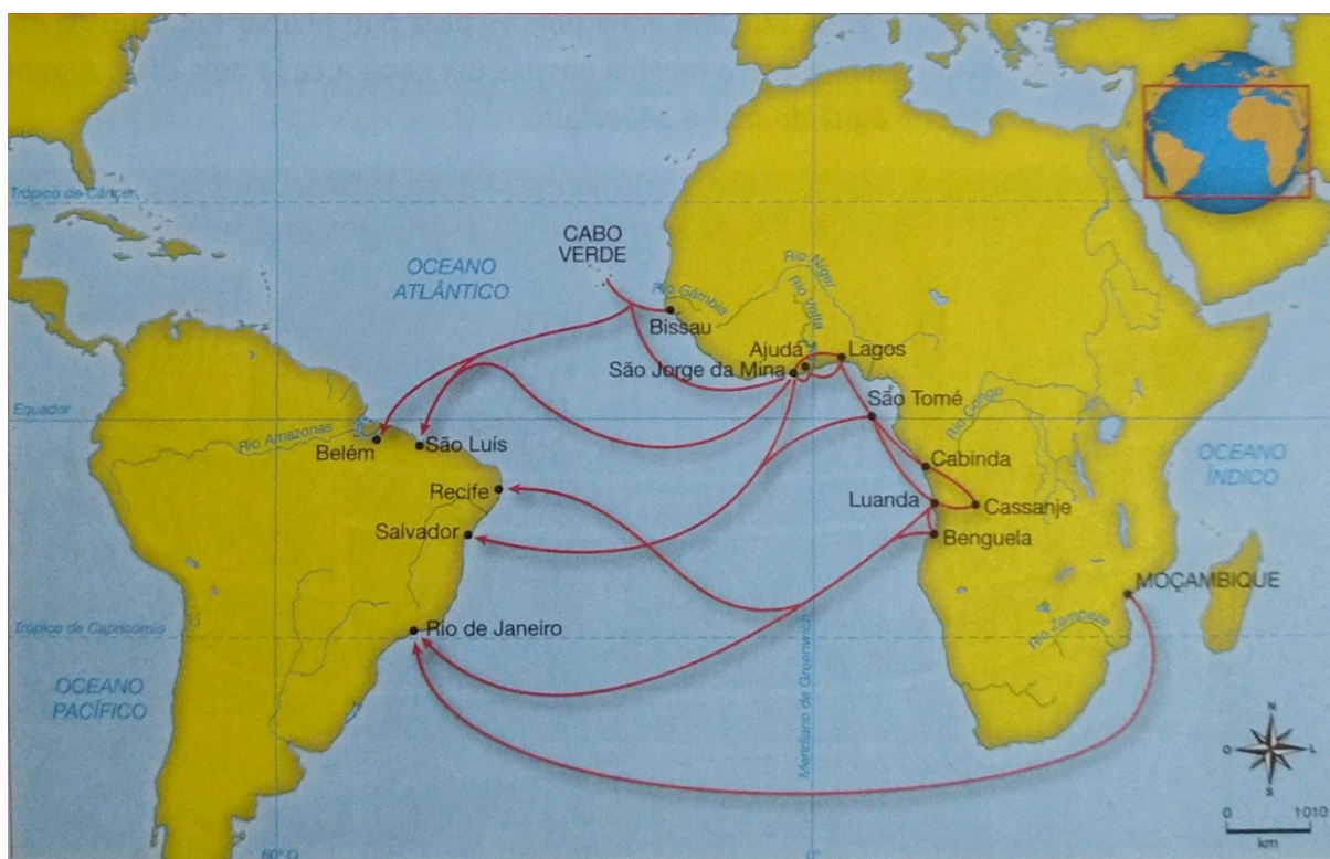
Mapa 2º: Embarque e desembarque de africanos e o surgimento da diáspora no Brasil

Complementar a isto, Kim Butler e Perônio Domingues falam que “O conceito de diáspora refere-se ao tema da viagem (física ou imaginada), aos deslocamentos (de rotas e raízes) e ao emaranhado de experiências dispersas” (2020, p.13) e se juntam com outras. Já no que se refere à diáspora africana, é aquela que “[...] remete à dispersão global (de maneira voluntária e forçada) dos africanos no decorrer da história [...]” (2020, p.13), e aqui no Brasil, incluindo na Chapada, esse processo ocorre de forma forçada entre os séculos XVI e XVIII, quando milhares de africanos são trazidos pelo Atlântico para estas terras.