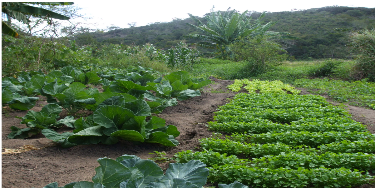
Figura 04 - Produção agrícola no Assentamento 02 de Julho.

consumo; plantam feijão, milho, mandioca, mamona, hortaliças, fortalecendo assim, a sua própria subsistência e a economia local, o que gera impacto, já que esse assentamento no passado era um latifúndio improdutivo.