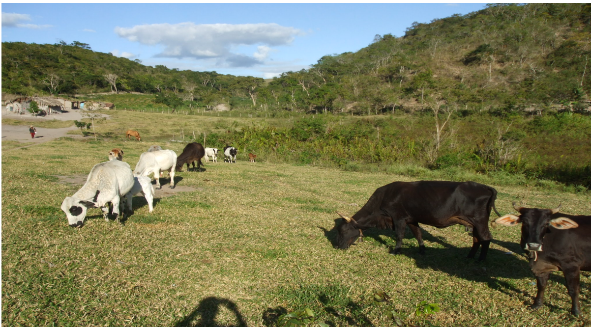
Figura 03 - Assentamento 02 de julho, 2006.