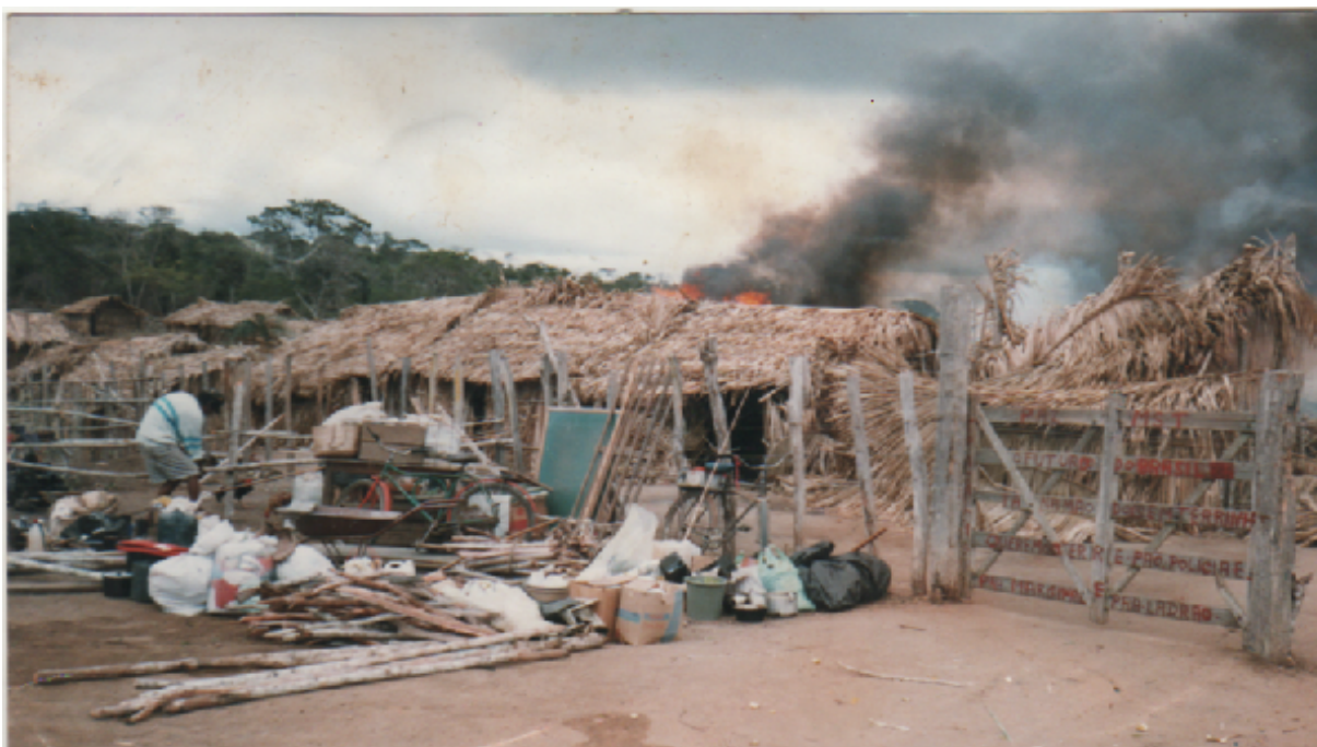
Figura 02 - Queima dos Barracos no Acampamento Jenipapo, 1999.