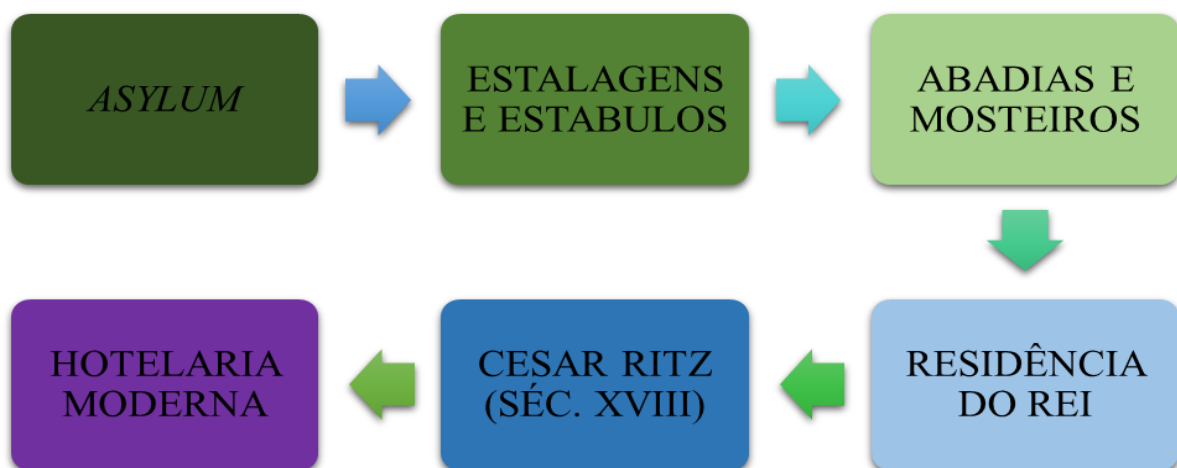
Figura 1: Evolução histórica da Hotelaria

Na Antiguidade, as Estâncias Hidrominerais, na Idade Média e Era Moderna os mosteiros que acolhiam hóspedes, assim como as articulações dos correios e os abrigos para os cruzados e peregrinos e, a partir do século XVIII, a criação dos hotéis começa a se tornar mais visível tendo suas modificações para que consigam satisfazer os hóspedes. Do século XVIII em diante, os hotéis passaram a se tornar comuns no mundo todo, e com o passar dos anos, inovações idealizadas pelo suíço César Ritz, o qual foi considerado o pai da hotelaria moderna, já que revolucionou o setor hoteleiro da época, deixando um importante legado para os dias atuais (SANTOS, 2010), cujas mudanças trouxeram novas tecnologias para facilitar a estada e os trabalhadores, telefones, trancas atualizadas até chegarem para as digitais, elevadores, até mesmo outros tipos de meios de hospedagem como o próprio objeto de estudo, o hotel temático.