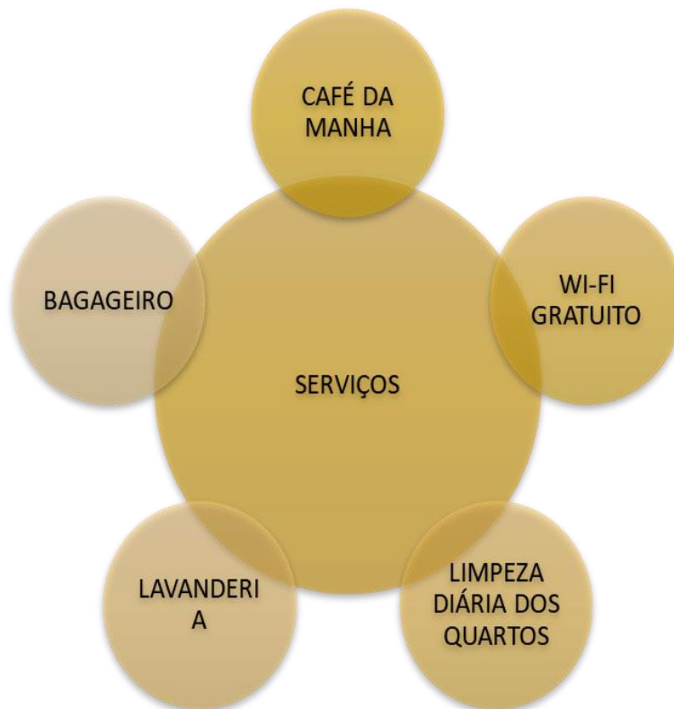
Figura 3: Serviços oferecidos pela Pousada Solar dos Deuses

naqueles que contém a vontade de sentir a sensação de aproximação e acolhimento para com a cultura local, assim como o sentimento de “novo” que a pousada sendo esta temática, pode oferecer.