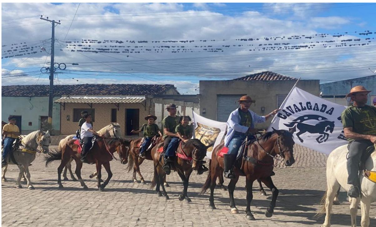
Figura 4 – Cavalgada Cristã pelas ruas do distrito

A cavalgada cristã é outro evento marcante da região, reunindo um grande número de pessoas em um momento de fé. Durante o percurso, os participantes saem montados em seus cavalos e alguns jumentos percorrendo as ruas do distrito e exaltando a figura do vaqueiro nordestino, símbolo do trabalho no campo. Abaixo, seguem duas fotografias que registram esse momento.