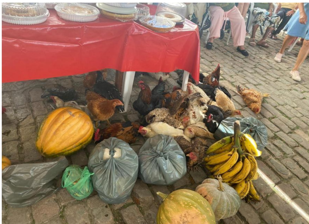
Figura 6: Prendas doadas pela comunidade para o leilão da Festa do Bom Jesus.

Após a missa, ocorre o almoço comunitário, no qual são servidos lanches e refeições aos participantes. Já às 14:00 horas, acontecem os leilões, momento em que são arrematadas diversas prendas arrecadadas e doadas pela população ao longo da preparação da festa. O evento ainda conta com a animação do grupo Bumbeiros. Esses momentos complementam o caráter religioso e social da celebração, reforçando a importância da participação coletiva para a continuidade dessa tradição.