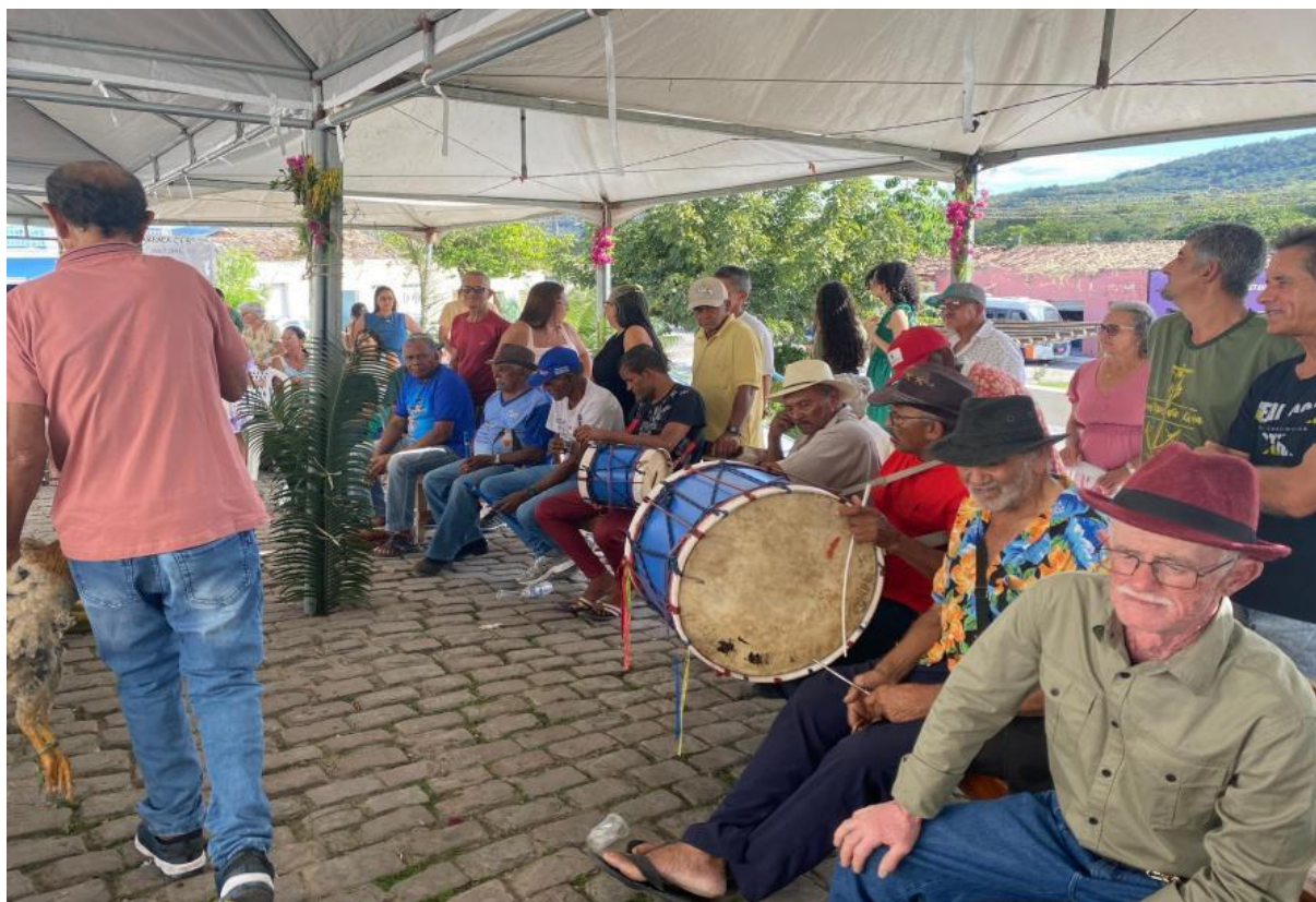
Figura 7: Apresentação do grupo Bumbeiros animando a festa após o leilão.

Formados por pessoas que utilizam instrumentos como tambores, esses grupos ajudam a criar um clima de entusiasmo e participação coletiva. Abaixo segue a figura: