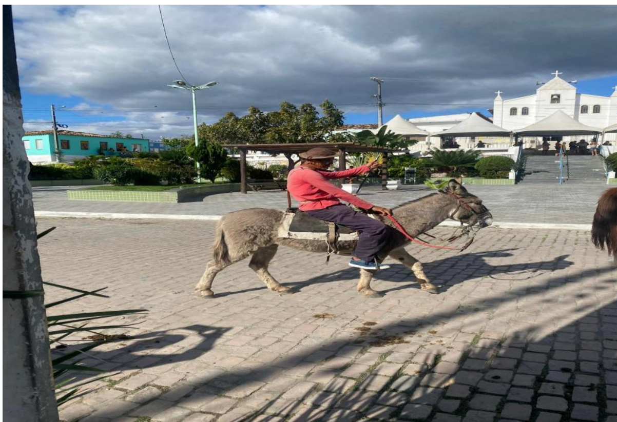
Figura 5 –Representação do vaqueiro nordestino durante a Cavalgada Cristã

demonstrando a participação familiar e comunitária na celebração. Agora veja a próxima figura: