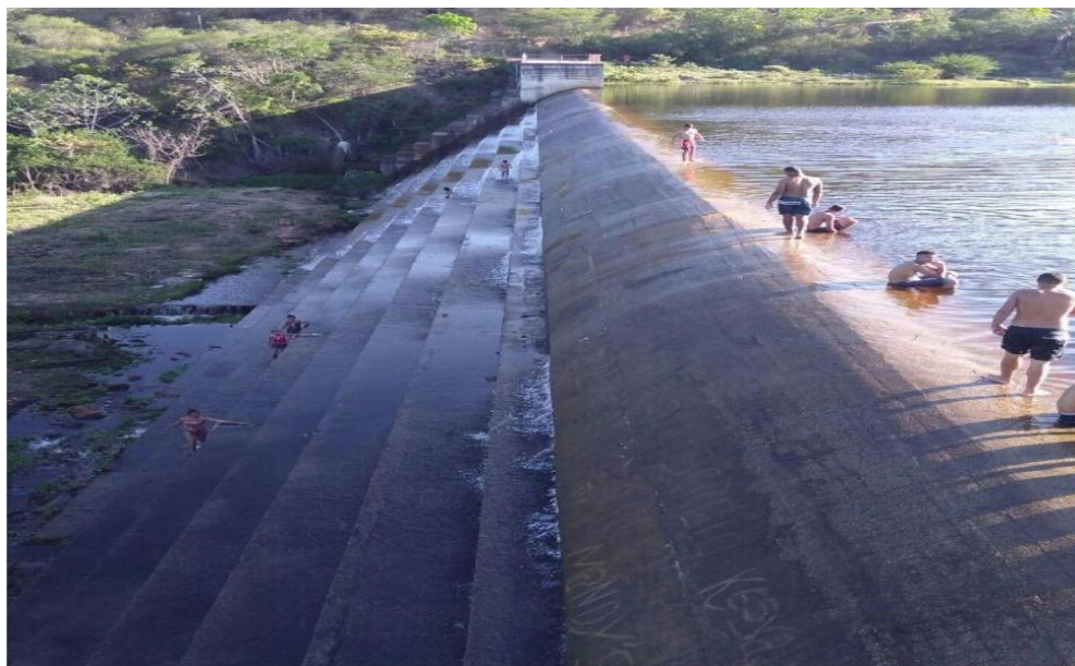
Figura 3 – Fotografia: Pessoas no Vertedouro da Barragem Barragem de Cachoeira Grande, principal manancial de água potável do distrito e região.

Entre os principais mananciais de água doce da região, destaca-se a Barragem de Cachoeira Grande, formada pela confluência dos braços do Rio Itapicuru Mirim. Localizada a aproximadamente 3 km acima do povoado, a barragem é responsável pelo abastecimento de água potável do distrito, de parte do município de Jacobina e da cidade de Serrolândia. Além de sua função no fornecimento de água, a barragem contribui para a manutenção dos ecossistemas locais, influenciando a fauna, a flora e as atividades econômicas que dependem dos recursos hídricos da região. Desse modo, para ilustrar a relevância deste manancial, a imagem da estrutura da Barragem.