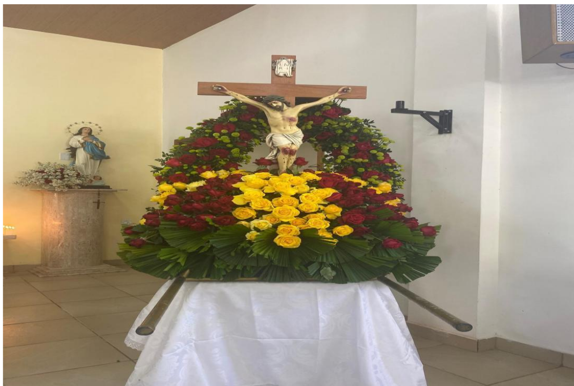
Figura 8: Imagem do Bom Jesus da Glória, referência central da comunidade

As flores são utilizadas para enfeitar as imagens religiosas e o interior da igreja. Para viabilizar essa decoração, a comunidade se mobiliza por meio de rifas, doações de objetos e contribuições anônimas. Entre os itens rifados estão kits de perfume, vasilhas e outros utensílios, cujo valor arrecadado é destinado à compra das flores. Essa prática evidencia não apenas a devoção religiosa, mas também a solidariedade presentes na organização do evento.