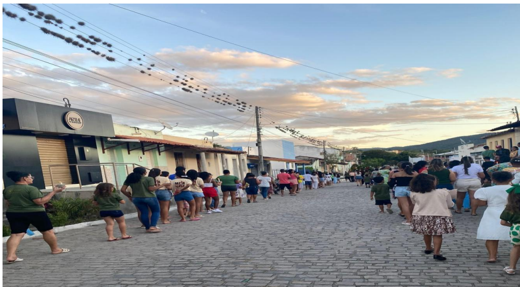
Figura 10: Fiéis se reúnem na procissão do ano 2025.