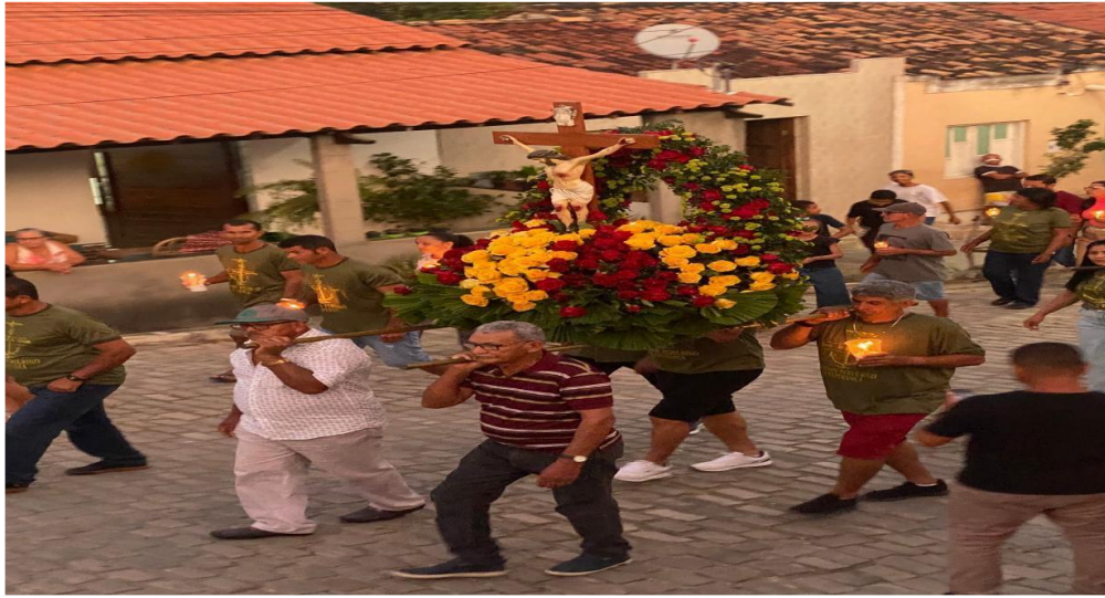
Figura 9: Procissão luminosa