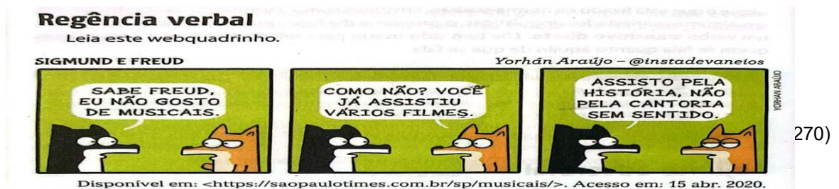
Figura 1 – Web quadrinho

Ademais, essa tirinha é seguida por este texto: