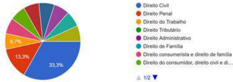
Figura 1 – Áreas de especialização dos participantes

2. Qual é a sua área de especialização? (Você pode indicar mais de uma) 15 respostas