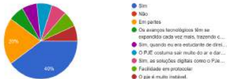
Figura 4 – Opinião dos participantes sobre a contribuição das soluções digitais (como PJe e Projudi) para a democratização e celeridade no acesso à Justiça