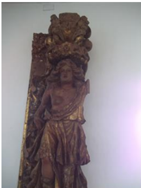
Figura 8: Anjo Tocheiro