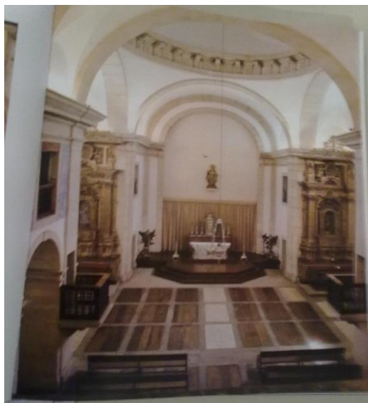
Figura 9: Interior da igreja de Santa Teresa