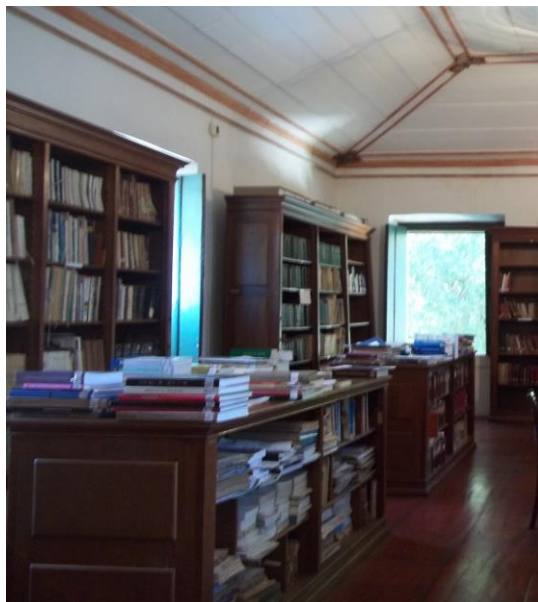
Figura 10: Parte da biblioteca do C.A.S.T.