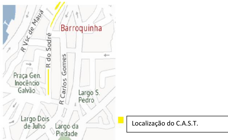
Figura 2: Mapa de localização do C.A.S.T.