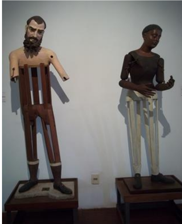
Figura 11: São Eliseu e Santo Antônio de Cartagerona do séc. XIX. Pertencentes ao acervo da Irmandade do Santíssimo Sacramento e Nossa Srª da Conceição da Praia.