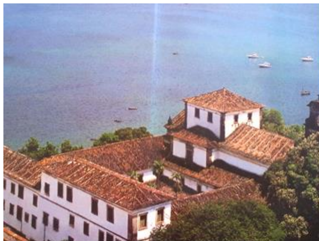
Figura 1: Vista do alto do C.A.S.T.