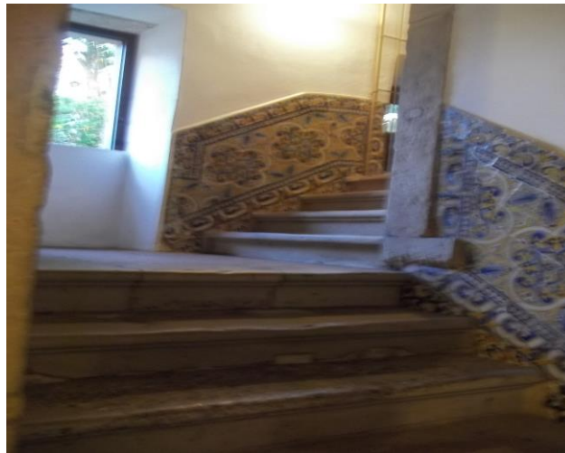
Figura 4: Escadas de acesso para o MAS

A cobertura em vários planos possui sua estrutura em madeira, revestida com telhas cerâmicas, tipo colonial.