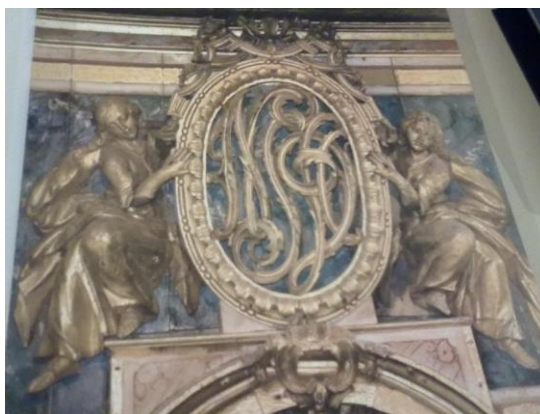
Figura 5: Brasão do MAS