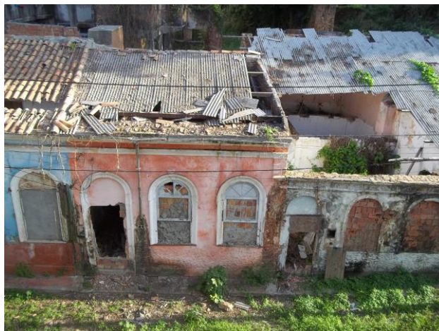
Figura 12: Casas antigas no entorno do C.A.S.T.