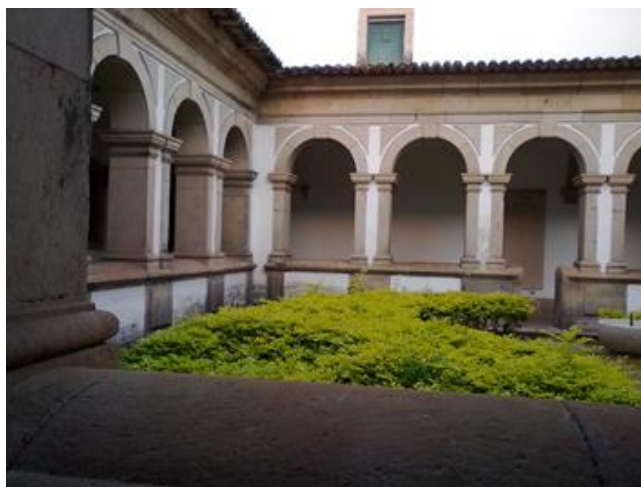
Figura 7: Claustro do C.A.S.T.