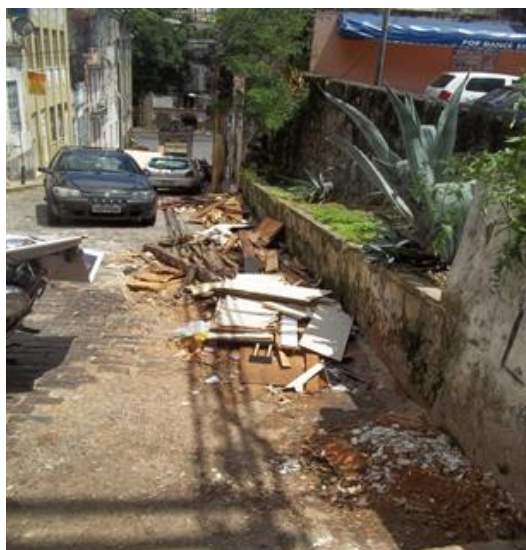
Figura 13: Ruas descuidadas no entorno do C.A.S.T.