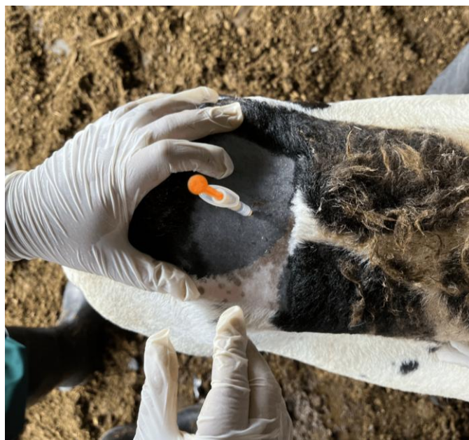
Figura 02: Aplicação da dose reduzida de eCG no acuponto Bai Hui .

Após a remoção dos dispositivos e aplicação hormonal, as ovelhas foram submetidas à monta natural controlada, com proporção de quatro fêmeas por macho (4:1), iniciada 24 horas após a administração da eCG. O diagnóstico de gestação foi realizado por ultrassonografia transretal aos 35 dias após a cobertura, conforme Fig. 04. A taxa de gestação foi determinada pela proporção de fêmeas gestantes em relação ao total de fêmeas submetidas aos protocolos.