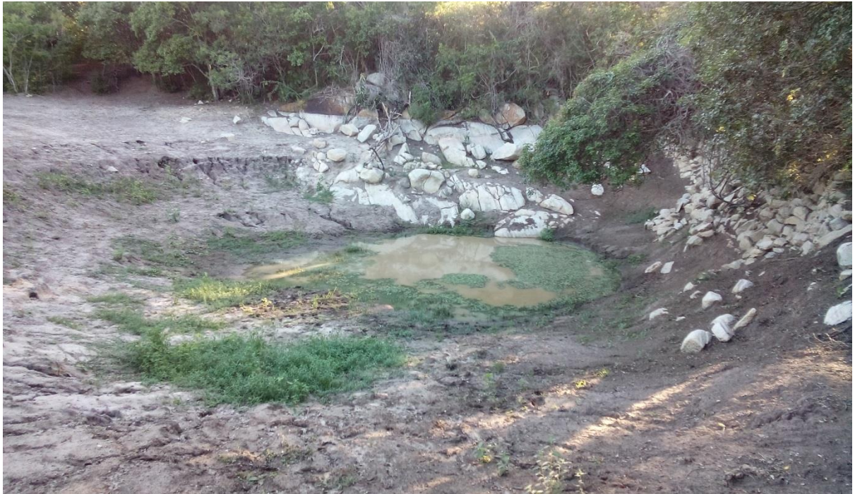
Figura n° 1