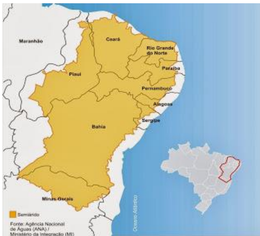
Figura nº 2