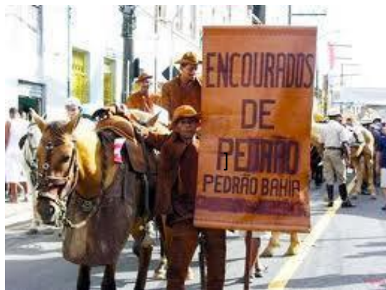
Figura 9 - Encourados no desfile cívico - Foto de domínio público

todos os brasileiros, recebendo papel de destaque no desfile cívico do Dois de Julho.