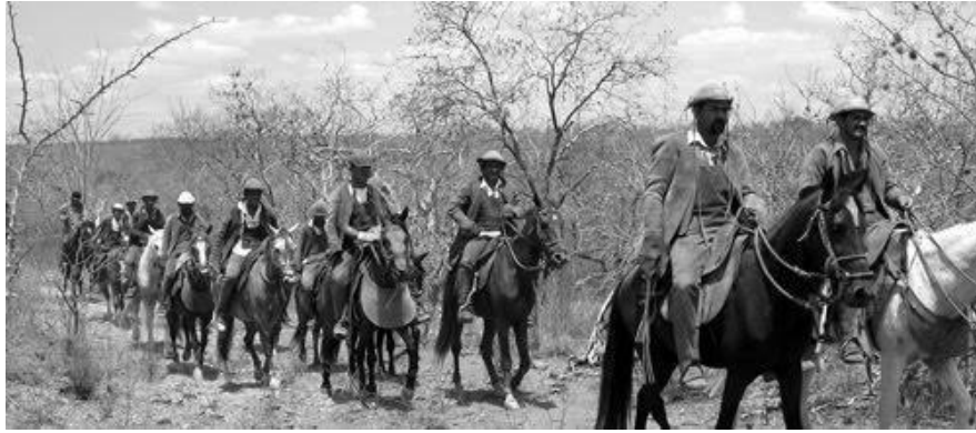
Figura 6 - Imagem formação dos Encourados

A partir disso, chamou-me atenção essa imagem, pois ela transmite uma situação recorrente dos Encourados de Pedrão, uma marcha na caatinga, vestidos a caráter, com a vestimenta característica do vaqueiro, em sintonia total com o ambiente.