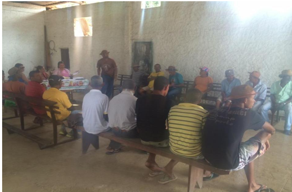
Figura 24 - Reunião da Associação Encourados de Pedrão, registro realizado em 08 de junho de 2014.

Encourados fica assim definida: (40) quarenta associados, cavaleiros, trajados com vestes de couro representando os vaqueiros e 01 associado, cavaleiro, trajado de frei representando frei Brayner.