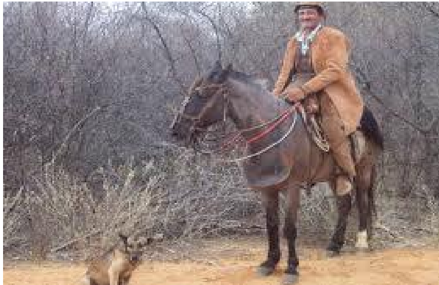
Figura 14-Imagem de um vaqueiro encourado que labuta e representa o herói, que participou da Independência da Bahia, o que faz com que o sentimento de orgulho e de pertencer a esse grupo seja predominante na vida deles. (Arquivo pessoal)

Percebe-se que dentro das narrativas dos meus entrevistados não existem diferenças entre a figura do vaqueiro que labuta diariamente com o gado e o mesmo sujeito que representa o movimento histórico, a fronteira entre um e o outro está caracterizada tanto pelo reconhecimento que o grupo confere a esse sujeito, bem como o contexto social que legitima essas personagens como representantes legais do Encourados de Pedrão de 1823