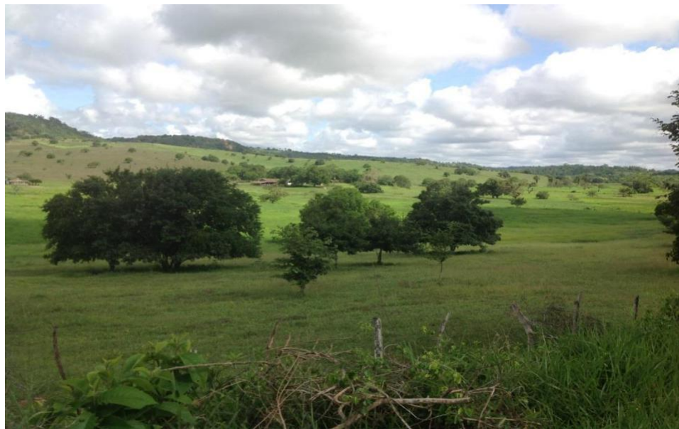
Figura 21 - Foto da paisagem de Pedrão (2014), com suas fazendas de grandes pastagens, cuja figura principal é o vaqueiro. Logo na chegada, fica evidente sua importância para a economia do município através das exuberantes propriedades de terra.

Essa descrição se completa ainda com a chegada de mais outra família, a construção de mais um sobrado e a realização de outro grande plantio de cana de açúcar. Através desse panorama, observamos que Pedrão se constitui desde sua formação em um território propenso para a presença do vaqueiro, pois é nesse ambiente rural que os vaqueiros surgem como força de trabalho predominante, e propicia para o desenvolvimento da economia local, baseada na agricultura e na criação de gado.