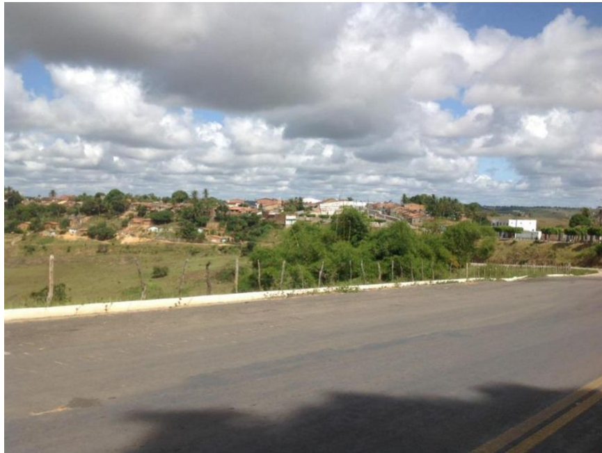
Figura 20 - Vista da entrada principal da cidade de Pedrão (2014).

Seguindo as pistas descritas por Santos (1994), será possível notar como o personagem do vaqueiro encontra ambiente favorável no município de Pedrão. São seus elementos de dentro do território que dão forma a essas figuras. Por outro lado, são esses sujeitos que constroem e mantêm a dinâmica do lugar, como elementos de uma identidade territorial.