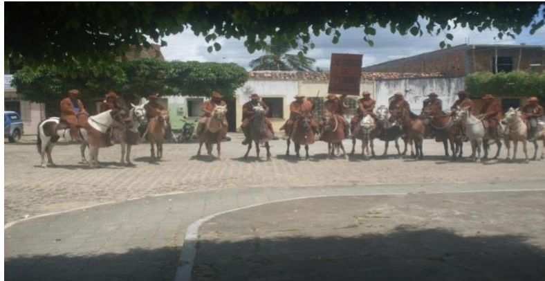
Figura 26 - Encourados em formação- O grupo está sempre presente nos eventos da cidade, o que faz com que sua história e importância se tornem parte de cada um dos moradores da cidade.

Para o presidente da Associação, a atuação nessas diferentes frentes possibilita levar a tradição dos Encourados e assim fazer circular essa produção histórica.