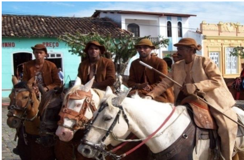
Figura 13-Cavalgada com a participação do grupo Encourados, Set/2013.

Estudar a cultura de um coletivo significa, para mim, identificar os códigos presentes nos modos de vida e, sobretudo, em determinados eventos privilegiados e densos da vida do grupo, ser possível interpretar os símbolos partilhados pelos membros dessa cultura.