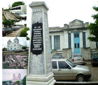
Figura 7 - Foto do obelisco erguido em homenagem aos Encourados situado na praça Encourados da Independência em Pedrão – Ba.

Porém considero ser de importância relevante a busca de mais registros sobre o lugar do movimento na historiografia baiana, como parte do próprio conhecimento histórico do sujeito e a sua constituição de passado.