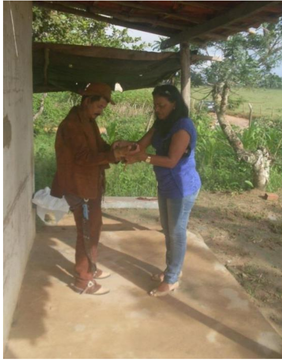
Figura 18-(Colaboradora ajuda nas vestimentas de couro traje que representa o vaqueiro e o Encourado. 18/09/2013)

Procuro mostrar nesta imagem a importância que o grupo dos Encourados tem para a população pedronense, e o seu envolvimento na participação deles no desfile do Dois de Julho. A população colabora na arrumação dos vaqueiros, é como se eles também, além de representados, também participassem do evento.