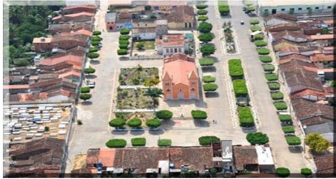
Figura 4 - Foto aérea sobre a cidade de Pedrão

Esta imagem retrata a vista aérea da cidade de Pedrão, típica cidade do interior baiano, com a Igreja se destacando como edificação principal na Praça Municipal, ruas arborizadas e largas, uma área predominantemente residencial, com muitas árvores.