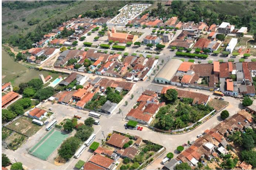
Figura 1 - Vista área da cidade de Pedrão – Ba.

Aqui a atual cidade de Pedrão, na Bahia. Uma cidade típica do interior, com ruas arborizadas e casas térreas. A maioria das casas são residenciais, e o comércio é reduzido. As ruas são largas, com pouco movimento de carros e ônibus.