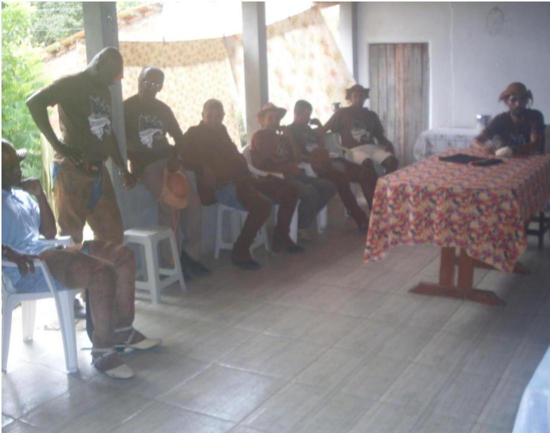
Figura 11 - Reunião da Associação dos Encourados de Pedrão (2014) para discutir sobre a preparação dos festejos para o desfile cívico do Dois de Julho, e para a manutenção das tradições do referido grupo.

Para a Fundação Gregório de Mattos, responsável pela produção da festa, este é um dos eventos mais esperados do ano, e o grupo tradicional de vaqueiros que participa da festa cívica representando os Encourados, incorporam também a figura tradicional do vaqueiro nordestino, importante combatente nas lutas pela Independência baiana, que estão presentes nos festejos do Dois de Julho, desde a década de 50.