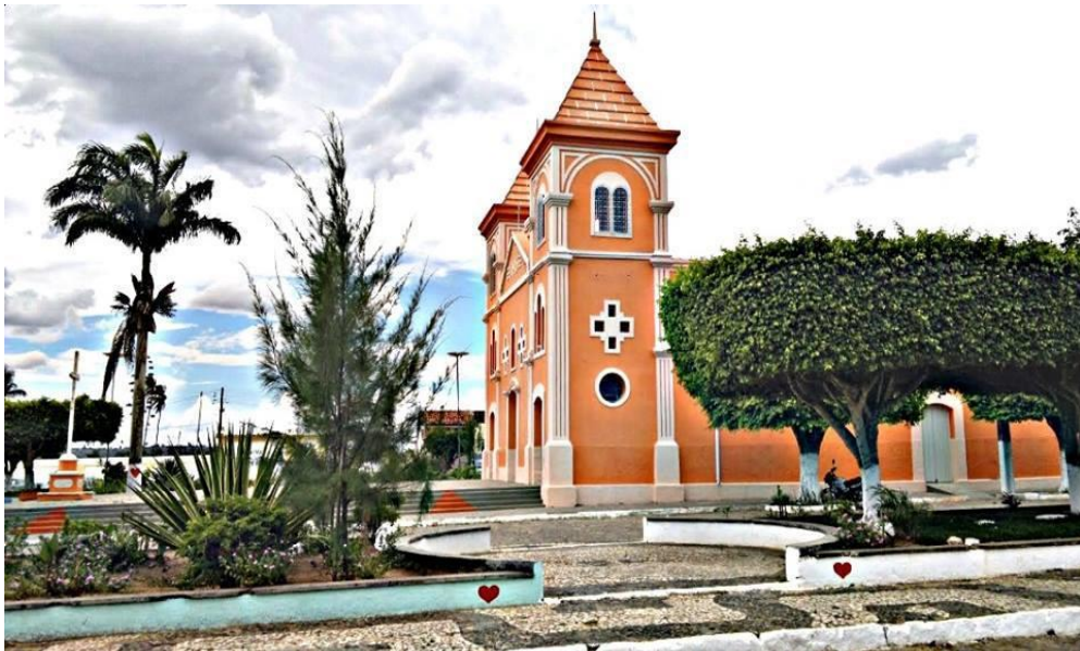
Figura 5 -Foto da matriz da cidade de Pedrão

Esta imagem retrata a vista aérea da cidade de Pedrão, típica cidade do interior baiano, com a Igreja se destacando como edificação principal na Praça Municipal, ruas arborizadas e largas, uma área predominantemente residencial, com muitas árvores.