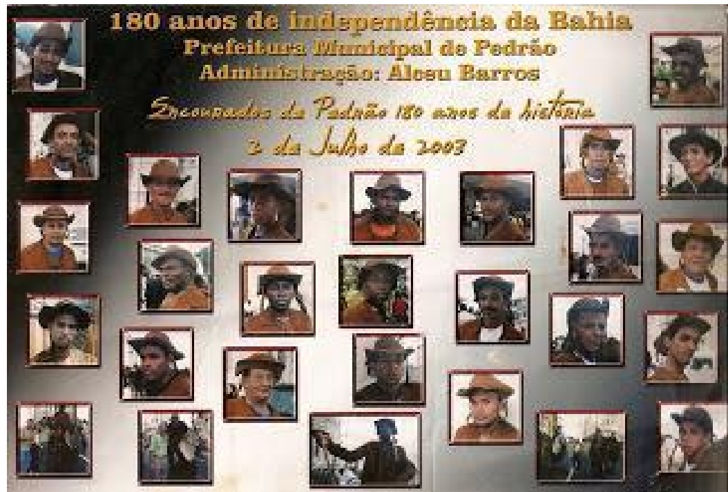
Figura 27 - Quadro com fotos dos associados.

Esses entrecruzamentos se firmam no campo tanto das práticas, como das ideologias, ambas responsáveis por assegurarem a manutenção e o reconhecimento dessas manifestações culturais enquanto identidades coletivas sociais. No campo das práticas identifico essas forças atuando na insistência de ações efetivas por parte do poder público, através de políticas públicas que abarquem não apenas as culturas majoritárias, mas também outras tradições culturais locais respeitando e dialogando dentro do âmbito ideológico de cada uma.