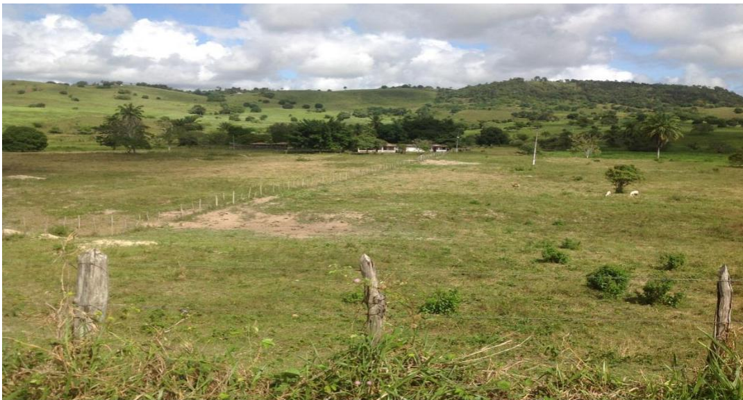
Figura 19 - Foto dos arredores de Pedrão (2014). Arquivo pessoal.

Tendo esse conceito de espaço como ponto de partida, criam-se condições para refletir a construção do espaço que cerca esses vaqueiros, através das ações desses sujeitos, que demarcam e caracterizam o sentido da economia no interior do país desde o sec. XVI. Essas ações implicam nos modos de uso no espaço que circundam, apontando outras formas de dominação muitas vezes conscientes ou impostas em relação à aceitação do que existe.