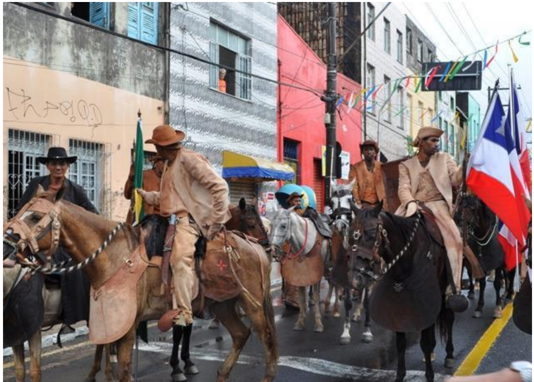
Figura 3 - Encourados no desfile cívico do Dois de Julho. Arquivo pessoal em julho de 2012

No Dois de Julho, evocando/perpetuando a memória daqueles vaqueiros-soldados, os Encourados de Pedrão participam da festa cívica baiana, representado por um grupo de homens, hoje agremiados em uma entidade intitulada Associação dos Encourados de Pedrão (AEP) 3 . Vestidos tradicionalmente a rigor, usam gibão, perneiras e chapéus de couro para assim representarem a figura tradicional do vaqueiro nordestino nesse desfile cívico desde a década de 50.