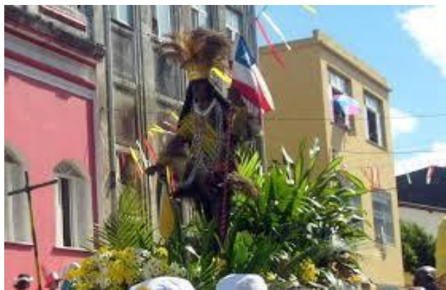
Figura 8 – Figura do Caboclo. Foto de domínio público.

Os batalhões dos Encourados e o dos Periquitos, imitando os combatentes da guerra gloriosa, dão um colorido muito vivo ao cortejo do triunfo: os Encourados apresentam-se com trajes de vaqueiros, os Periquitos com a vistosa farda verde, toda bizarra.