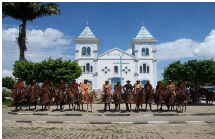
Figura 12- Formação do grupo dos Encourados, 2013, vestidos de acordo com as vestimentas originais, agrupados em frente à Igreja matriz da cidade, representando todo o orgulho dos pedronenses, em ter como filhos da terra heróis que participaram da Independência da Bahia.

Constato em loco essa teoria apresentada acima, durante o período que estive envolvido com o grupo da Associação, notei que seus componentes incorporam suas próprias experiências às do grupo como o qual convivem, em lições de solidariedade e companheirismo alimentados pelas imagens, ideais e valores transmitidos pelo significado do fato histórico que os une.