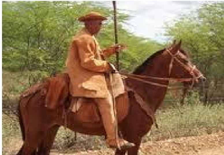
Figura 16- O vaqueiro Encourado, figura típica do sertão, integrante do grupo dos Encourados de Pedrão, em toda a sua caracterização e símbolo de herói da Independência. Retrata o homem simples, trabalhador, consciente de seus direitos e deveres, que defendeu a causa da liberdade.

Assim, o sentido das formas simbólicas pode ser mobilizado em circunstâncias sócio históricas específicas para estabelecer e sustentar relações de dominação. É o que Thompson define como fenômeno ideológico. Na medida em que o sentido é mobilizado pelas formas simbólicas para estabelecer e sustentar relações de dominação de classe, de gênero, de etnias temos a ideologização da cultura.