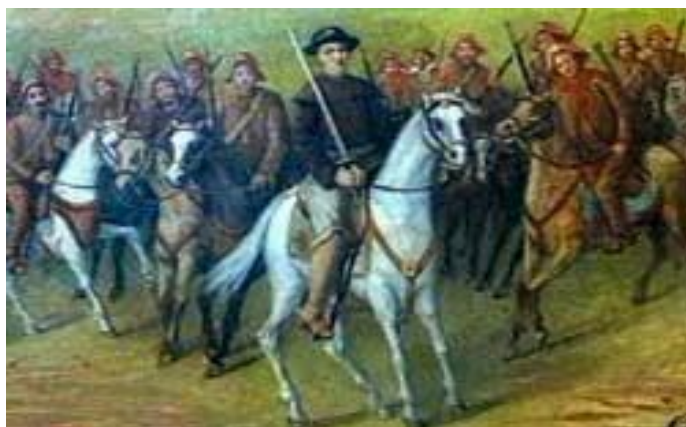
Figura 2 - Imagem da formação original do grupo Encourados de Pedrão(1823).

O grupo que ficou conhecido como “Encourados”, por ocasião da guerra da independência, era composto por 39 homens, vaqueiros, em sua maioria negros, voluntários (ou não) do município de Pedrão. O objetivo desses vaqueiros era se juntarem às tropas do General Labatut na cidade de Cachoeira, seguindo para Salvador e assim lutarem contra os portugueses no processo de Independência da Bahia em 1823.