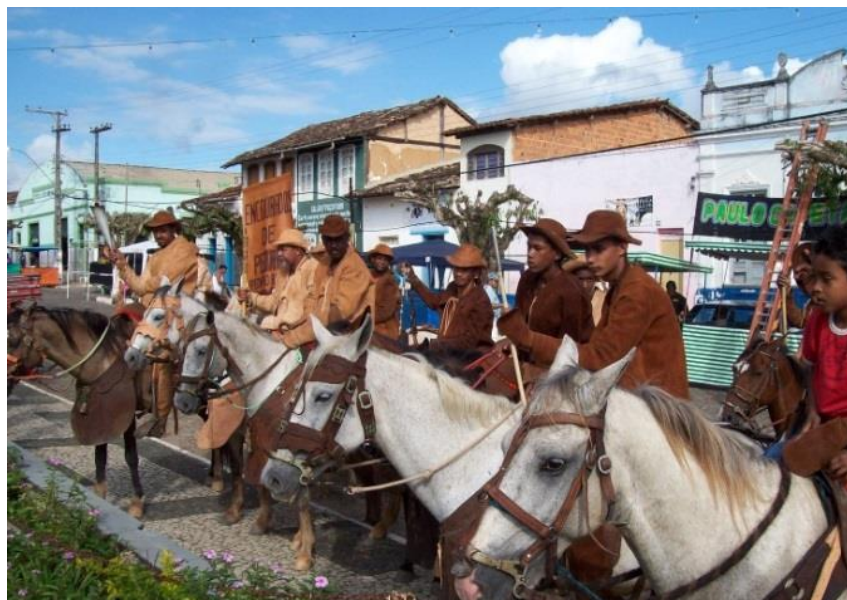
Figura 15 -Encourados na comemoração de emancipação política em 12 de julho/2013. O grupo está presente em todas as festividades e no cotidiano das pessoas do município, o que comprova o quanto representam o sentimento de orgulho e a própria identidade local.

Percebe-se que dentro das narrativas dos meus entrevistados não existem diferenças entre a figura do vaqueiro que labuta diariamente com o gado e o mesmo sujeito que representa o movimento histórico, a fronteira entre um e o outro está caracterizada tanto pelo reconhecimento que o grupo confere a esse sujeito, bem como o contexto social que legitima essas personagens como representantes legais do Encourados de Pedrão de 1823