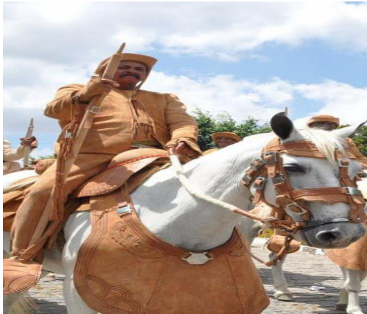
Figura 22 – Foto de vaqueiro, figura principal da região e da cidade representa o símbolo de resistência às adversidades, valente, ao mesmo tempo em que é um grande companheiro, pois sempre trabalha em grupo, na labuta com o gado.

Eu não tenho imagem muito boa de vaqueiro não. Quando eu era menina, não... eu achava assim: que ele não era bom, era coisa assim com matança com gado com aquelas coisa. Então eu, na minha mente eu não dava muita... eu não me preocupava com isso não. Para mim, eu disse assim: “Oh meu Deus uma pessoa assim lhe da com gado...” Achava que era assim uma pessoas grosseiro, um povo assim rebelde, um povo ignorante, como ferrão na mão. Eu não dava muita ligança não, sinceramente. Aí eu dizia assim: “Aí meu Deus, povo muito agressivo, grossão... aquele povo assim.