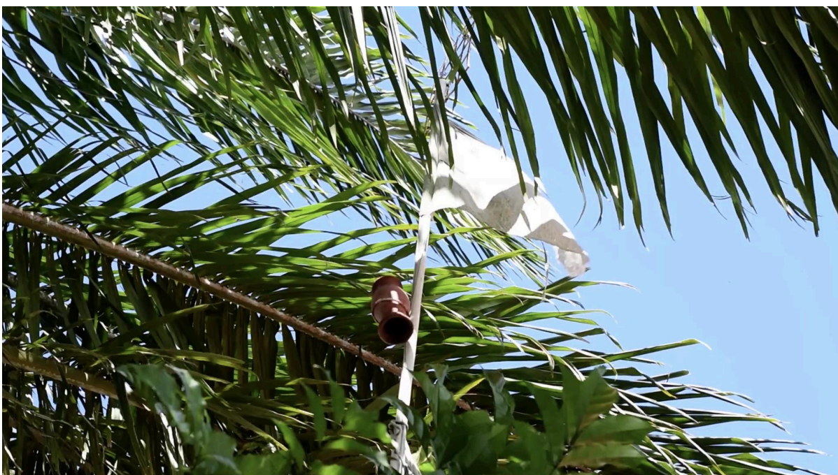
Imagem 5: Bandeira de Angola, representação do Nkisi Kitembo