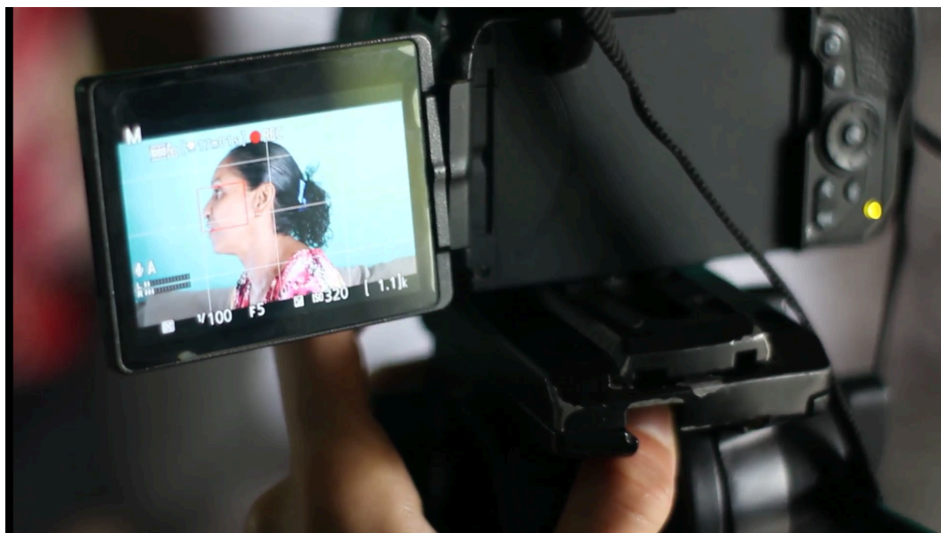
Imagem 10: Segunda entrevista em comunidade da Cidade Nova