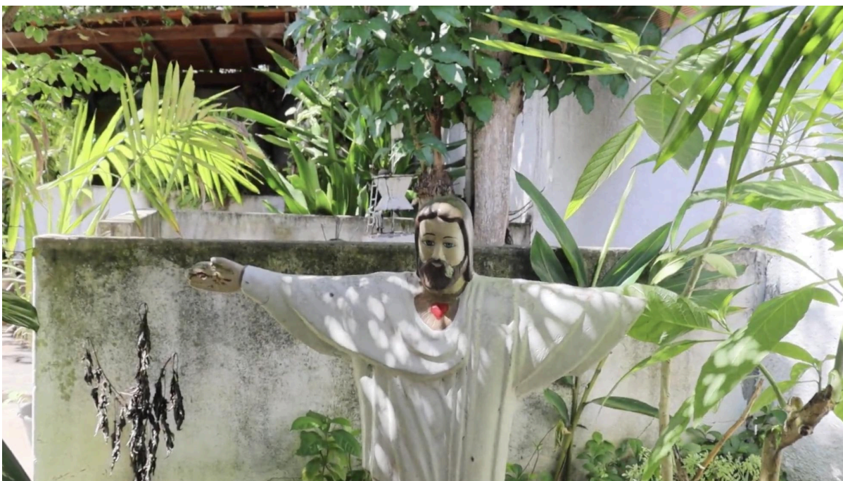
Imagem 4: Jesus Cristo no Terreiro Ilê Axé Ogum Megê