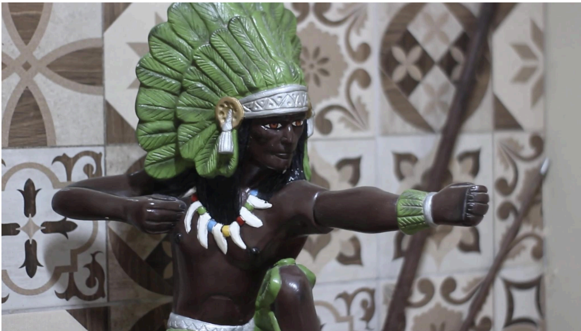
Imagem 6: Imagem do Caboclo