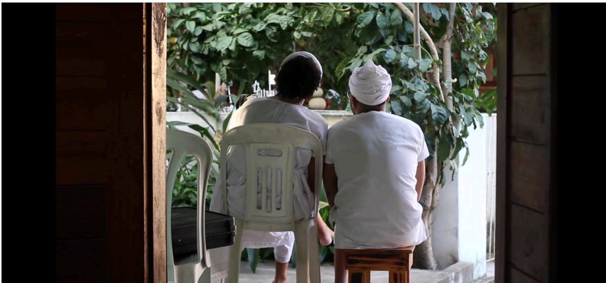
Imagem 8: Gravação em comunidade da Bola Verde