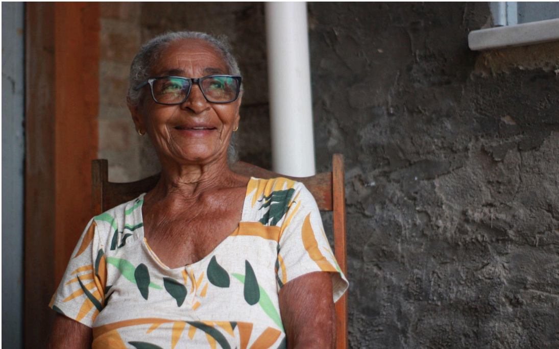
Imagem 9: Segundo dia de gravação, em comunidade da Cidade Nova