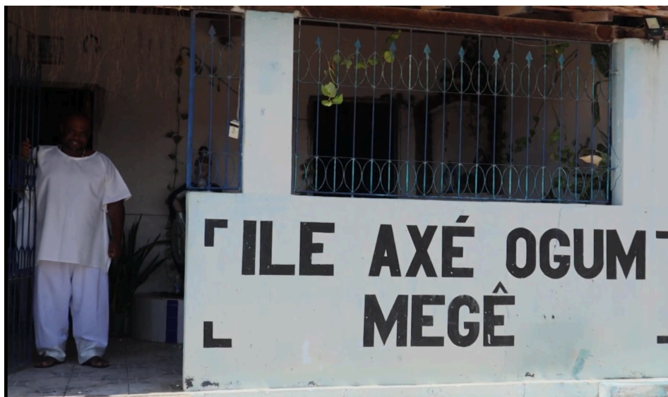
Imagem 11: Gravação no Ilê Axé Ogum Megê