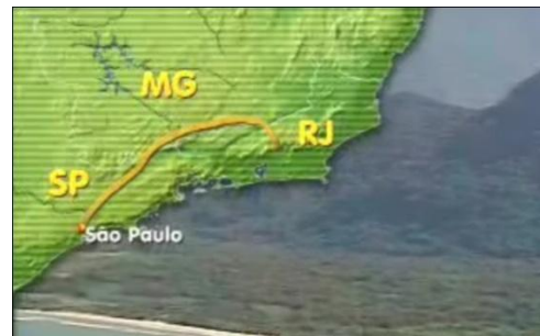
Figura 2 – Arte Mapa Reportagem E