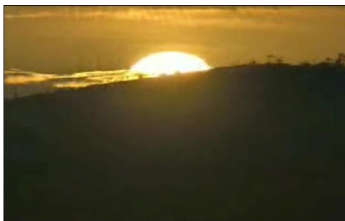
Figura 14 – Encerramento da série A Nossa Mata

Como recurso persuasivo, o orador utilizou uma trilha sonora enquanto mostrava imagens de animais livres percorrendo pelo seu habitat , da destruição das florestas e de turistas apreciando as belezas naturais do lugar. Como símbolo da esperança, ele mostrou um pôr do sol, representando um recomeço, afinal, hoje a realidade é essa, mas com o amanhecer é possível desenhar uma nova história para a Mata Atlântica.