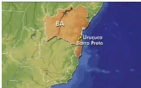
Figura 1 – Arte Mapa Reportagem B

Elas são utilizadas para ajudar o telespectador a entender a mensagem transmitida, mas devem ser usadas na medida exata para não transformar a matéria em alegoria. (PATERNOSTRO, 2006, p.89) Na série A Nossa Mata identificamos como recursos visuais a inserção de mapas e siglas. A Reportagem B contou com a ilustração de um mapa para elencar as cidades que mais preservaram a Mata Atlântica no País, começando pela Bahia, enquanto a Reportagem E utilizou o gráfico para apresentar a área de implantação do projeto intitulado Corredores Ecológicos em diversos municípios brasileiros. Já a Reportagem D deu maior visibilidade a sigla RPPN (Reservas Particulares de Patrimônio Natural) para facilitar a compreensão do telespectador.