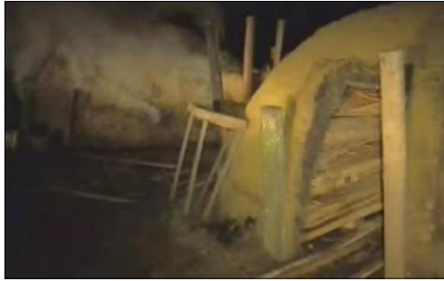
Figura 8 - Madeira no forno Reportagem A

Na Reportagem C , o orador mostra qual o destino das madeiras retiradas da Mata Atlântica. Muitas delas foram transformadas em móveis. Com o recurso visual, o telespectador pode constatar a veracidade da informação transmitida pelo repórter. Afinal de contas, a imagem coincide com aquilo que o orador diz.