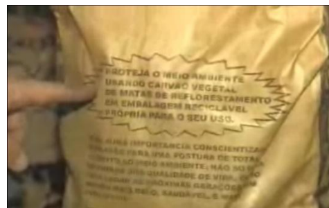
Figura 6 - Depósito da carvoaria Reportagem A Figura 7 - Embalagem do crime Reportagem A