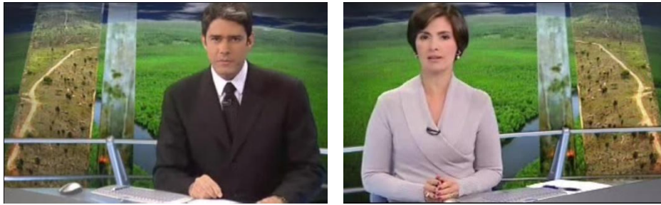
Figura 4 - William Bonner Reportagem B Figura 5 - Fátima Bernardes Reportagem B

Além disso, enquanto eles apresentavam à série ao público uma imagem bastante significativa fazia a composição da cena enunciativa. De um lado, o verde de uma Mata Atlântica rica, saudável. Do outro, uma floresta irreconhecível, destruída. Desta forma, o lead contou, ainda, com o apelo da imagem para despertar a atenção do telespectador.