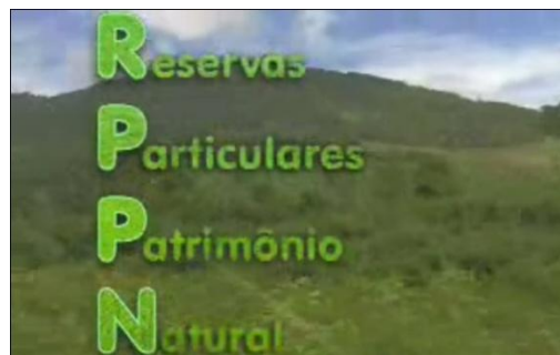
Figura 3 – Arte Mapa Reportagem D