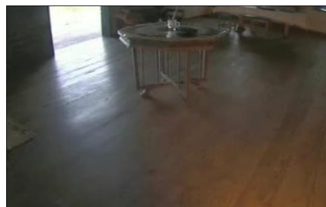
Figura 9 - Jequitibá virou pé de mesa Reportagem C Figura 10 - Peroba chão da sala Reportagem C

Como podemos observar, toda argumentação é seletiva. Ela utiliza determinados elementos previamente escolhidos e se preocupa com a forma de torná-los presentes. Nesse sentido, o telejornalismo possui a vantagem do recurso visual para que haja a presença, um fator essencial para a argumentação, e que, segundo Perelman e Olbrechts-Tyteca ([1958], 2005, p.126), atua diretamente sobre as emoções do auditório.