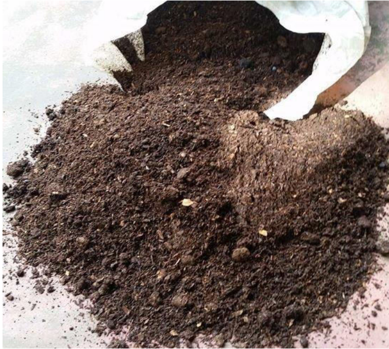
Figura 2. Cama de galinha.