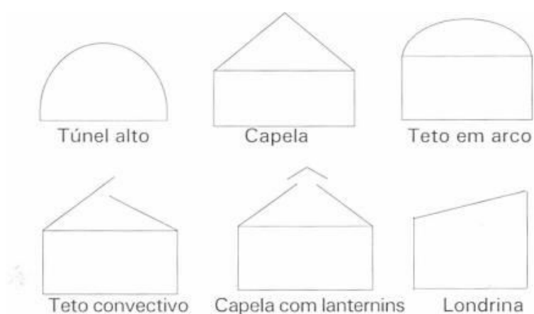
Figura 1- Fachadas de diferentes tipos de estruturas

Para o cultivo do tomateiro sob proteção, podem ser utilizados diferentes modelos de estruturas: túnel alto, capela, teto em arco, teto convectivo, capela com lanternins, cobertura inclinada ou na horizontal (Londrina), em módulos independentes ou conjugados (Fig. 1).