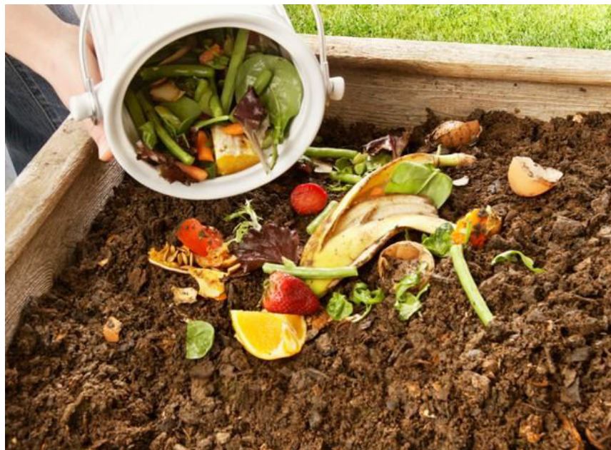
Figura 3. Composto orgânico.

Em estudo DE MEDEIROS et al (2013), o melhor substrato encontrado foi o de compostagem para a produção de mudas de tomate para o quesito matéria seca da raiz, apresentando resultados superiores quando comparados aos demais substratos utilizado na pesquisa.