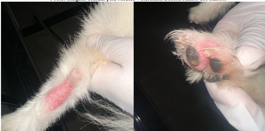
Figura 3: Piora das lesões devido a lambedura promovida pelo animal.

Decorridos sete dias de tratamento, na primeira revisão, a tutora relatou que não estava fazendo uso do colar elizabetano, o que proporcionou que o animal lambesse as lesões, culminado na piora do quadro (Figura 3).