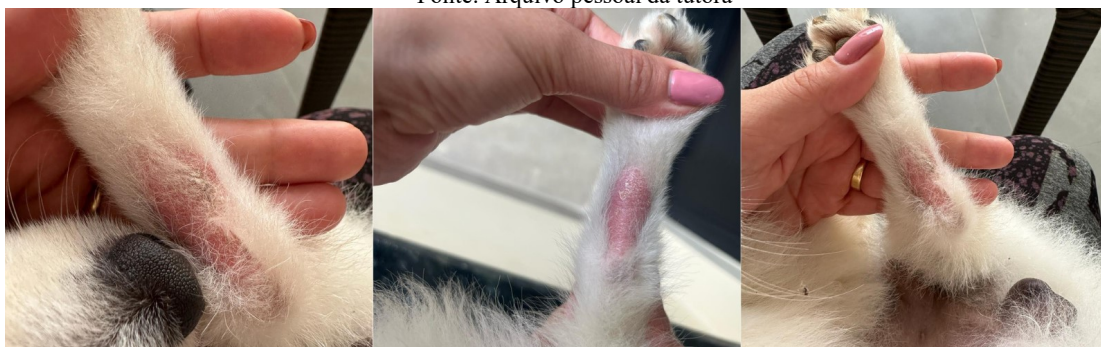
Figura 1: Lesão no membro posterior direito

Na avaliação física verificou-se mucosas normocoradas, tempo de preenchimento capilar em 2s, turgor fisiológico, linfonodos inguinais reativos, ausculta cardiopulmonar sem alterações, temperatura retal em 38,2°C, abdômen macio e sem algia e lesão em região distal de membro posterior direito apresentando alopecia, sem delimitação, eritema, edema, crostas, sem presença de exsudato (Figura 1), se estendendo até os coxins plantares do membro. Solicitou-se os seguintes exames complementares: hemograma, Alanina Aminotransferase (ALT), Fosfatase Alcalina (FA), Gama-Glutamil Transpeptidase (GGT) e perfil cutâneo, composto por citologia, raspado cutâneo e tricograma.