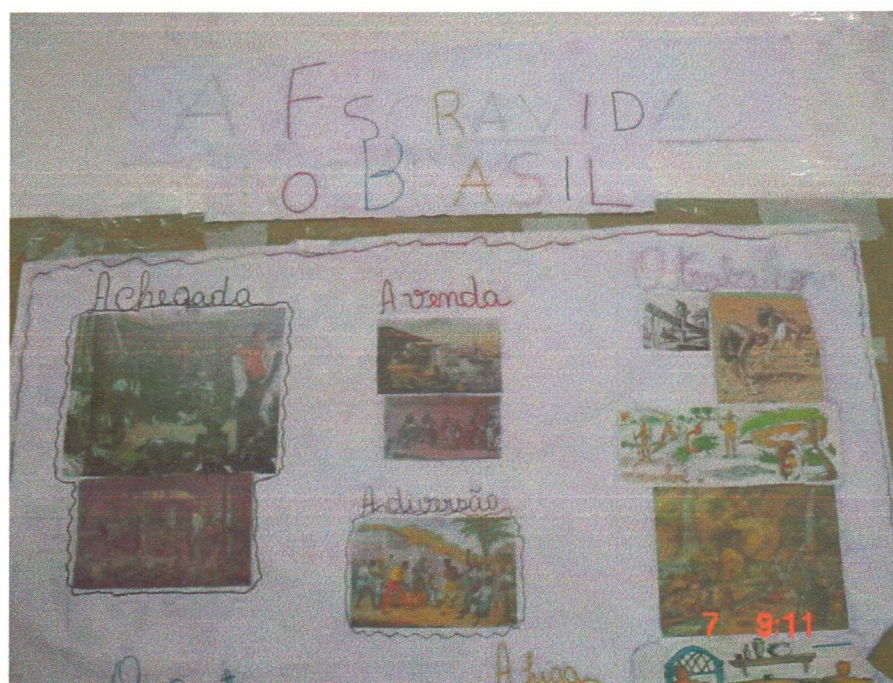
Figura 4 – A Escravidão no Brasil