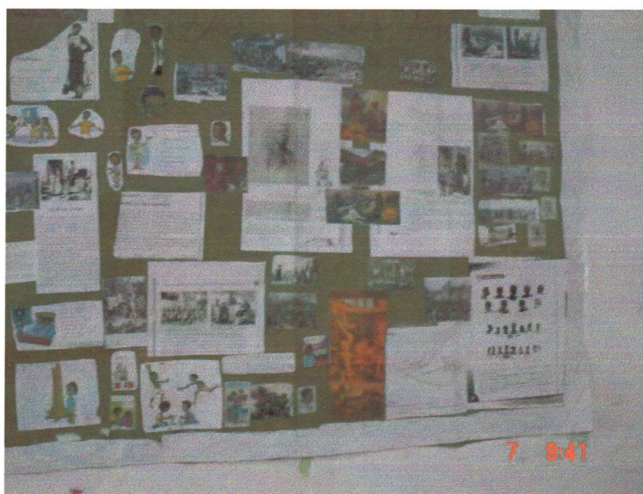
Figura 5 – Os Negros