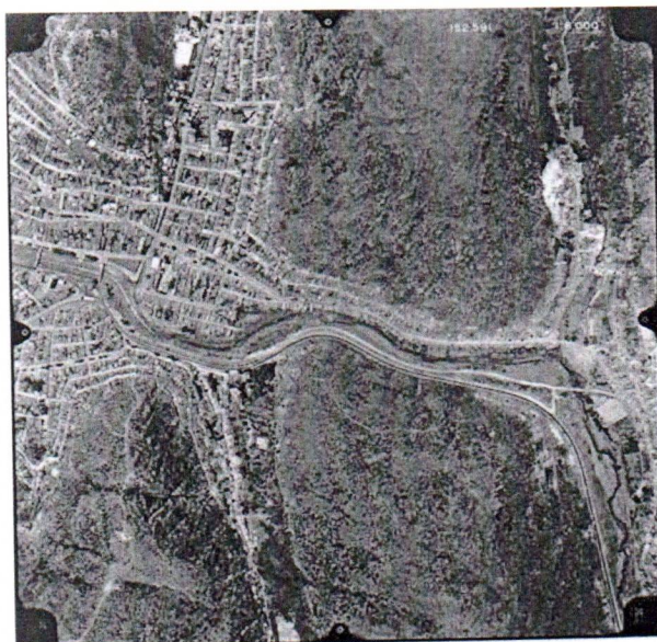
Figura 1 – Fotografia Aérea de Jacobina

O contexto histórico-espacial dessa pesquisa centra-se no município de Jacobina, interior do Estado da Bahia, local onde sou lotado como professor, no campus universitário da UNEB, onde funciona um curso de licenciatura em História.