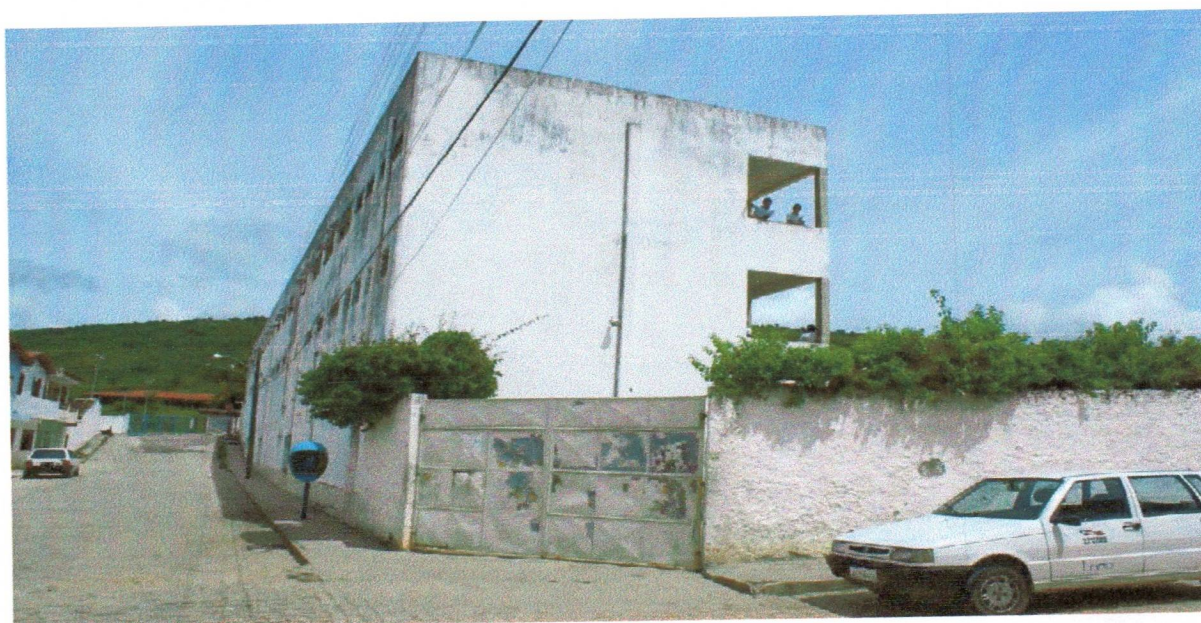
Figura 2 - Vista lateral do CGDM

“[...] bastante positivo em todos os aspectos para a melhoria da educação de jovens, crianças e adultos em Jacobina, como também na melhoria da formação de professores no citado município”.