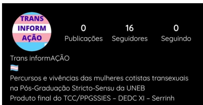
Figura 2 – Perfil do Instagram TransInformAÇÃO

A próxima ferramenta do Instagram que será utilizada com frequência serão os storys , um recurso que foi incorporado recentemente na plataforma e ganhou uma aceitação da maioria dos usuários por ser dinâmico, interativo e instantâneo. Segundo Coelho (2020, p.63) “O professor pode utilizar esse formato para comentar temas relacionados a disciplina, esclarecer dúvidas, realizar sugestões de livros, artigos, realizar enquetes e outras interações”. Cada story tem duração em média de 15 segundos e fica disponível para visualização apenas por 24 horas, depois expira, no entanto, há a possibilidade do story ser adicionado à outra ferramenta que são os “destaques”, onde o usuário seleciona os storys que ficarão disponíveis por tempo indeterminado no perfil, logo abaixo da BIO, como na imagem a seguir: