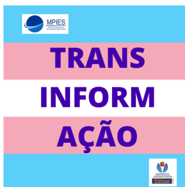
Figura 1 – Avatar do perfil Trans informAÇÃO

Feita a imagem, a primeira ferramenta que foi utilizada do Instagram foi a BIO, que é a abreviatura de “biografia” e serve para que o usuário escreva em até 150 caracteres uma breve descrição, podendo fazer o uso de letras, números e ícones.