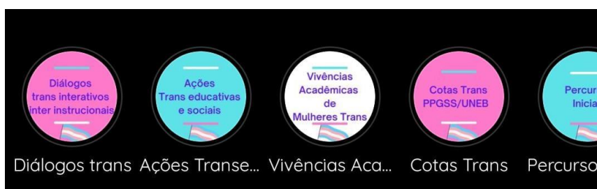
Figura 3 – Destaques do perfil do Instagram TransinformAÇÃO

A próxima ferramenta do Instagram que será utilizada com frequência serão os storys , um recurso que foi incorporado recentemente na plataforma e ganhou uma aceitação da maioria dos usuários por ser dinâmico, interativo e instantâneo. Segundo Coelho (2020, p.63) “O professor pode utilizar esse formato para comentar temas relacionados a disciplina, esclarecer dúvidas, realizar sugestões de livros, artigos, realizar enquetes e outras interações”. Cada story tem duração em média de 15 segundos e fica disponível para visualização apenas por 24 horas, depois expira, no entanto, há a possibilidade do story ser adicionado à outra ferramenta que são os “destaques”, onde o usuário seleciona os storys que ficarão disponíveis por tempo indeterminado no perfil, logo abaixo da BIO, como na imagem a seguir: