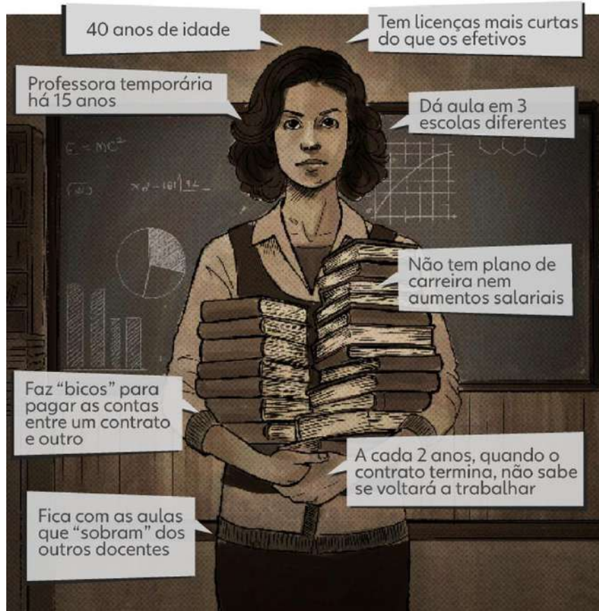
Figura 02: Precarização da Profissão Docente Alto número de professores temporários indica cenário de instabilidade e de perda de direitos

FONTE: G1 ARTE - Infográfico foi elaborado após entrevistas com professores temporários de diferentes redes estaduais.