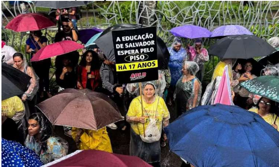
Figura 03: Professores da rede municipal de Salvador em protesto na Praça Campo Grande.

[de professor] é vagabundagem”. Estes dois episódios podem sugerir que os professores das redes municipais do Brasil se veem diante de um duplo (ou melhor, múltiplos) desafios: a luta por melhores salários e a sua desmoralização por parte de segmentos do Estado.