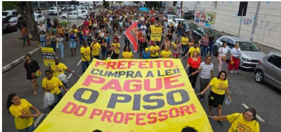
Figura 04: Professores em protesto pelo cumprimento do piso salarial do magistério pelas ruas do centro de Salvador.