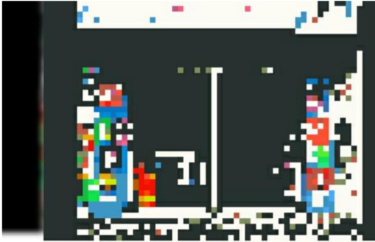
Farmácia onde foi aplicado o golpe

Ouçã: Coité – Homem é preso acusado de estelionato ao tentar depositar R$ 22 mil em correspondente bancário sem ter o dinheiro – Calila Noticias 0:00 100% Audima