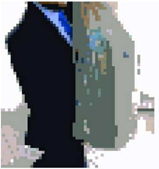
HD é apreendido e passará por perícia

O parlamentar ingressou com uma ação judicial contra o Facebook e esse forneceu os IPs (como se fosse a identidade dos computadores) e o fornecedor de Internet, ou seja, a OI, que também foi acionada, a mesma informou ao contratante e os endereços onde às linhas estavam instaladas.