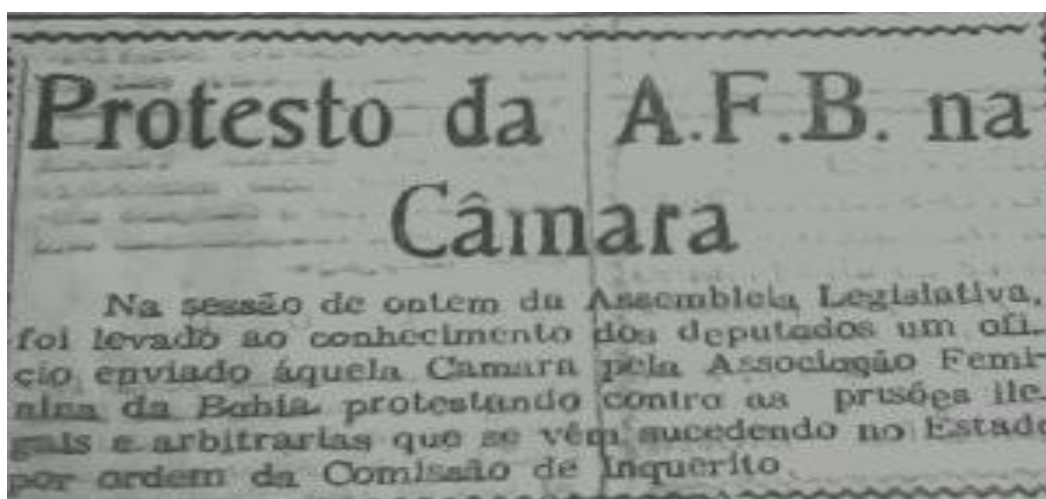
FIGURA 4 - PROTESTO DA A.F.B. NA CÂMARA FONTE: Diário do Povo, 14/11/1952, p.1

população feminina como profissionais liberais, operárias, etc. Em seu programa de trabalho incluía uma nova reivindicação específica; a reforma do código civil, resolução essa aprovada na primeira Convenção Estadual das Mulheres Baianas (1951). Fazia, também, protestos contra as injustiças no Estado e buscava a solução através de denúncias e reivindicação (O MOMENTO, 1950).