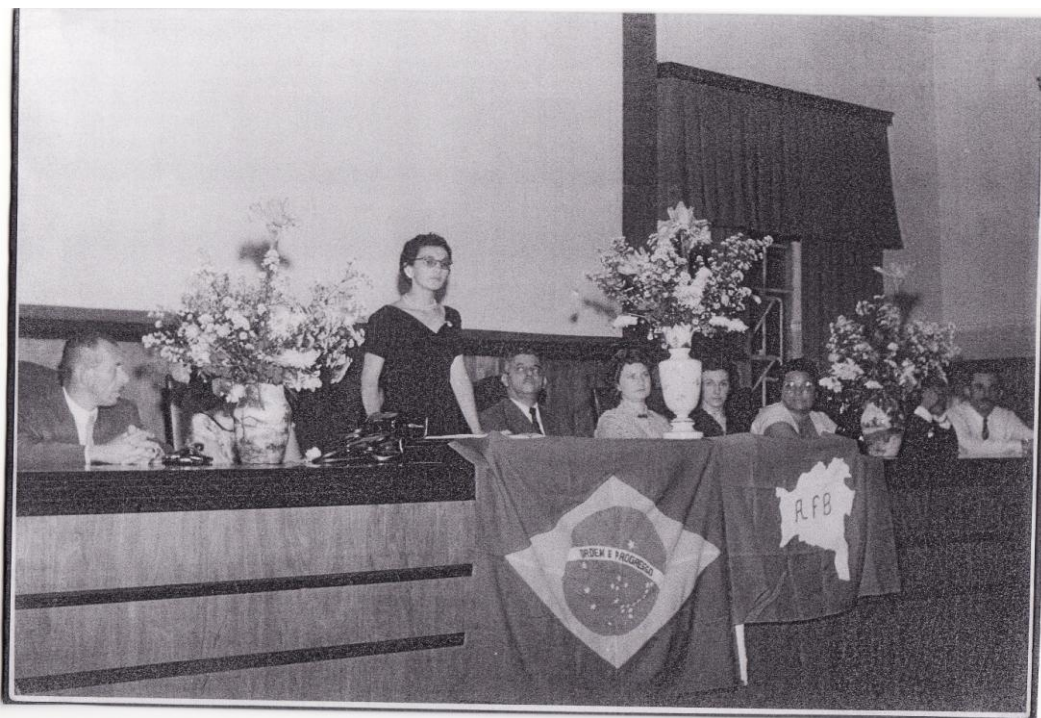
FIGURA 5 - POSSE NA PRESIDÊNCIA DA A.F.B.

Amabilia fez parte da AFB até 1957, quando o então presidente Juscelino Kubitschek tomou posse e sob o pretexto de ameaça comunista internacional mandou fechar a Federação no Rio de Janeiro, o motivo era a sua ligação com a Confederação Nacional dos Bispos do Brasil (CNBB) e ao governo da União. Logo, suas filias foram encerradas, pois não tinha como continuar funcionando na Clandestinidade, afinal era a Federação de Mulheres do Brasil que aglutinava as associações femininas de modo geral.