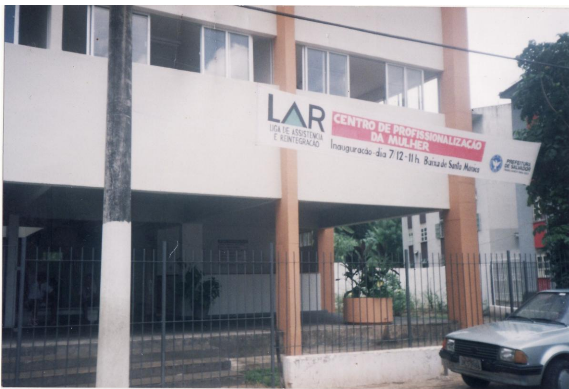
FIGURA 7: FACHADA DO PRÉDIO ONDE ESTA LOCALIZADA A CEPROM