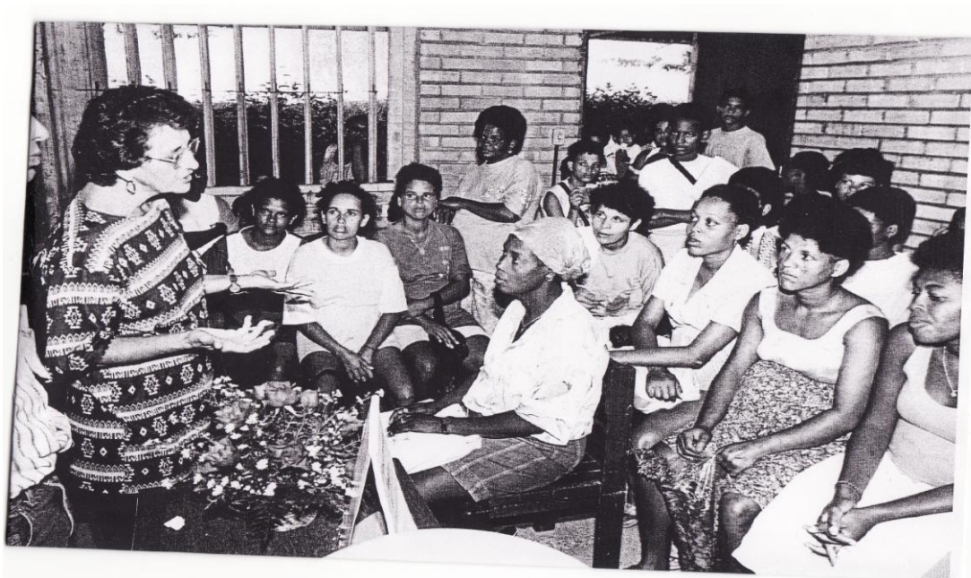
FIGURA 8: AMABILIA NA LAR COM AS MULHERES DESENVOLVENDO TRABALHO DE CONSCIENTIZAÇÃO E INFORMAÇÃO SOBRE PLANEJAMENTO FAMILIAR

O objetivo principal do projeto da CEPROM era contribuir para a incorporação das mulheres na esfera econômica e política, no sentido de melhorar as suas condições de vida e torná-las capazes de contribuir de forma mais efetiva na manutenção de sua família e na construção da cidadania coletiva.