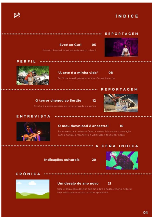
Foto 2 - Índice da Revista