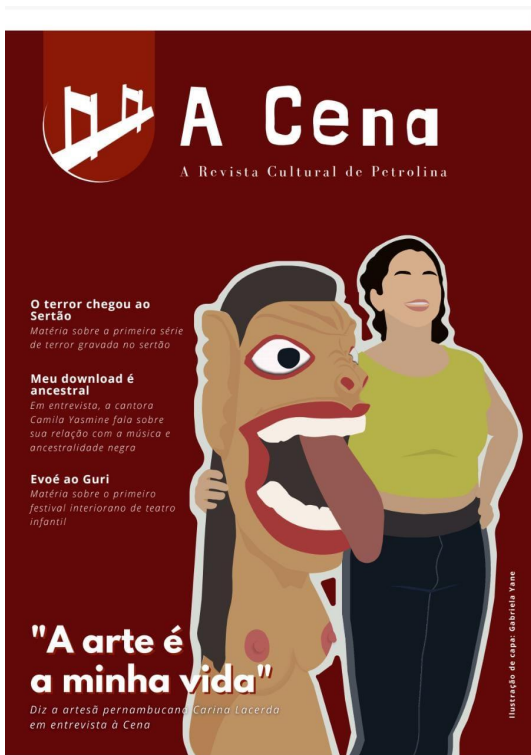
Foto 1 - Capa e perfil 'A arte é minha vida'