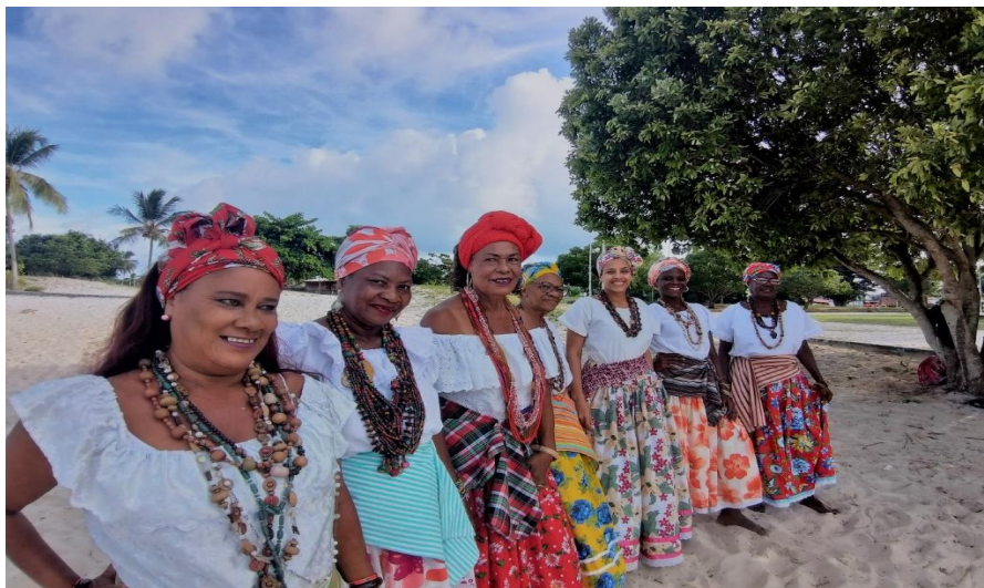
Figura 3- "As Ganhadeiras de Itapuã"