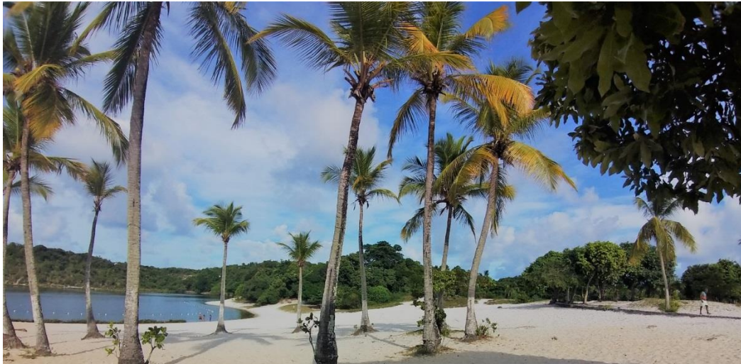
Figura 2- A Lagoa do Abaeté