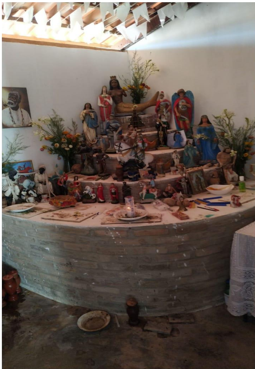
Figura 2: Altar onde são realizadas as benzeções por Élico Thiago.

curador e pai de santo, a Umbanda é “um pé no umbandismo e um pé no catolicismo”. Em sua definição, a Umbanda é uma religião que tem a mistura entre um pouco do catolicismo e um pouco do Candomblé e um pouco de espiritismo.