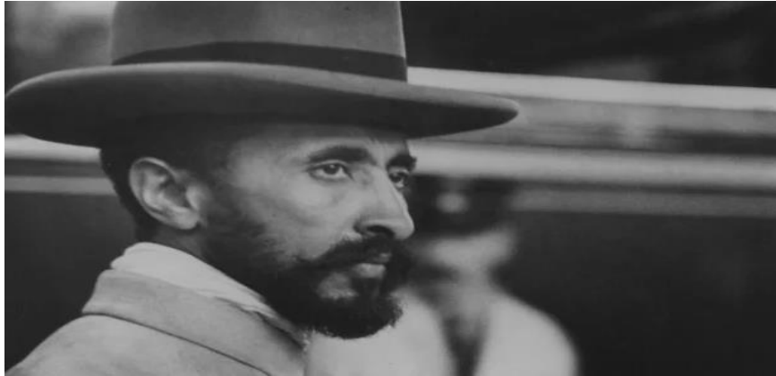
Figura 2- Haile Selassie