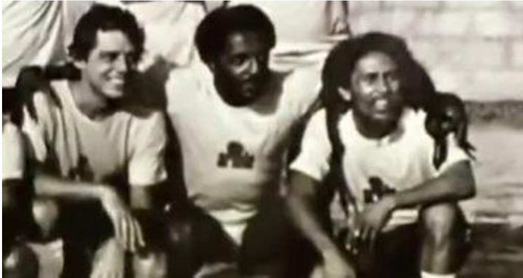
Figura 3 – Vinda de Bob Marley para o Brasil