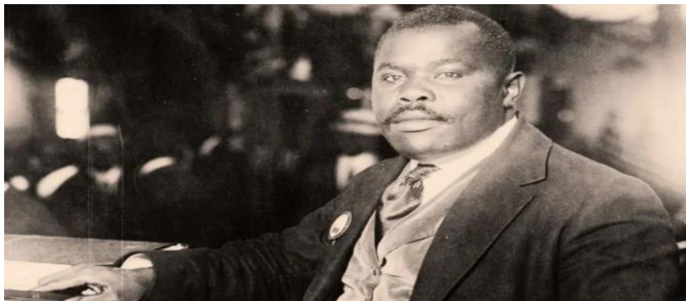
Figura 1- Marcus Garvey

A origem do rastafarianismo na Jamaica está associada à imagem de Garvey, um nome expressivo na comunidade negra. Ele nasceu em 1887, em Sain't Ann's Bay, Jamaica. Garvey anunciava que, através de um rei africano, os negros retornariam à África. Nesse contexto, usava a expressão “olhem para a África, pois quando um rei negro for coroado, o dia da libertação estará próximo”. A coroação de Selassie 8 , considerado o messias do rastafarianismo, na Etiópia fez com que os africanos associassem o fato ao cumprimento da profecia de Marcus Garvey 9 , um dos mentores do Pan-Africanismo (Movimento teórico-político que surge no período da diáspora africana).