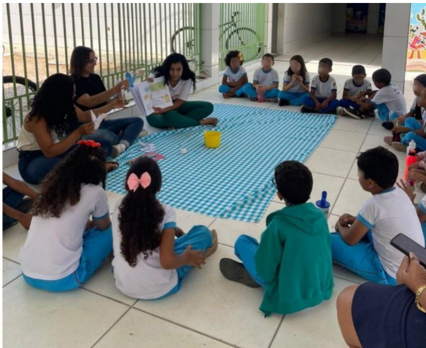
Figura 02- Mesma organização, adaptando o espaço