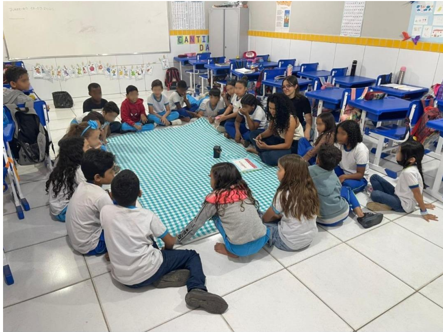
Figura 01- Mesas e cadeiras movidas para as laterais com tapete no centro.