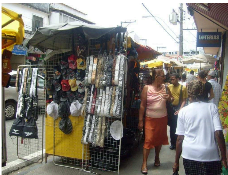
Foto 07 – Barraca desmontável, realizada por Amanda Santos, 2008.

O novo perfil do trabalhador urbano, no caso específico o informal, interfere diretamente no urbanismo, isso porque com o aumento da informalidade nos centros urbanos, resultante da rígida situação de desemprego, fez com que o trabalho evoluísse do ambiente interno para a base externa da cidade. Esse fenômeno tem contribuído para o aumento dos engarrafamentos, o forte impacto na paisagem urbana, a precarização do uso da calçada, como mostra a foto - 07 da área de estudo.