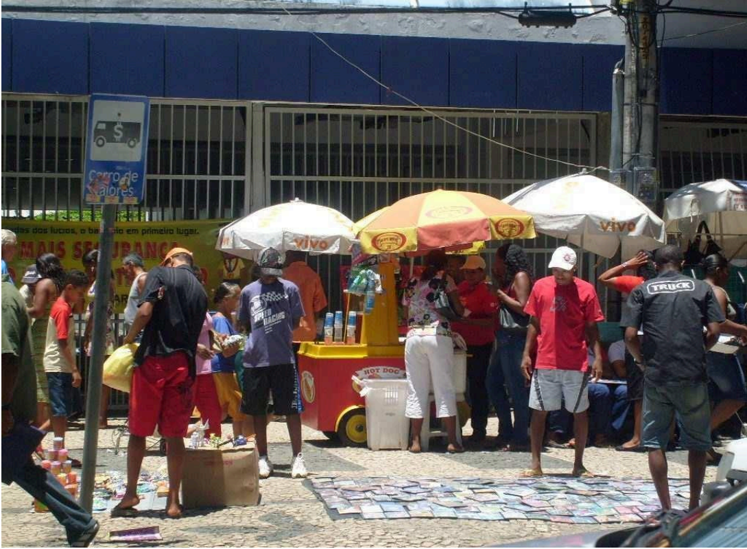
Foto 08 – Avenida Sete de Setembro, elaborada por Amanda Santos, 2008