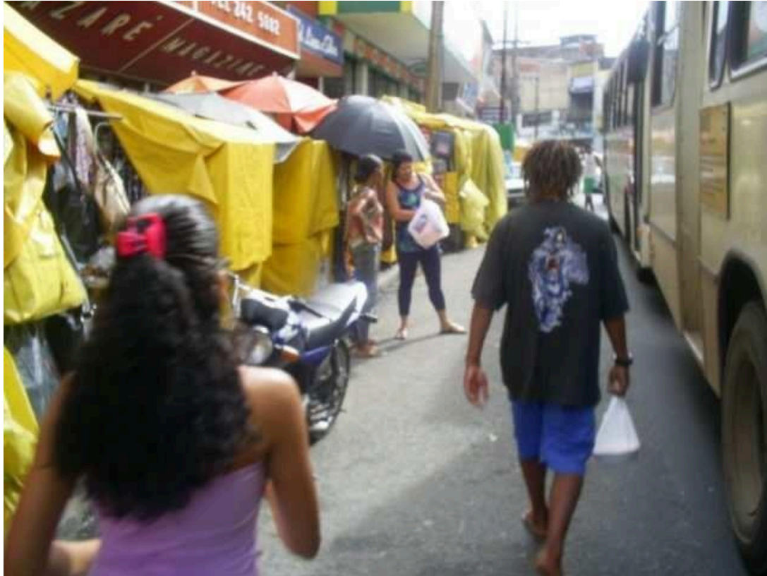
Foto 10 – Estrada da Liberdade, elaborada por Amanda Santos, 2008

As fotos 08, 09 e 10 ajudam a mostrar como a atividade informal está enraizada em áreas centrais da cidade de Salvador, onde há um predomínio nas principais vias de circulação e estando inserida nessas vias de pedestres, torna-se um caos a circulação.