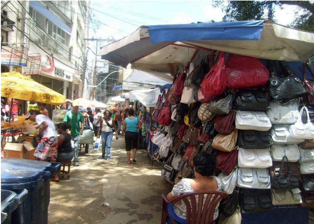
Foto 09 – Relógio de São Pedro, elaborada por Amanda Santos, 2008