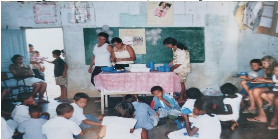
Figura 4: Momento de confraternização na Escola Miguel Gomes