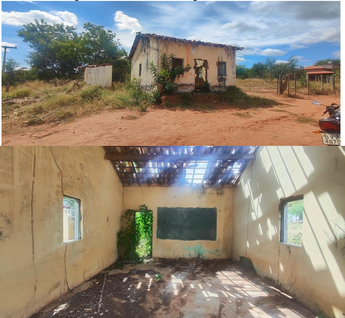
Figura 2: Estrutura da Escola Miguel Gomes em 2025