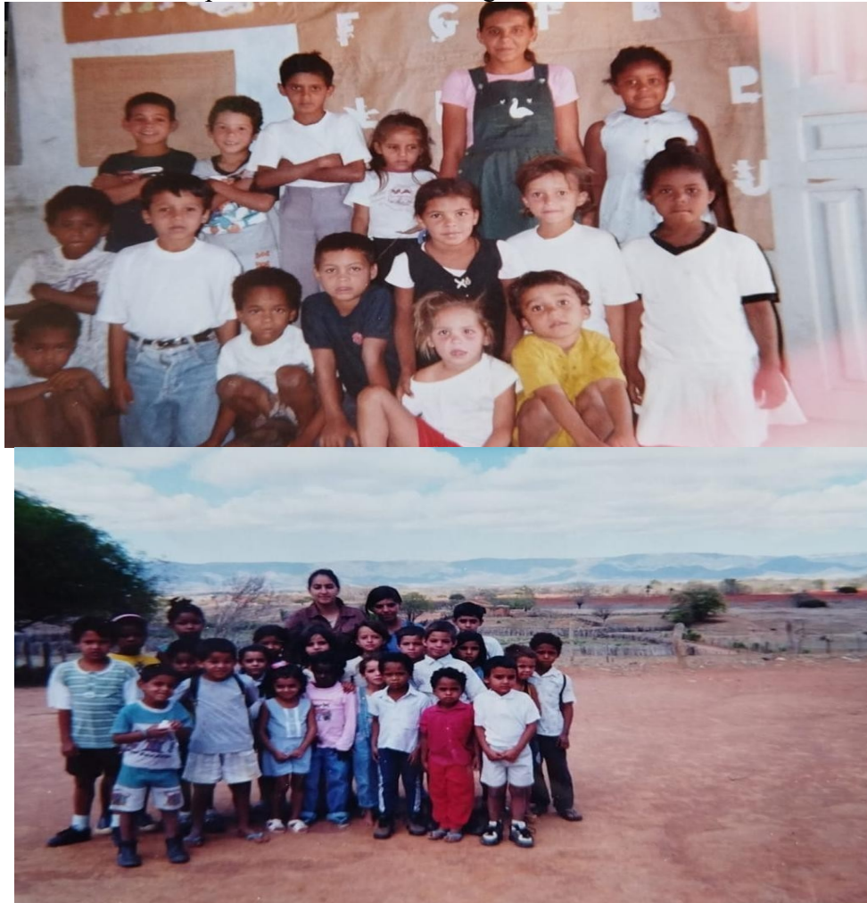
Figura 3: Estudantes e professora da Escola Miguel Gomes no final da década de 1990