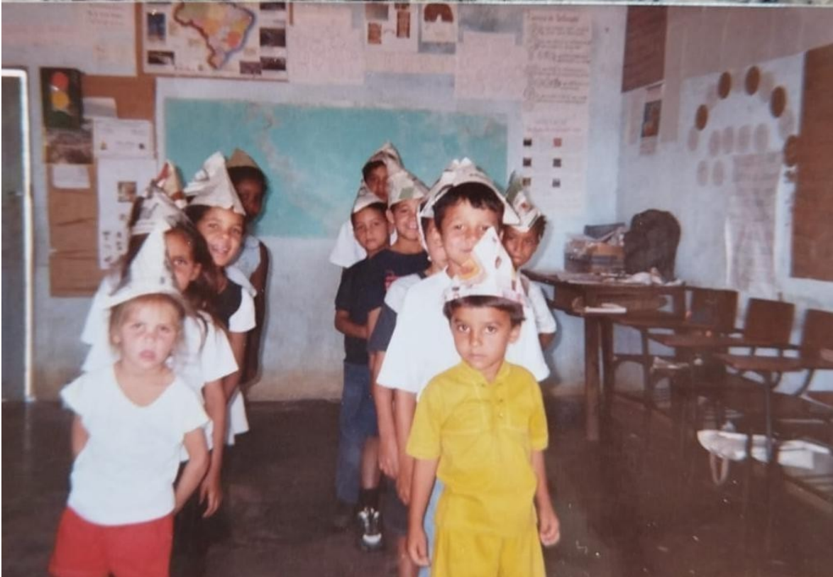
Figura 5: Registro de prática pedagógica da Escola Miguel Gomes

Fonte: fotografia pertencentes à professora Laurita.