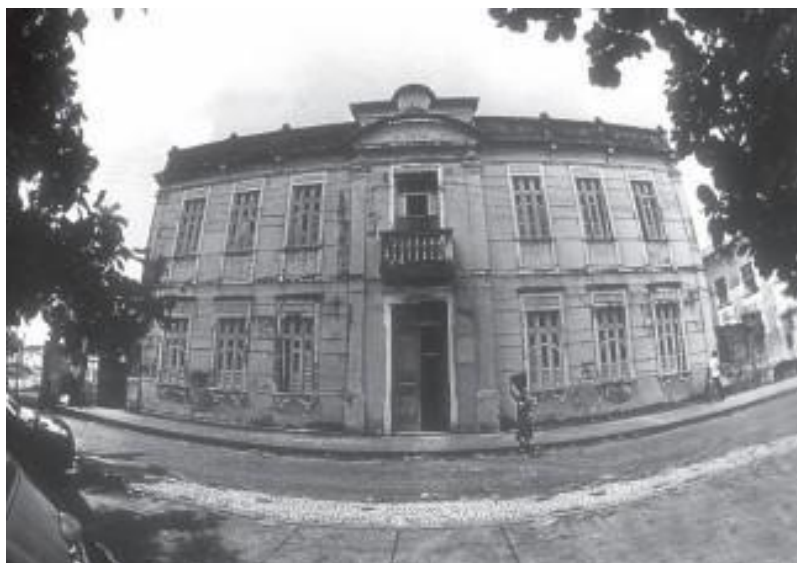
Figura 3: Pavilhão Anísio Circundes – pacientes femininos.