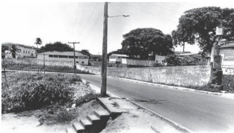
Figura 1: Acesso principal ao Hospício São João de Deus, Brotas