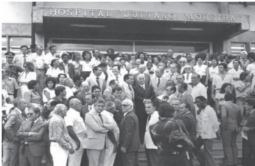
Figura 4:Evento comemorativo do novo prédio do hospital, em Narandiba