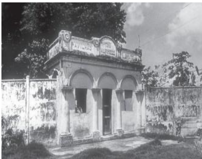
Figura 2: Pavilhão Alfredo Britto- Pacientes feminino