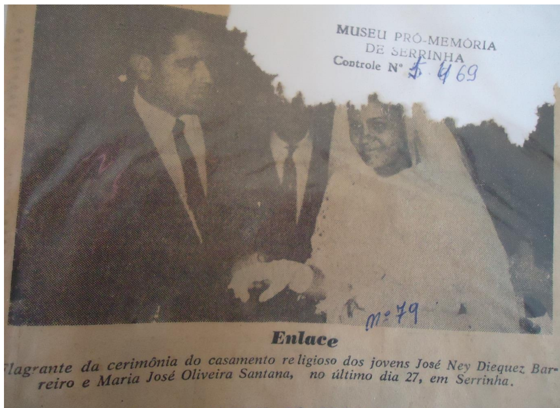
Figura 5 - Casamento religioso na ACS