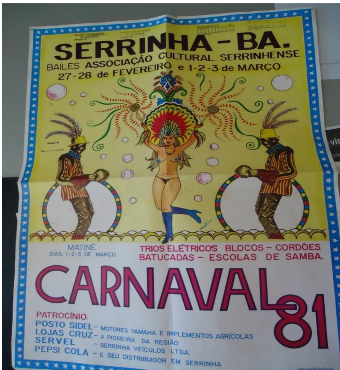
Figura 2- Cartaz publicitário da ACS

um interesse dos sócios da ACS, todos do sexo masculino, de “mostrar ao povo o modo de se divertir” (PEREIRA, 2002, p. 314).