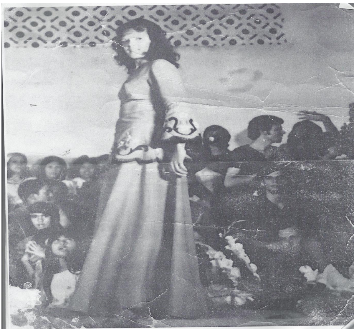
Jornal A Tarde 1971, Museu Pro Memória, Serrinha.