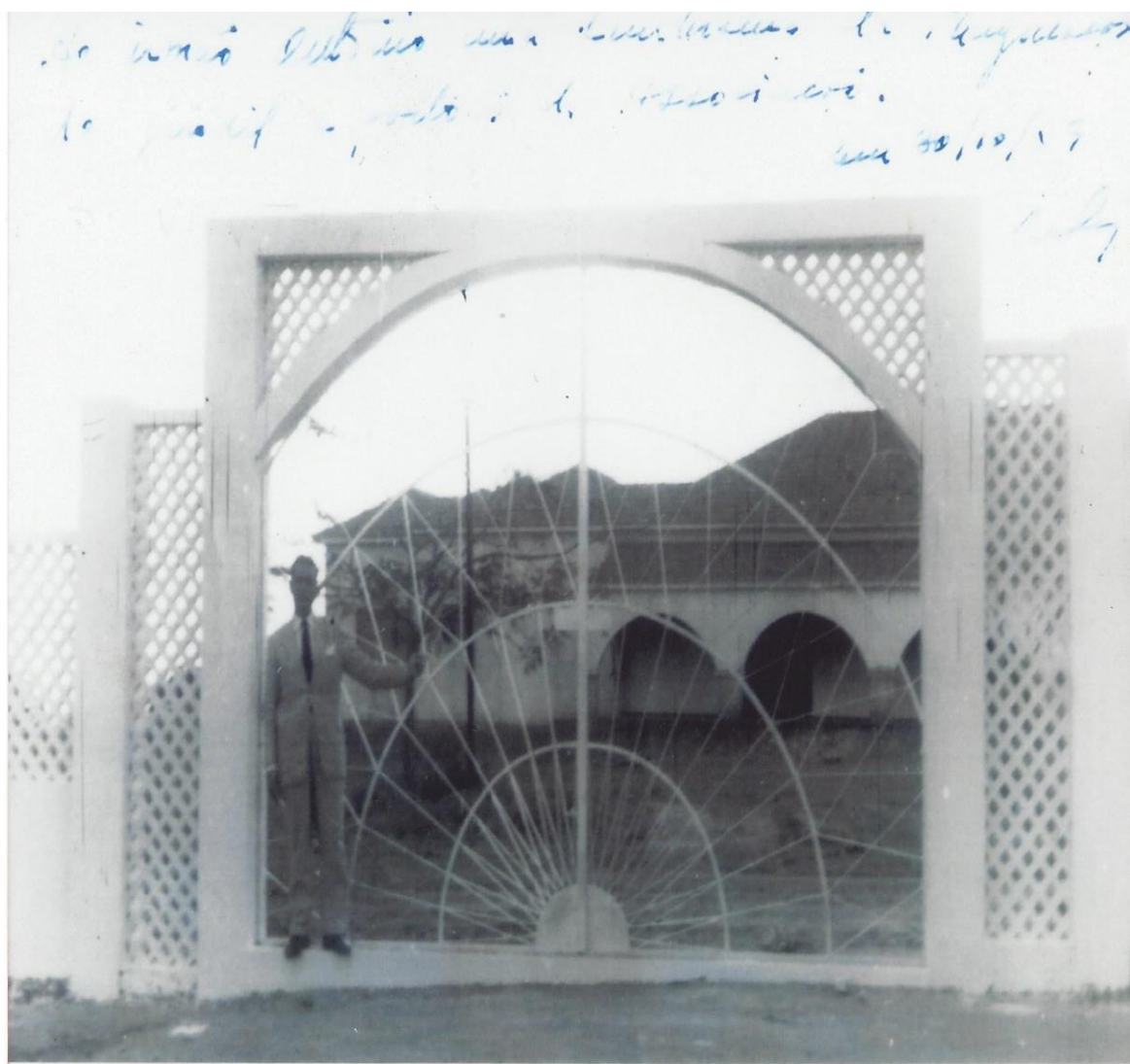
Figura 1- Fachada da Associação Cultural Serrinhense

Conforme registros encontrados no Cartório de Registros, do Fórum Luiza Viana Filho, no município de Serrinha, a Associação Desportiva Serrinhense foi fundada em 30 de outubro de 1953, tendo como os primeiros sócios muitos membros da elite local de Serrinha. Em 1962, ela passa a se chamar Associação Cultural de Serrinha (ACS).