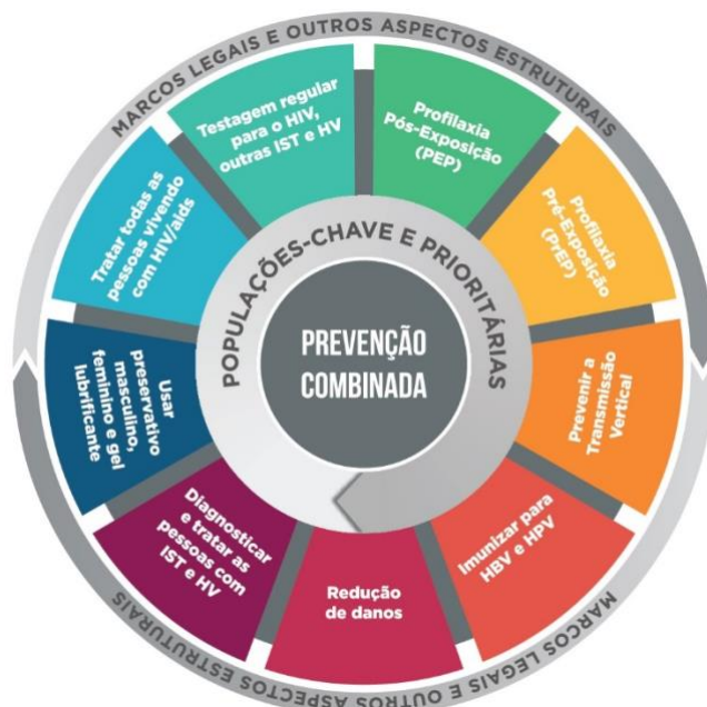
Figura 1 – Mandala da prevenção combinada ao HIV

2023; MORA; BRIGEIRO; MONTEIRO, 2018; PEREIRA et al. , 2019; UNAIDS, 2021; URBANO, 2022).