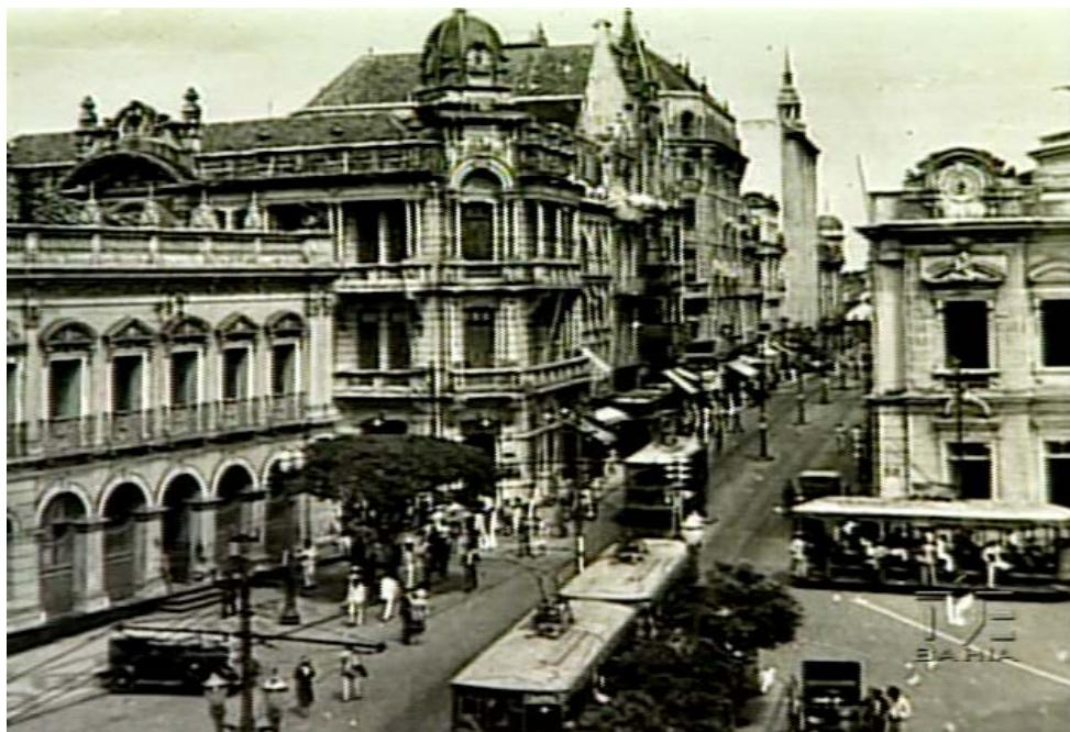
Figura 1 – Antiga Rua dos Mercadores, atual Rua Chile (S/D)