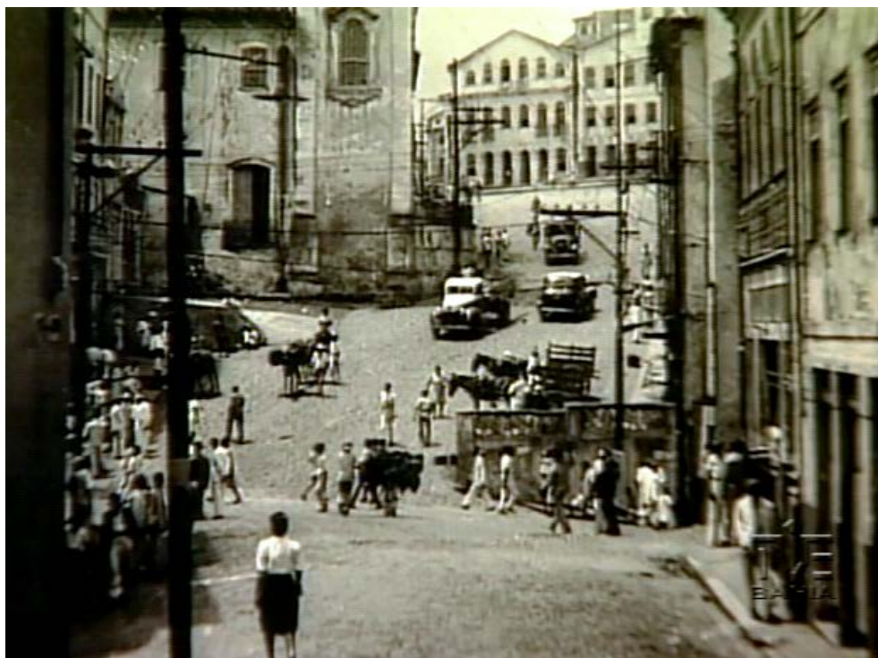
Figura 5 – Vista do Largo do Pelourinho (S/D)

Novas formas de organização familiar, a oferta de alternativas melhores de moradias em locais afastados do centro, bem como as exigências de saneamento básico, fizeram com que a classe social abastada da população fosse habitar outras áreas da cidade. Esse deslocamento ocorrido em meados do século XIX, fez com que o centro de Salvador fosse gradativamente abandonado, relocando os casarios para grupos de renda mais baixas, e comerciantes da área.