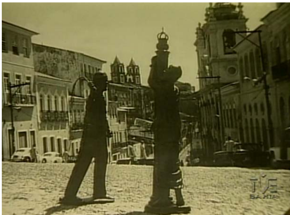
Figura 4 – Tronco de madeira e argolas no Pelourinho para castigar escravos (S/D)

nome, e a aldeia dos Jesuítas, hoje terreiro de Jesus, como se pode observar no mapa. As ruas que surgiram nesse caminho com o passar dos tempos, deram origem a um largo em declive onde se localizava um tronco público de madeira com argolas, utilizado para castigar os escravos e infratores.