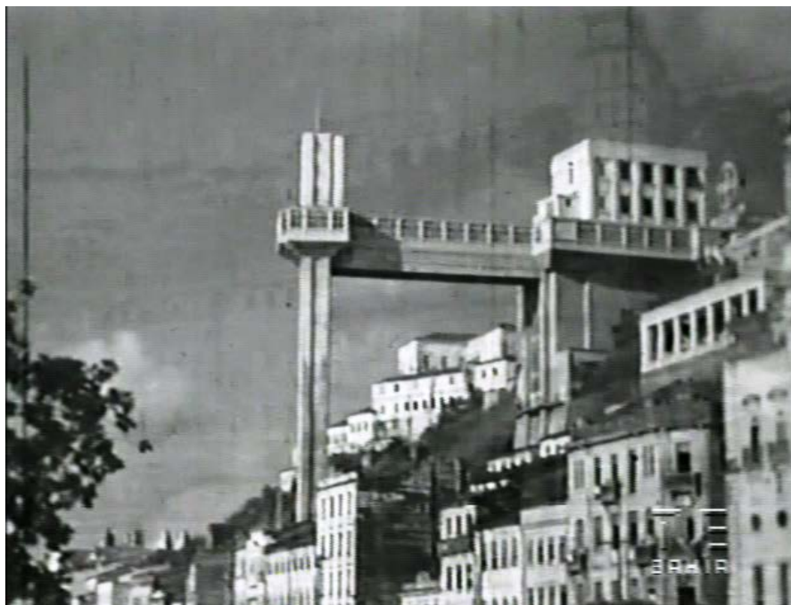
Figura 2 – Elevador Lacerda (S/D)