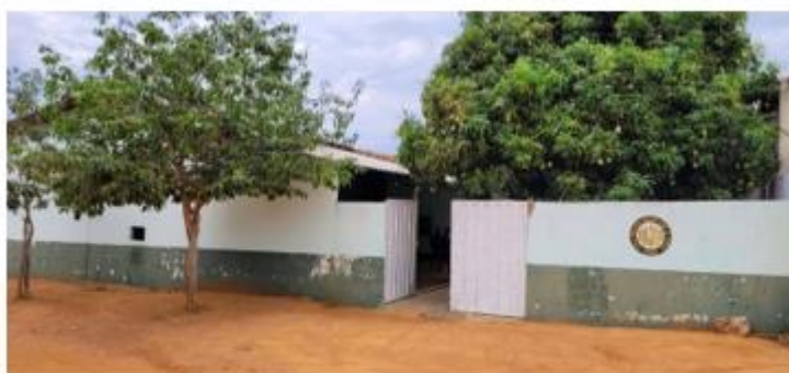
Figura 3 – Fachada da Escola

A criação da Unidade Escolar Joaquim Alves de Oliveira (Figura 3) deu-se pela necessidade de garantir a continuidade dos estudos de crianças e jovens que, ao concluírem a 4ª série, interrompiam sua formação por falta de outra escola que oferecesse os anos finais do ensino fundamental (antigo ginásial).