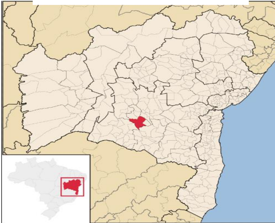
Figura 1 - Município de Livramento de Nossa Senhora

mapa não apenas localiza o espaço físico da pesquisa, mas também contribui para a leitura do território como elemento formador da identidade social e educacional das comunidades que integram o entorno da Escola Municipal Joaquim Alves de Oliveira.