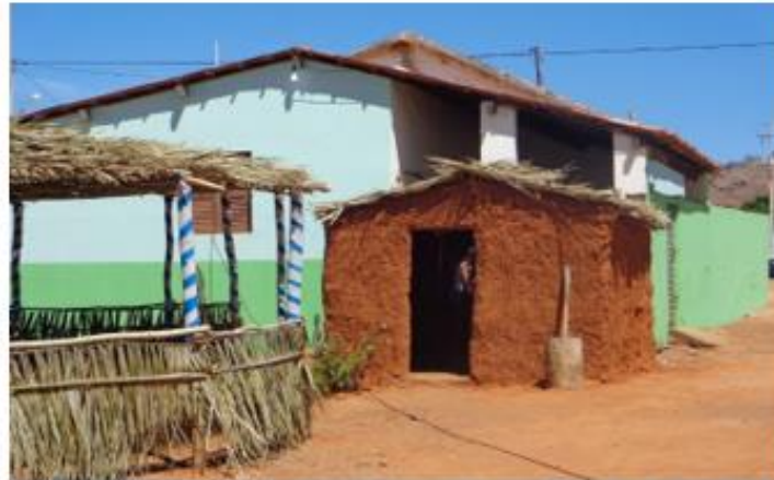
Figura 6 – Projeto Cultural