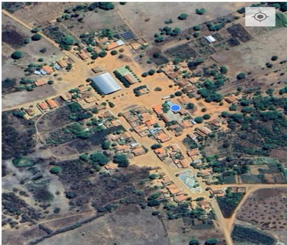
Figura 2 – Mapa do Mucambo

filhos. Segundo relatos locais, o nome "Mucambo" deriva de "Mocambo", e remonta a antigos mocambos formados por pessoas que buscavam refúgio na região. O verdadeiro "Mocambo" não corresponderia ao local atual do povoado, mas sim a uma antiga fazenda situada aproximadamente dois quilômetros ao norte do atual povoado, ou seja, no início de sua povoação, Mucambo era chamado de Engenho. A Figura 2, obtida por meio do Google Maps, tem o objetivo de situar geograficamente o campo empírico da pesquisa, localizado na zona rural do município de Livramento de Nossa Senhora, Bahia. Tal recurso contribui para a compreensão do contexto socioespacial em que se insere a Escola Municipal Joaquim Alves de Oliveira, fortalecendo a análise das relações entre território, identidade e educação.