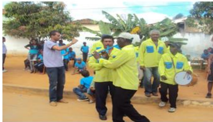
Figura 7 – Projeto de Cultura Afro