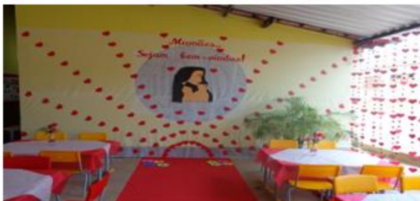
Figura 5 - Projeto de Dia das Mães