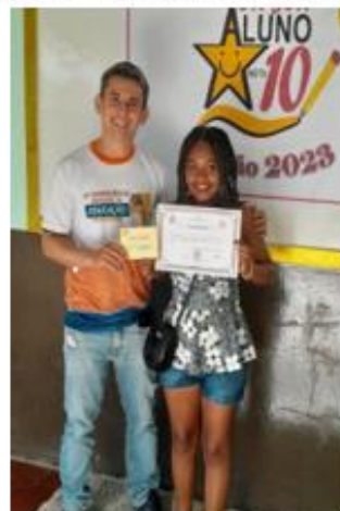
Figura 8 – Projeto Aluno Nota 10