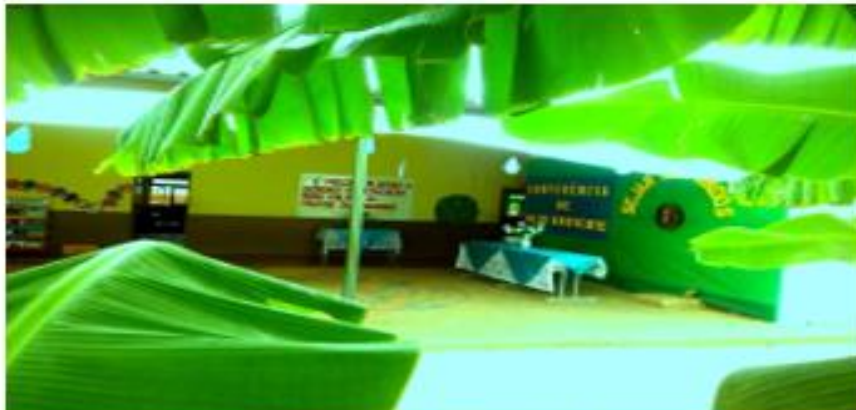
Figura 4 - Projeto de Meio Ambiente

A escola desenvolve projetos alinhados com as demandas da comunidade, pois, apesar das dificuldades enfrentadas para a implementação plena da Lei nº 10.639/03, marcadas por tensões estruturais, ausência de formação continuada e escassez de materiais didáticos específicos, os projetos desenvolvidos pela Escola Municipal Joaquim Alves de Oliveira têm representado uma resposta concreta ao vácuo deixado por essas lacunas institucionais. Essas iniciativas, muitas vezes articuladas por professores engajados, possibilitam práticas pedagógicas que valorizam a identidade negra e promovem o ensino da História e Cultura Africana e Afro-brasileira, ainda que dentro de limites impostos por uma estrutura escolar que nem sempre favorece a continuidade e aprofundamento dessas ações. Dentre os projetos, destacam: Encontro das Comunidades Quilombolas, Projeto de Cultura Afro e Afro-Brasileira, Projeto de Meio Ambiente, Projeto Aluno Nota 10, Projeto Dia das Mães e Projetos Culturais diversos.