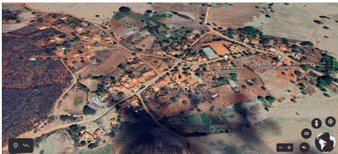
Figura 1: Canabrava dos Farias atualmente

onde os valores e costumes são extremamente conservadores, sobretudo se tratando de Caetité, cidade que abrigou uma elite tanto política quanto intelectual e que foi fundada nas bases do escravismo, do patriarcalismo, da aristocracia branca e seguindo os preceitos da ideologia higienista e burguesa, carregando essa herança até os dias atuais.