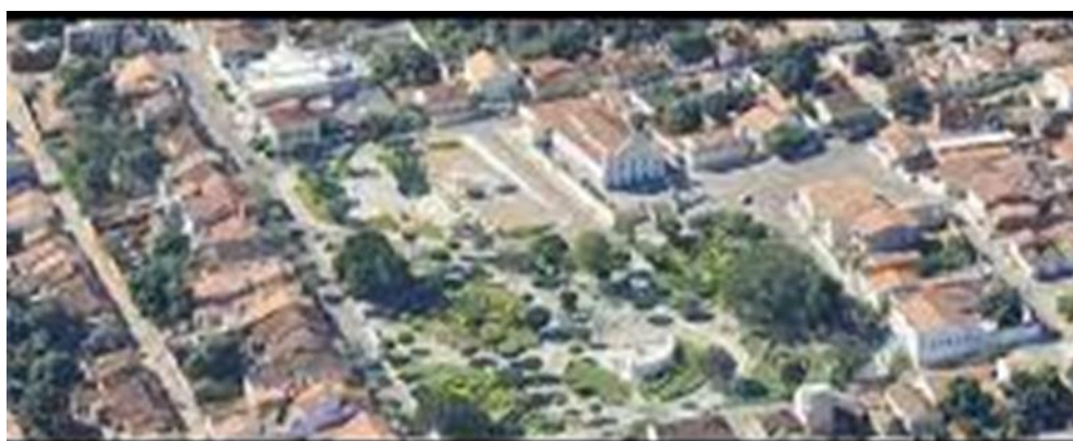
Figura 1- Vista panorâmica do município de Riacho de Santana (BA)

Quanto ao cenário da pesquisa, escolhemos o município de Riacho de Santana, por ser onde a pesquisadora reside. O município de Riacho de Santana, fica localizado na zona fisiográfica do Médio São Francisco e situado no Vale do São Francisco. Faz fronteira com os municípios de Macaúbas, Igaporã, Matina, Palmas de Monte Alto e Bom Jesus da Lapa. O município conta com uma população de 35.757 habitantes (estimativa IBGE, 2021) distribuídos em uma área de 3.183, 897 KM.