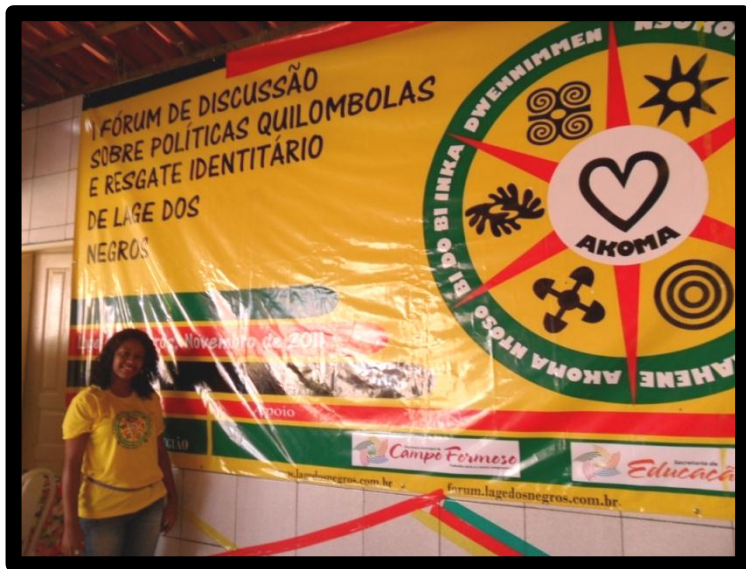
20 de novembro de 2011, I Fórum de Discussão Sobre Políticas Quilombolas.