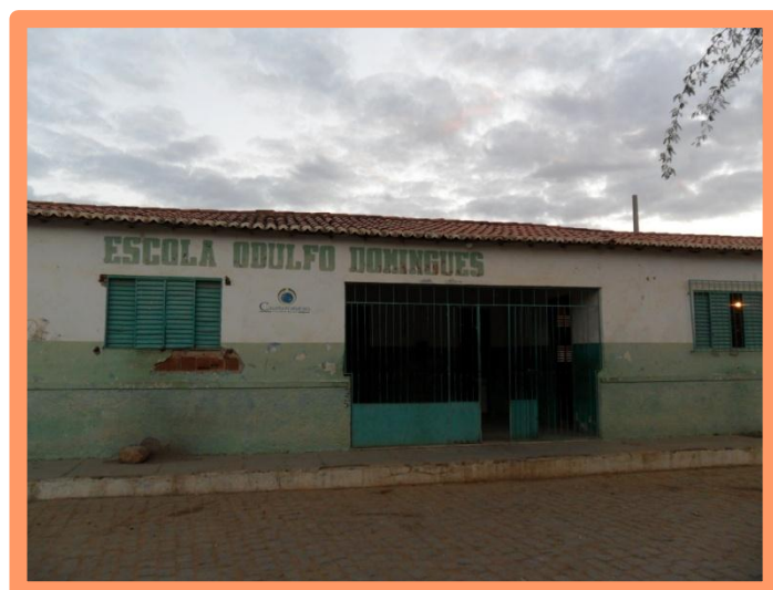
Escola Odulfo Domingues