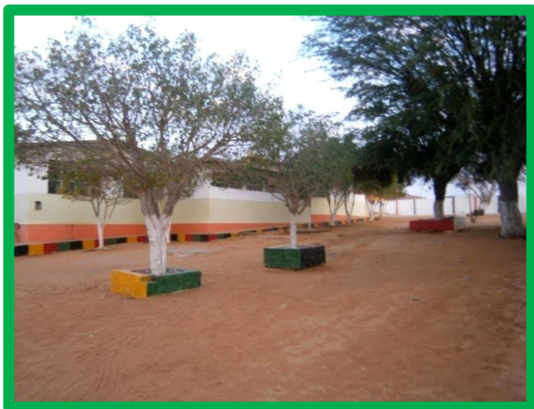
Colégio Municipal Rosalvo Luis Celestino