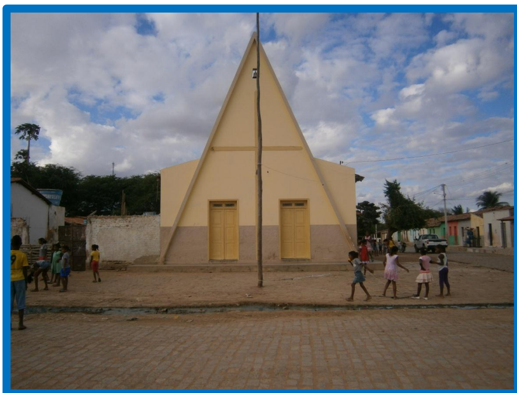
Centro da Comunidade Quilombola de Lages dos Negros, Igreja Católica