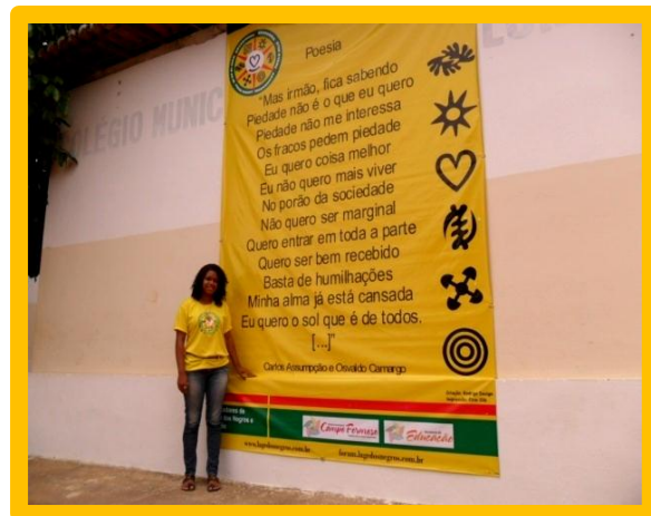
Sandri (I Fórum de Discussão Sobre Políticas Quilombolas e Resgate Identitário de Lages dos Negros, 20 de novembro de 2011.