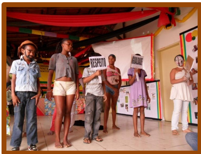
Peça teatral representando a comunidade de Lages dos Negros, 20 de novembro de 2011