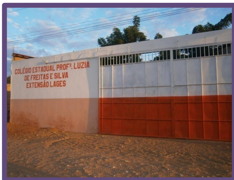
Colégio Estadual Prof a Luzia de Freitas e Silva (Extensão Lages)