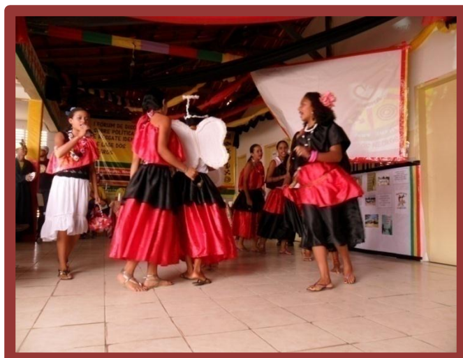
Apresentação de manifestação cultural, Lages dos Negros, 20 de novembro de 2011.