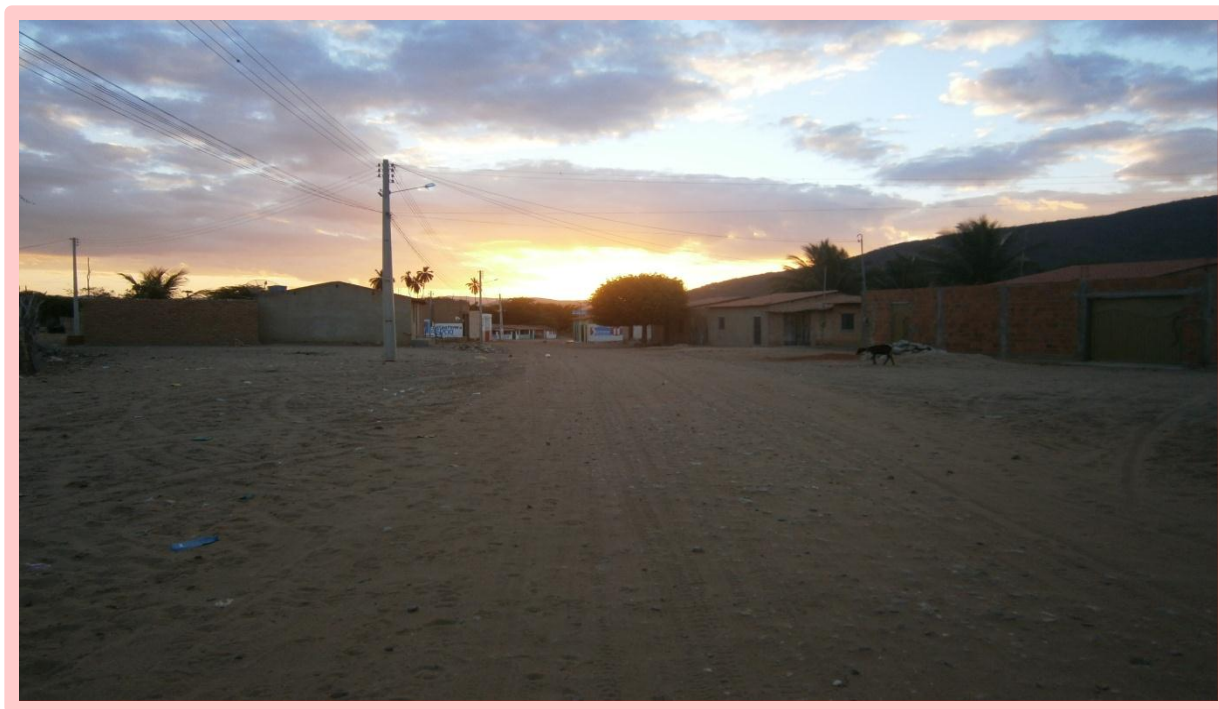
Comunidade Quilombola de Lages dos Negros