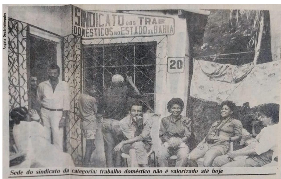
Imagem 2: Recorte de jornal da primeira Sede do Sindicato dos Trabalhadores Domésticos no Estado da Bahia em 1991