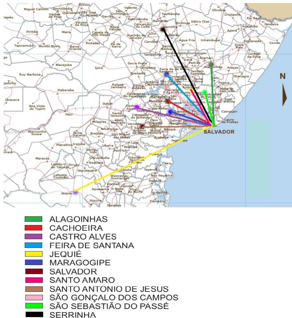
Mapa 1- Origem/Destino: Do interior da Bahia para Salvador