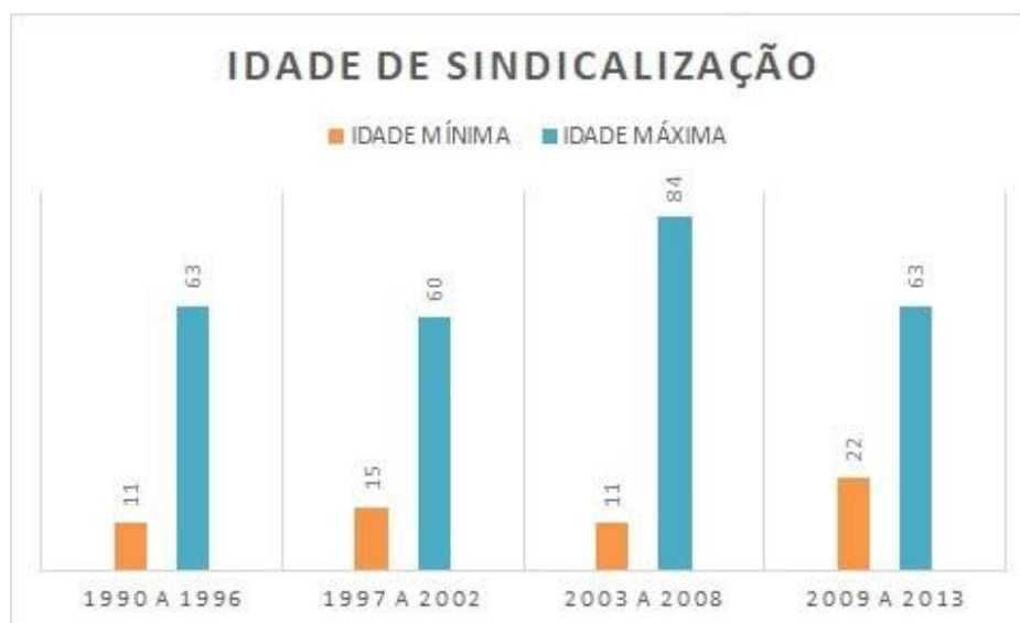
Gráfico 3: Faixa etária de Trabalhadoras sindicalizadas por ano