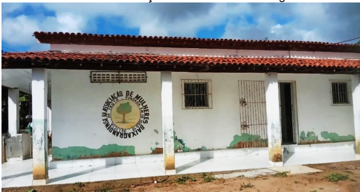
Foto 1- Sede da Associação de Mulheres Baixagrândense - BA