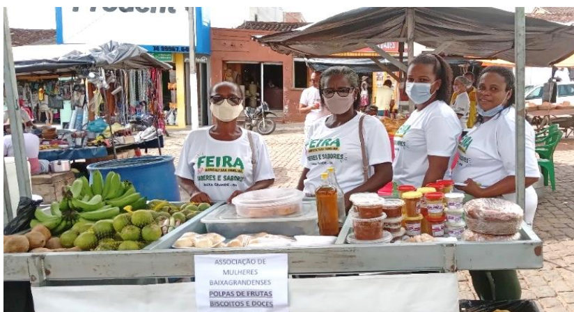
Figura 3 - AMBG na Feira da Agricultura Familiar-Saberes e Sabores