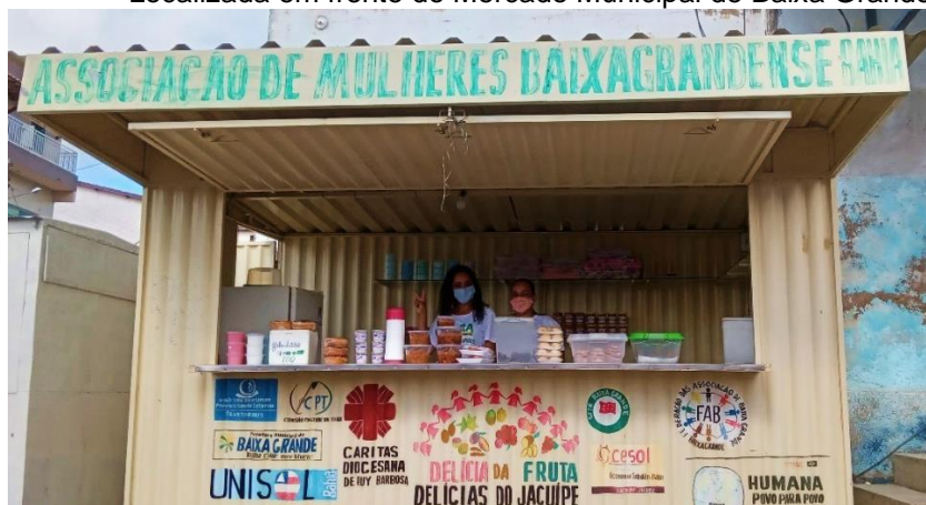
Figura 2 - Barraca da Associação de Mulheres Baixagrândense - Bahia Localizada em frente do Mercado Municipal de Baixa Grande