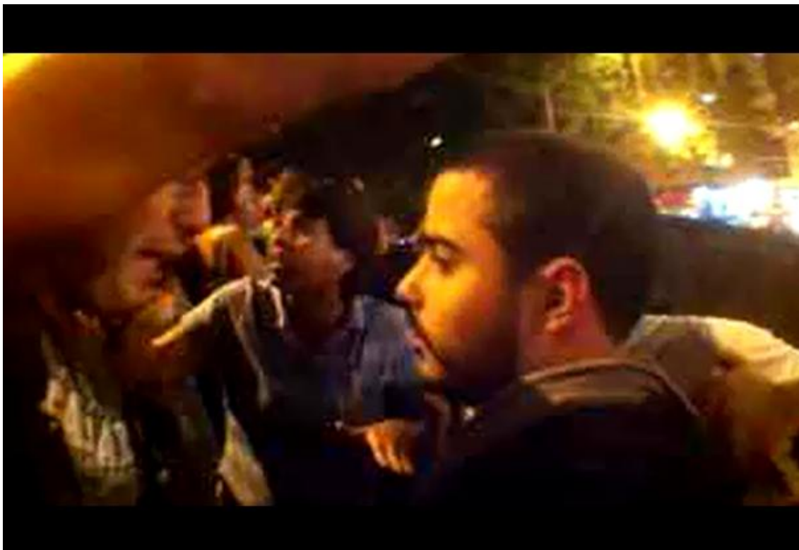
Imagem 5: Frame de vídeo da transmissão da Mídia Ninja, na Cinelândia, Rio de Janeiro em 22/07/2013; a cena mostra a discussão entre manifestantes em ocasião da presença de um agente duplo (p2) da Polícia Militar.

das ruas. Nestas imagens aparecem cenas de dissenso e discussões até entre os próprios manifestantes, trazendo para o monitor o clima de tensão das ruas, flagrando os embates micropolíticos dos protestos (ver imagem 5).