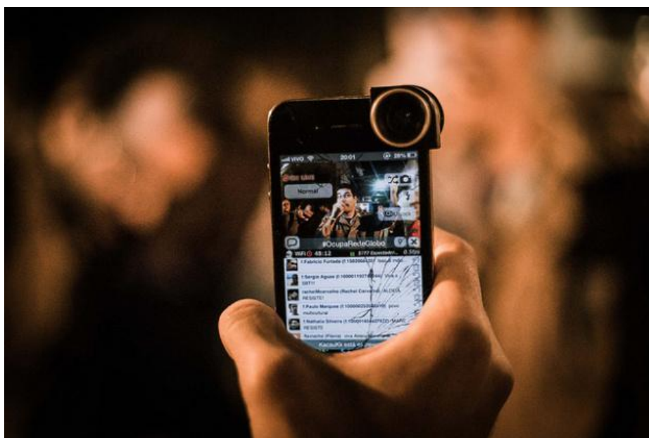
Imagem 1: Transmissão ao vivo através de aparelho celular ( Smartphone ).

A principal ferramenta na produção dos vídeos nas transmissões da Mídia Ninja é o aparelho celular (imagem 1). Tais aparelhos possuem recursos como câmera digital e acesso à internet, seja através da rede móvel ou rede sem fio ( wireless ). Os smartphones funcionam como pequenos “computadores” capazes de produzir e armazenar informações: textos, troca de mensagens, mensagens de voz, imagens e vídeos, e ainda possibilita o compartilhamento de tais informações através das redes sociais.