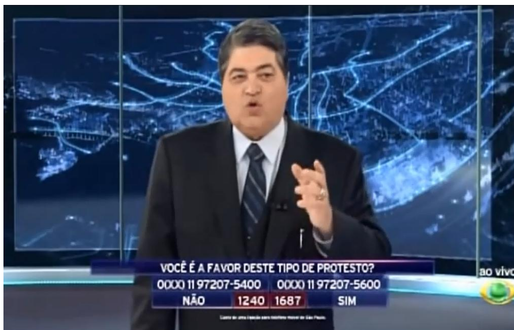
Imagem 15: Frame de vídeo da enquete posta no ar no Programa Brasil Urgente em 13/06/2013, durante a manifestação contra redução de tarifas em São Paulo.

desmentiam. Portanto, a estratégia midiática do consenso simulado, nas Jornadas de junho, sofreu deslocamentos que colocaram em perspectiva a perda do controle, ainda que por algumas semanas, sobre a produção imagética do espaço urbano e suas lutas.