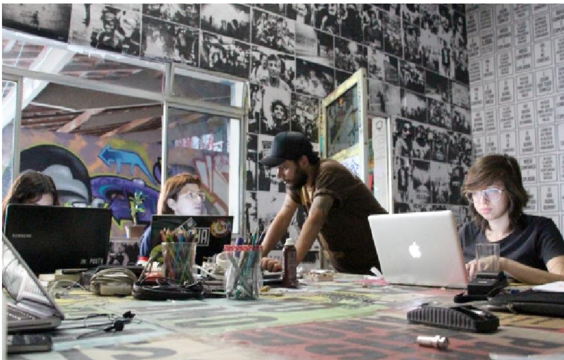
Imagem 6: Redação da Mídia Ninja que funciona dentro da Casa Fora do Eixo em São Paulo e que serviu de base para a articulação das transmissões nas Jornadas de junho.