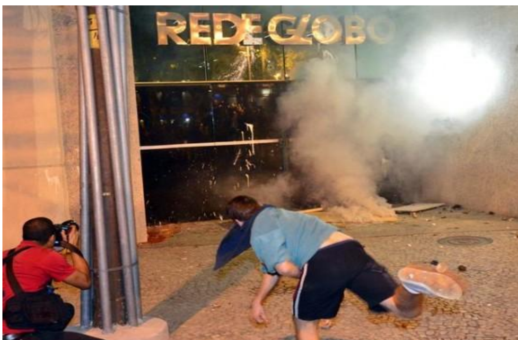
Imagem 14: Manifestante deprestando sede da Rede Globo no Rio de Janeiro.