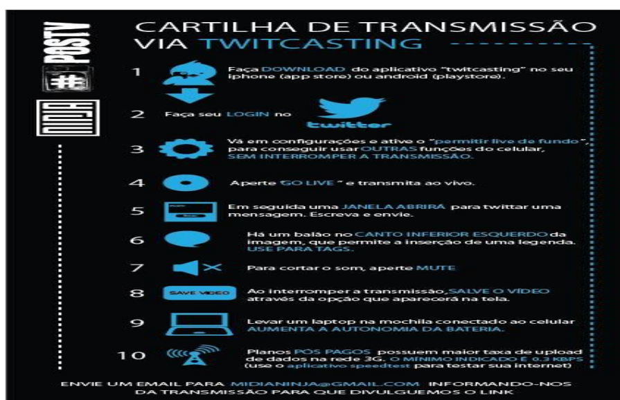
Imagem 7: Cartilha ensinando como transmitir ao vivo através do aparelho celular, veiculada através do Facebook e Twitter pela Mídia Ninja durante as manifestações das Jornadas de junho.

Na medida em que as manifestações se multiplicavam pelo país, foram aparecendo transmissões deste tipo nas redes sociais. Segundo o próprio Torturra, muitas destas transmissões que surgiram com a marcação #midianinja não foram articuladas por seus precursores de São Paulo. Surgiram de forma fluida, a partir do contato com as primeiras transmissões da Mídia Ninja pela rede e pela divulgação, ai sim pelos próprios ninjas, de um panfleto digital (Imagem 7), divulgado através do Facebook e Twitter, ensinando o processo para preparar o celular para transmissões ao vivo em streaming.