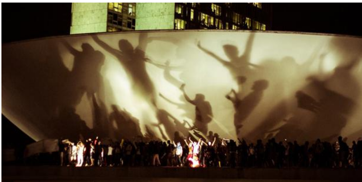
Imagem 18: Fotografia tirada por um colaborador da Mídia Ninja no dia 17 de junho, fazendo a cobertura da ocupação do Palácio do Planalto, em Brasília DF, pelos manifestantes em fervor político.

Pois foi nestas microrrelações cotidianas, nos embates e debates diante de telas de TV e monitores de notebooks , através de aparelhos celulares e troca de mensagens que outras imagens do urbano emergiram, ocuparam o ciberespaço ao mesmo tempo em que as ruas eram ocupadas pelo furor político da revolta (imagem 18). Foi através dessa relação com a materialidade técnica, posta em movimento no cotidiano urbano contemporâneo e atravessada pelas disputas impulsionadas pelas manifestações, que o cenário urbano surge duplicado em imagens que mostram o desfile das heterogeneidades, onde o dissenso aparece para reconfigurar à trama do espaço urbano midiaticado.