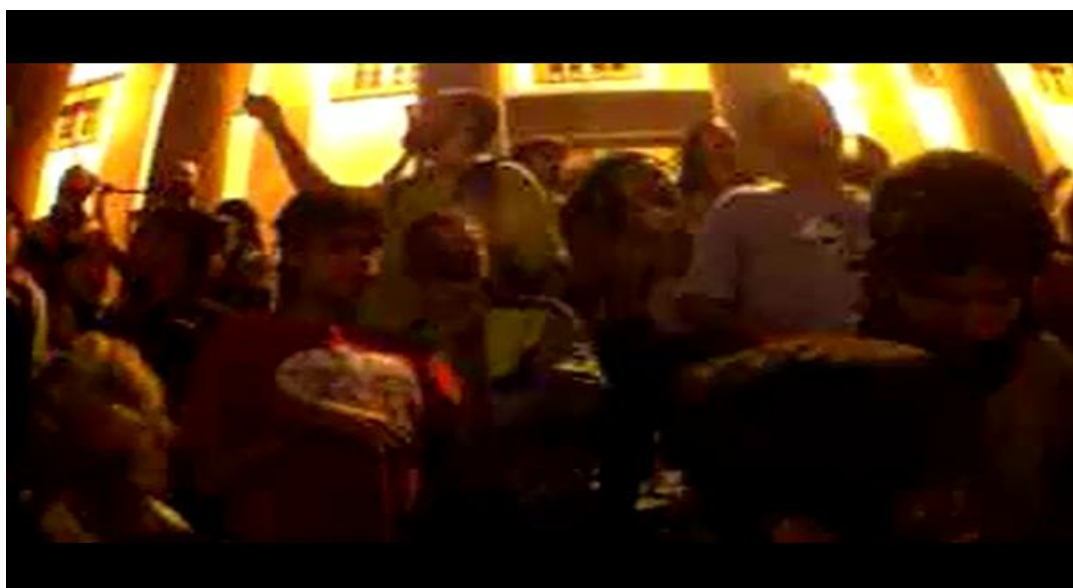
Imagem 17: Frame de vídeo da cobertura feita pela Mídia Ninja no protesto Fora Cabral, então Governador do estado do RJ. Cenas do momento em que os manifestantes ocupavam a porta da 9ª delegacia, no Rio de Janeiro, pedindo a liberação de um ninja preso.

As imagens transmitidas pela Mídia Ninja deslocam certos procedimentos técnicos, o que permite outra percepção do acontecimento. As transmissões ao vivo eram feitas penetrando os protestos. As tomadas eram fechadas e buscavam sempre as zonas de conflito e tensão entre a polícia e os manifestantes (Imagem 17). Não havia edição das imagens, já que eram transmitidas ao vivo pela internet através do celular, por isso não havia controle do tempo de exibição, a não ser pelas limitações do aplicativo que interrompiam o streaming em função do aumento da troca de dados que sobrecarregava a rede 3G. A difusão das transmissões eram feitas através de redes sociais como Facebook e Twitter, o que permitia uma reprodução viral das imagens.