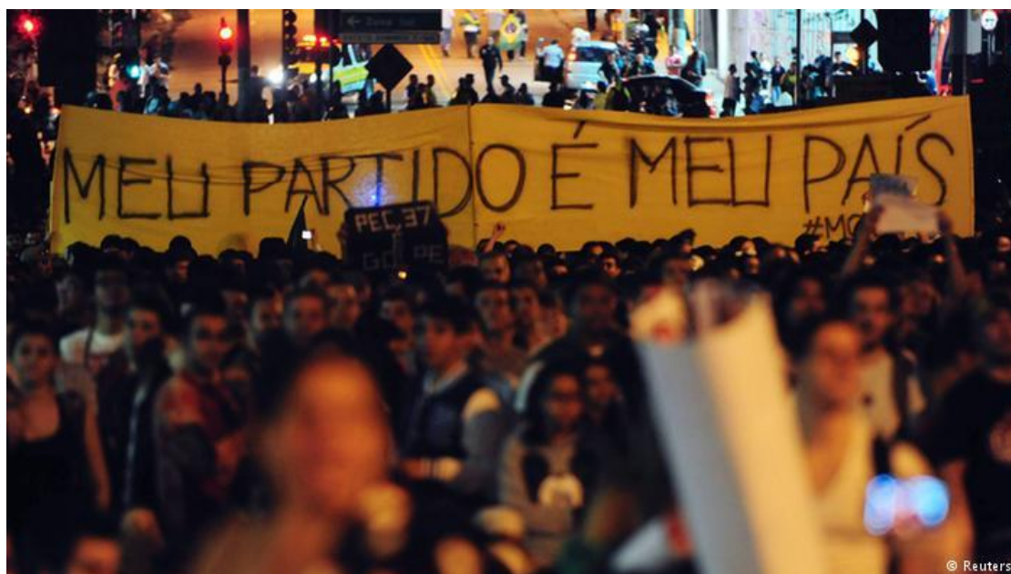
Imagem 12: Faixa em meio à multidão demonstrando a pouca receptividade a partidos políticos.

Uma multiplicidade ideológica, mas que foram deslocadas de seu “lugar próprio”, o campo político institucionalizado, encontrando nas ruas em transe político o espaço para sua expressão, ainda que divergências ideológicas provocassem tensões e reações violentas. Este acontecimento, de caráter sísmico, abalou ao menos por algumas semanas, as estruturas de poder e transbordou para além do campo político institucional.