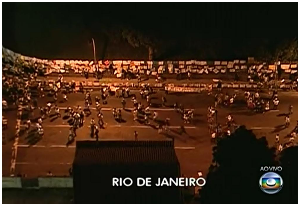
Imagem 16: Frame de vídeo mostrando a tomada aérea de um protesto no Rio de Janeiro, cuja cobertura é feita pela Rede Globo.

As imagens transmitidas pela Mídia Ninja deslocam certos procedimentos técnicos, o que permite outra percepção do acontecimento. As transmissões ao vivo eram feitas penetrando os protestos. As tomadas eram fechadas e buscavam sempre as zonas de conflito e tensão entre a polícia e os manifestantes (Imagem 17). Não havia edição das imagens, já que eram transmitidas ao vivo pela internet através do celular, por isso não havia controle do tempo de exibição, a não ser pelas limitações do aplicativo que interrompiam o streaming em função do aumento da troca de dados que sobrecarregava a rede 3G. A difusão das transmissões eram feitas através de redes sociais como Facebook e Twitter, o que permitia uma reprodução viral das imagens.