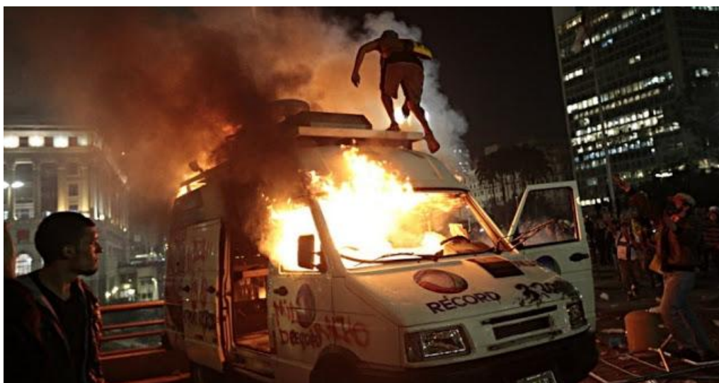
Imagem 13: Carro da Record incendiado por manifestantes durante protesto em São Paulo.

Portanto, aliado a esta crise de representação política havia também uma crise de representação midiática. A hostilidade dos manifestantes frente aos veículos de comunicação da mídia corporativa expressa o sintoma desta crise de representação midiática.(jogar com a mídia tradicional) A multidão em revolta não se via representada pela abordagem feita pelas emissoras de TV, assim como por jornais tradicionais e outros meios e por isso rechaçou de forma violenta a presença de muitos jornalistas, chegando ao paroxismo ao incendiar um carro de apoio da TV Record, e “deprestar” uma sede da Rede Globo(Imagem 13 e 14).