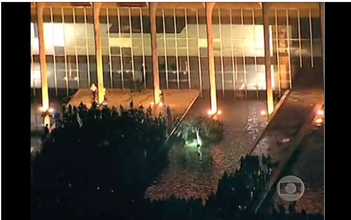
Imagem 3. Frame de vídeo da reportagem feita pela Rede Globo sobre os protestos em Brasília que foi ao ar no Jornal Nacional no dia 20/06/2013. Entrada do Itamaraty ocupada por manifestantes.

Este procedimento faz circular imagens assépticas do conflito urbano, virtualizando o acontecimento, onde o conflito real é apaziguado por imagens pacificadas pela distância aliada a um discurso que tenta restabelecer a ordem através da simulação de um consenso. Toda violência, captada a distância, é pacificada por essas imagens sobre o acontecimento. É que a cidade e toda sua dinâmica heterogênea, que vai dos conflitos violentos às lutas urbanas contra as forças da ordem, na lente das câmeras das grandes redes midiáticas, precisam ser captadas de um modo que a cidade apareça pacífica, sem tumulto, ou seja, que todo tumulto seja soterrado por imagens da cidade onde os problemas são solucionados, em silêncio, de forma limpa e “transparente” como as lentes que a captam e a editam.