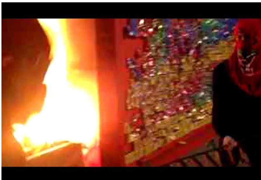
Imagem 4: Frame de vídeo de transmissão da Mídia Ninja no dia 18/06/2013, na avenida Consolação em São Paulo, onde manifestantes ateiam fogo num monumento publicitário da Coca-Cola como ato de protesto.

No contraponto às imagens televisivas, as imagens da Mídia Ninja eram feitas direto dos protestos, direto das ruas, em meio à multidão, onde as cenas de conflito entre policiais e manifestantes eram enquadradas e transmitidas ao vivo, mostrando outra percepção do espaço urbano (ver imagem 4). Agora, através destas imagens, a cidade aparece em efervescência política, transbordando seus conflitos violentos que marcam seu cotidiano, ou ao menos o cotidiano de uma parcela de seus habitantes que batalham por seu espaço e seus direitos de cidadão. O embate, neste caso, se dá no campo estético, técnico e político.