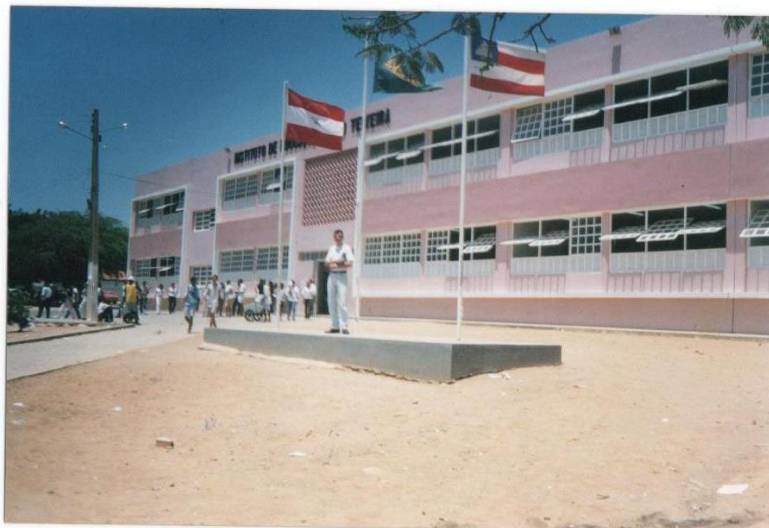
Figura 2 - Prédio na década de 1990