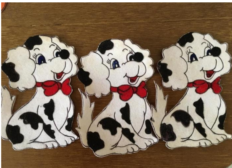
Figura 10 - Flanelogravuras