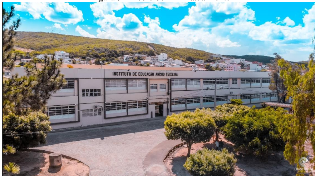
Figura 5 - Prédio do IEAT atualmente