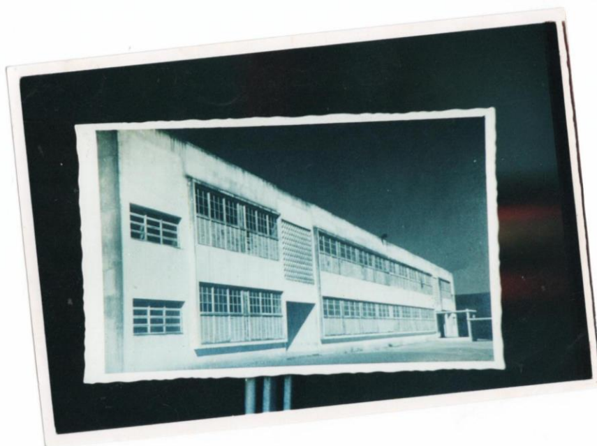
Figura 1 - Prédio na década de 1950