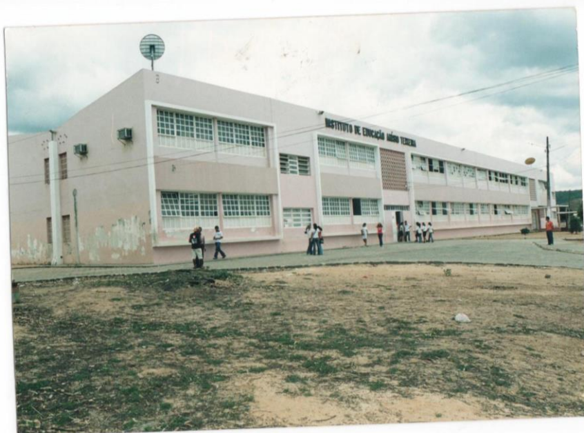
Figura 3 - Prédio na década de 1990