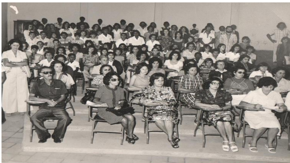
Figura 8 - Corpo Docente e Discente do IEAT na comemoração do Jubileu de Ouro da Escola Normal (1976)