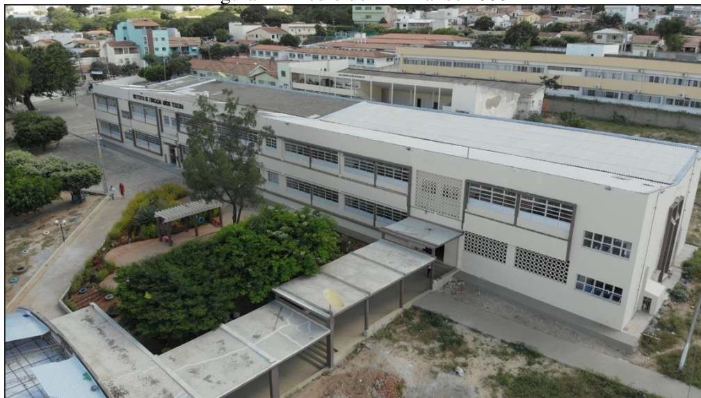
Figura 4 - Prédio do IEAT anos 2000