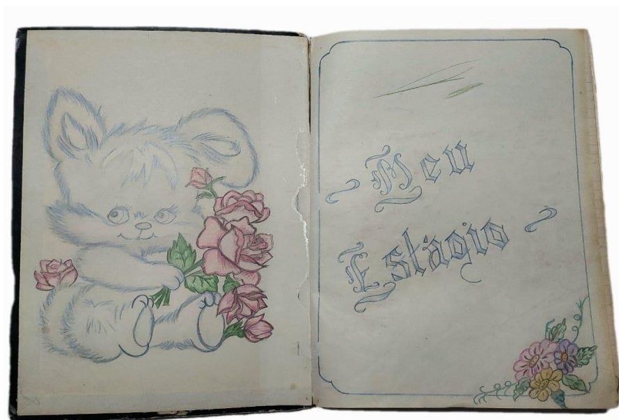
Figura 11 - Caderno de estágio