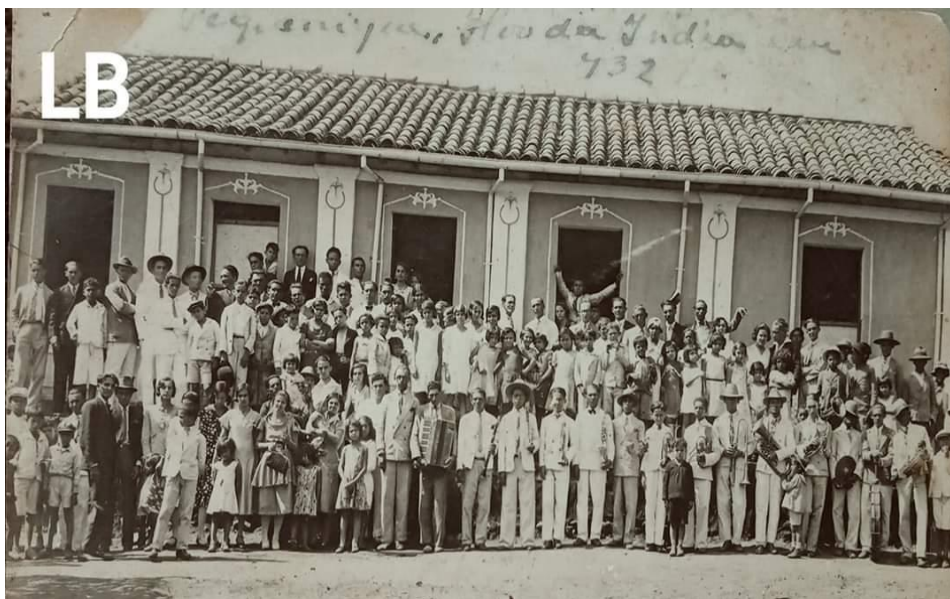
Figura 7 - Um piquenique na Flor da Índia