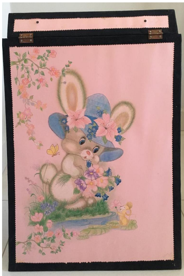
Figura 9 - Flanelógrafo