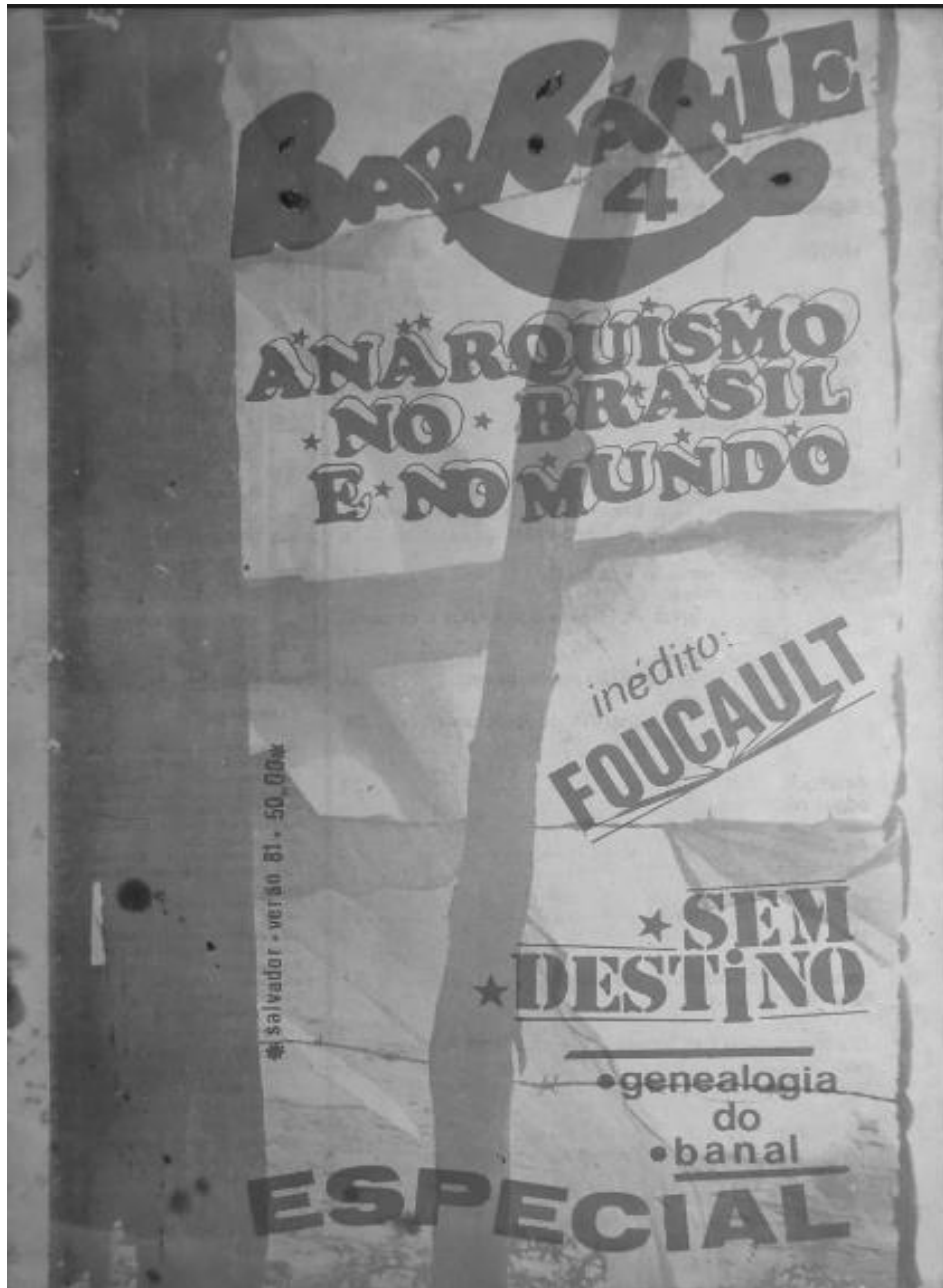
Figura 8: Capa da revista de número 4, ano de 1981.