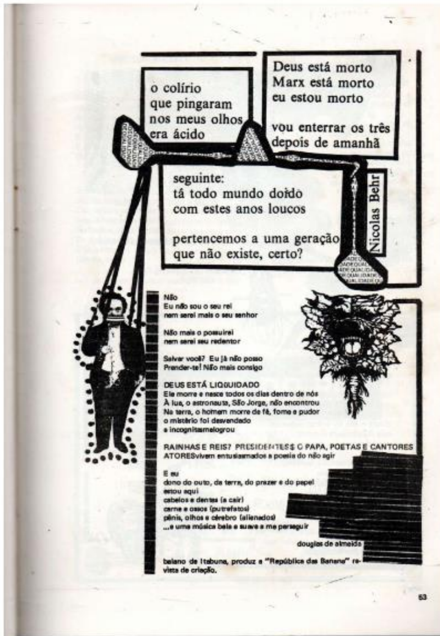
Figura 3 - Poesias diversas

Fonte: (Fonte: Barbárie , Salvador, Ano III, nº 5, p. 52)