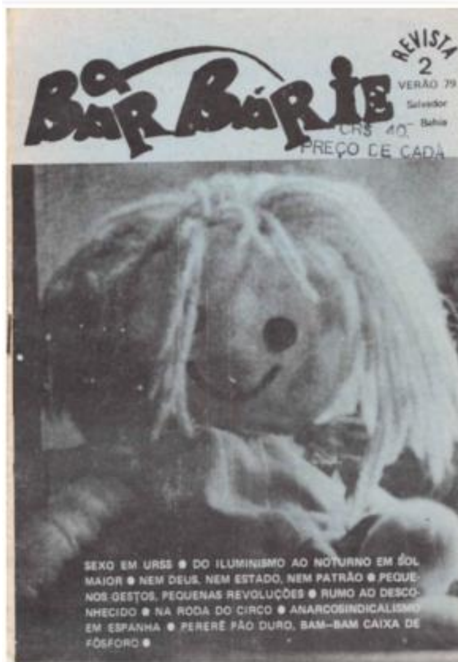
Figura 6: Capa da segunda edição da Barbárie , verão de 1979.