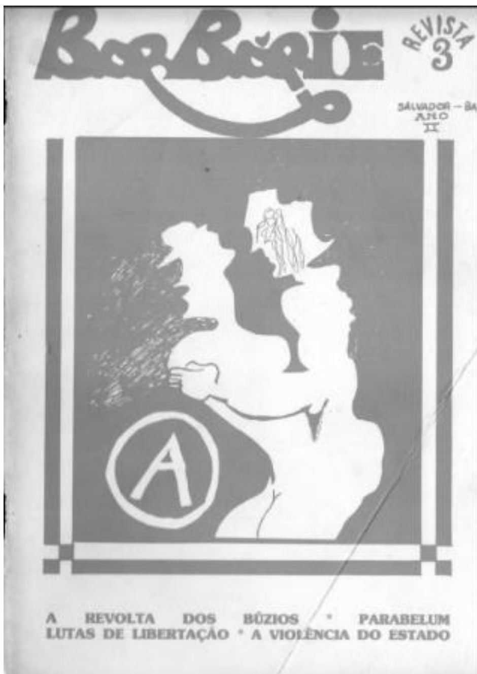
Figura 7: Capa da terceira edição da Barbárie , ano de 1980.