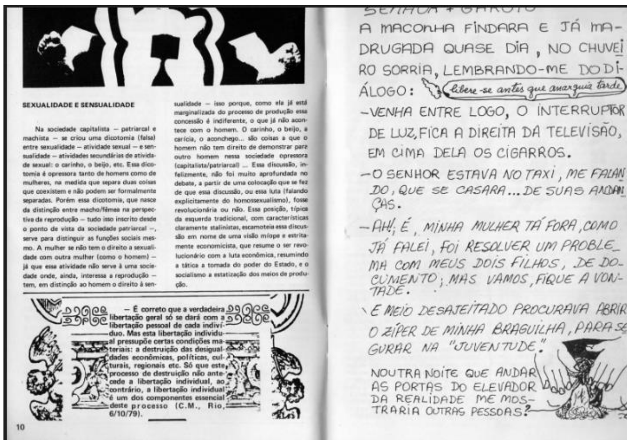
Figura 4 – “Libere-se antes que anarquia tarde”