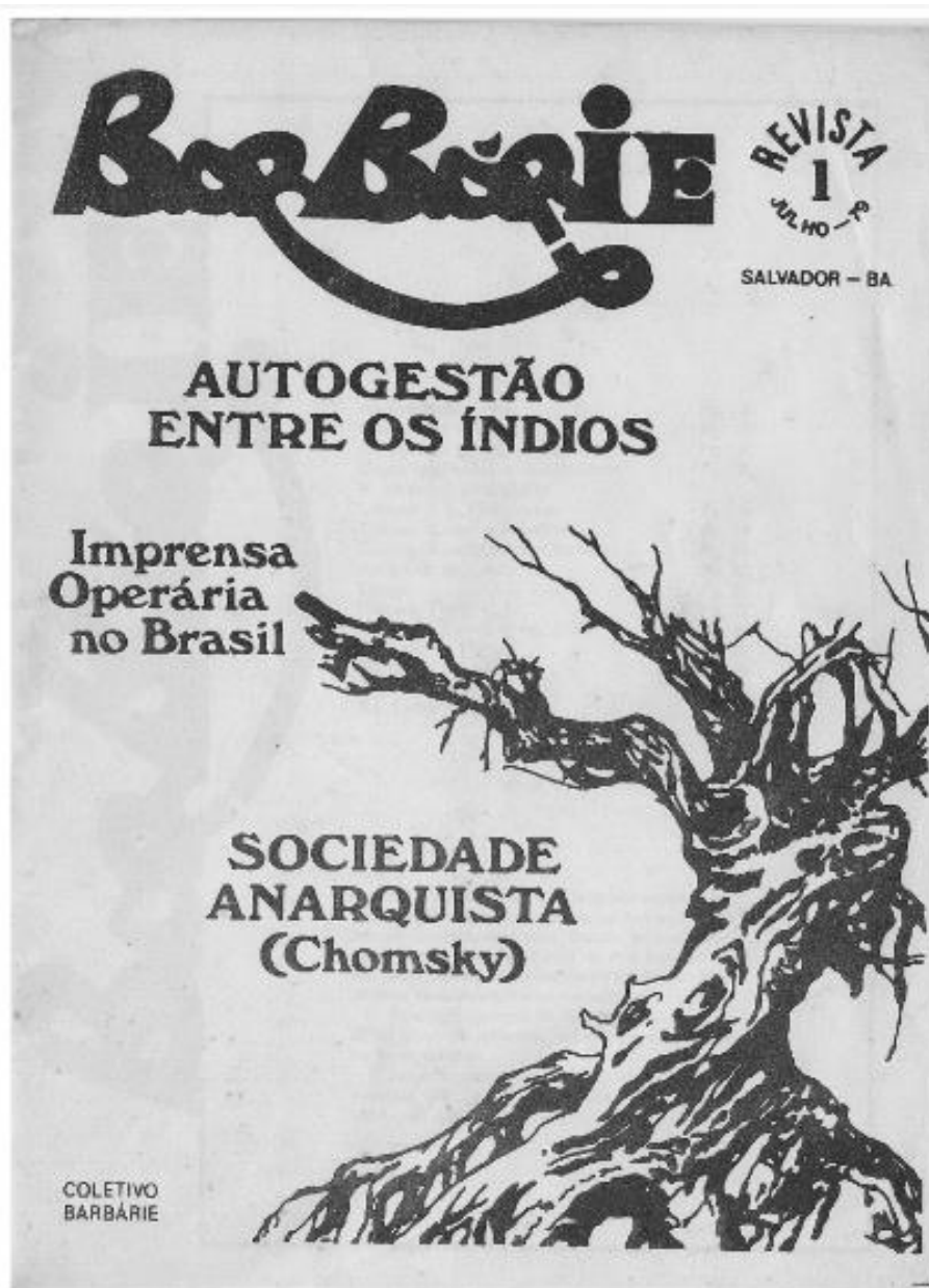
Figura 5: Capa da primeira edição da Barbárie lançada em 1979.