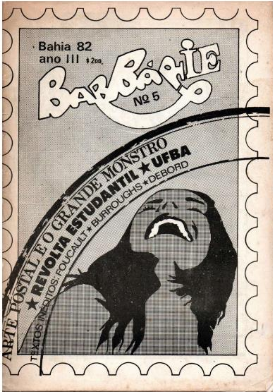
Figura 9: Capa da última edição da revista, publicada em 1982.