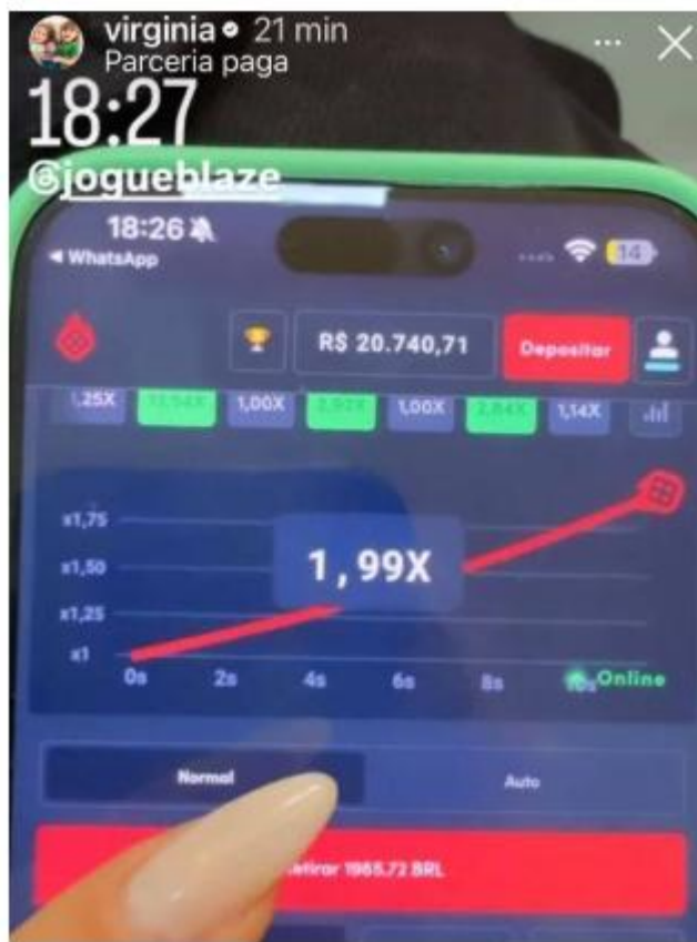
Figura 2 - Divulgação de cassino online