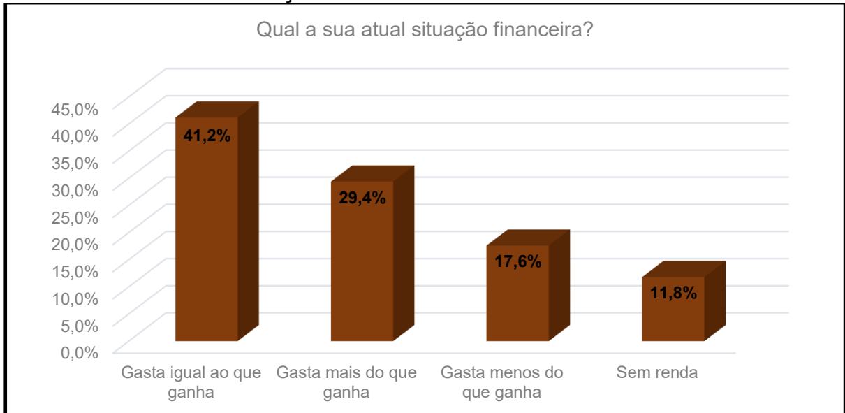
Gráfico 1 Análise sobre a situação financeira.

Essa falta de conhecimento acaba gerando uma situação como a descrita no gráfico 1.