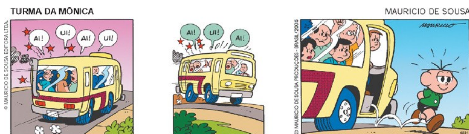
Figura 4 – Tirinha