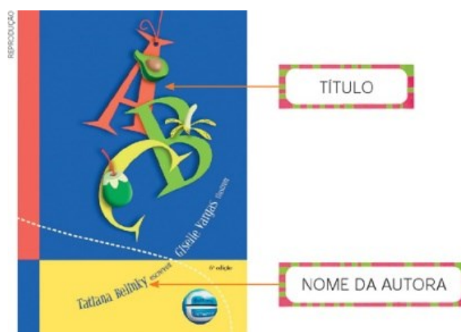
Figura 1 – Capa de um livro ABC