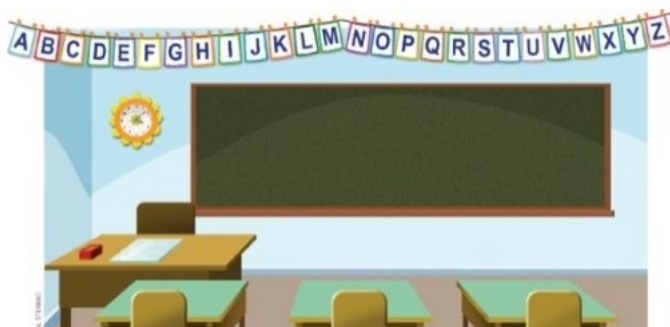
Figura 3 – Sala de aula