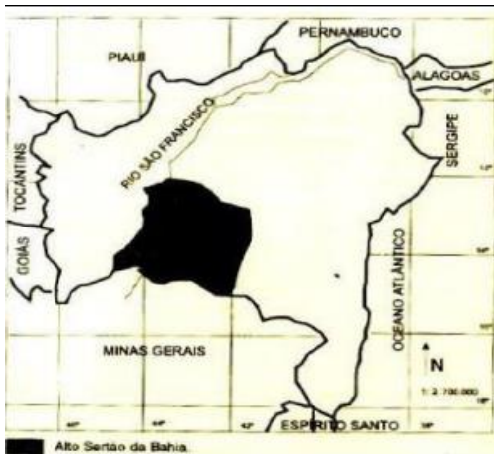
Mapa 01 - Mapa do Alto Sertão da Bahia.

O Alto Sertão da Bahia 6 local de origem do escritor compreende de acordo com Neves (1999, p. 119), a “área angulada pelos rios São Francisco e seu afluente Verde Grande, que atualmente constituem partes das regiões econômicas do Médio São Francisco, Serra Geral e Chapada Diamantina”. No que diz respeito ao povoamento da região e sua economia ressalta que começou com a instalação de fazendas de gado e pecuária com trabalho escravo.