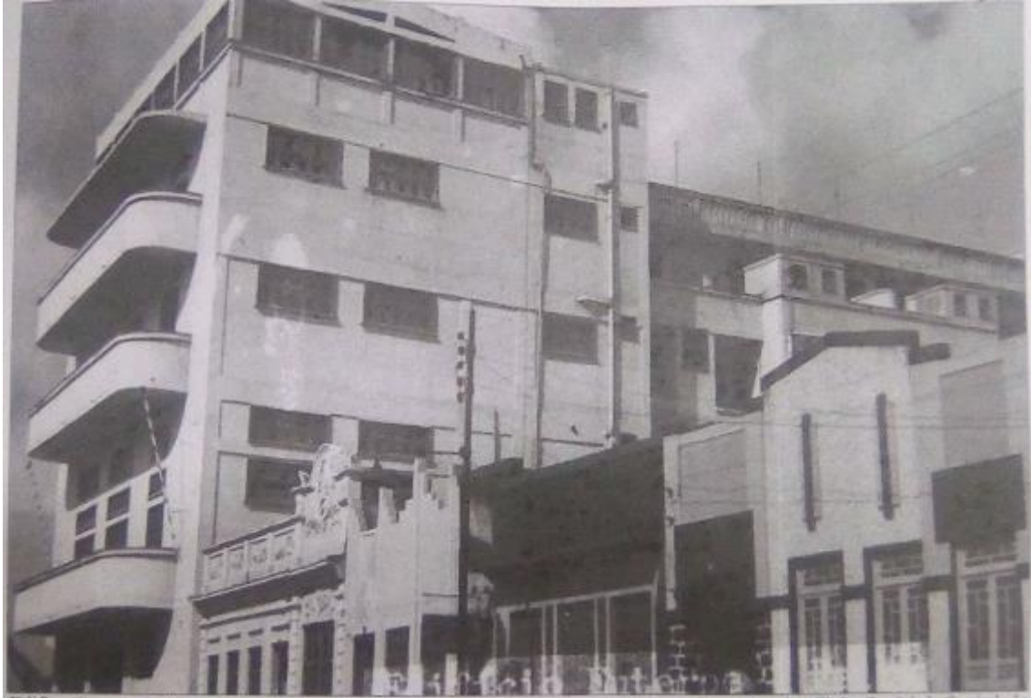
Imagem 03 - Livro Feira de Santana em Postais, página 87.

Na imagem 03 temos outro ângulo da Rua, com um foco nas residências vizinhas ao Prédio da Euterpe Feirense, mas ainda é possível perceber a sua grandiosidade frente a sua vizinhança. Nessa imagem é possível perceber que o prédio está finalizado, pois o último pavilhão já está pronto, diferente do que se pode observar nas imagens 01 e 02.