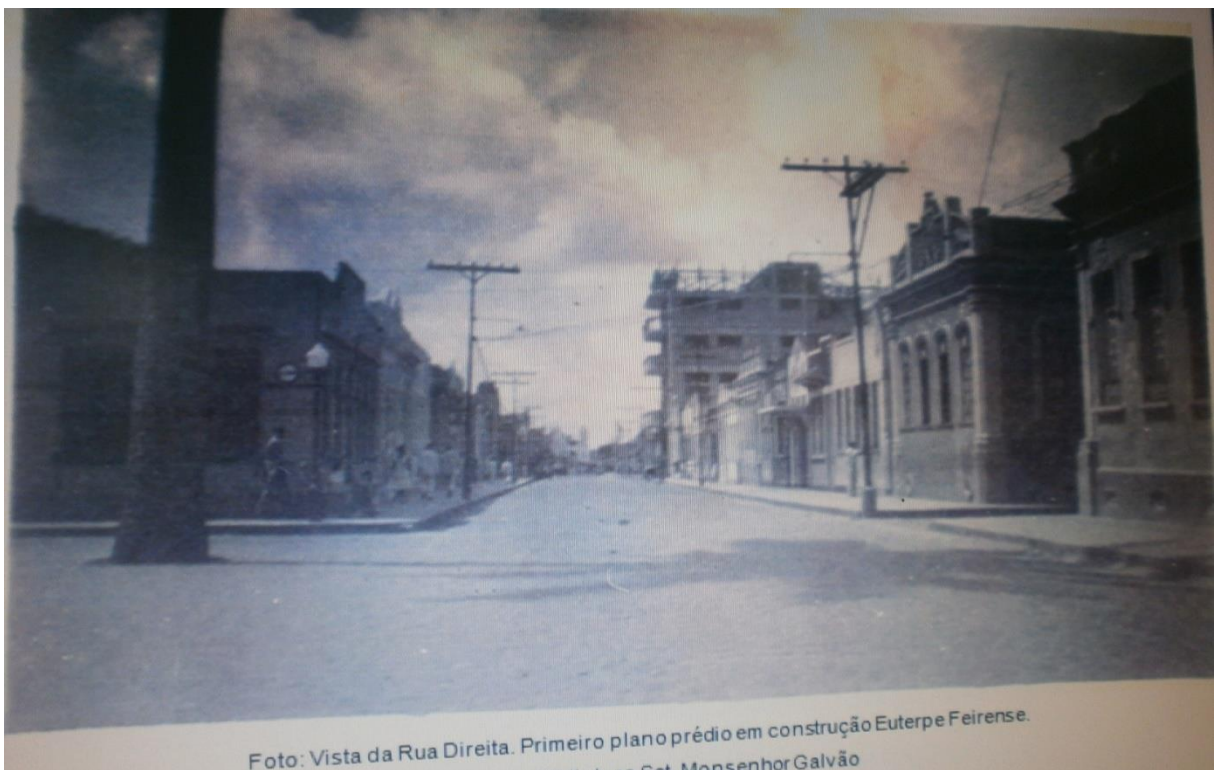
Imagem 02- Foto de autoria e ano desconhecidos, fonte: Centro de Estudos Feirenses (UEFS).

Nessa imagem não há a presença de pessoas da alta sociedade, por conta do mesmo estar inacabado, não se sabe a autoria, nem a da foto para se tentar traçar o perfil do fotógrafo. No entanto especula-se que essa fotografia foi feita, para mostrar as grandes construções, que constituíam como elementos da modernidade.