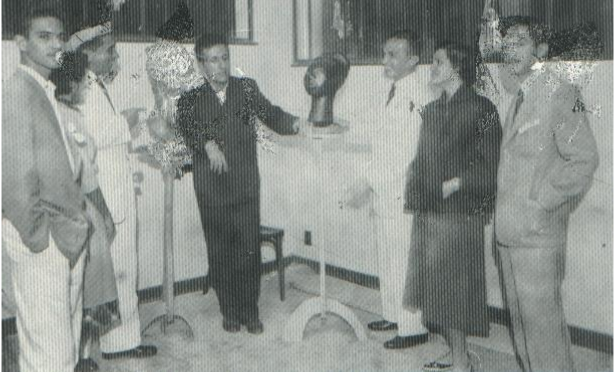
Imagem 05 - Livro Memória Fotográfica de Feira de Santana página 193.

anúncio do Jornal Folha do Norte que trazia o anúncio dos Irmãos Trindade na Rua Conselheiro Franco, nº 100, no Edifício do Banco Econômico, sala 03 (Jornal Folha do Norte Ano XLV, nº 2417, dia 05 de novembro de 1955).