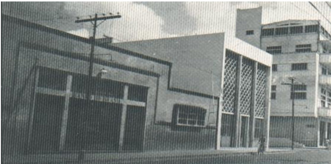
Imagem 04 - Livro Memória Fotográfica de Feira de Santana página 16.

Na imagem 03 temos outro ângulo da Rua, com um foco nas residências vizinhas ao Prédio da Euterpe Feirense, mas ainda é possível perceber a sua grandiosidade frente a sua vizinhança. Nessa imagem é possível perceber que o prédio está finalizado, pois o último pavilhão já está pronto, diferente do que se pode observar nas imagens 01 e 02.