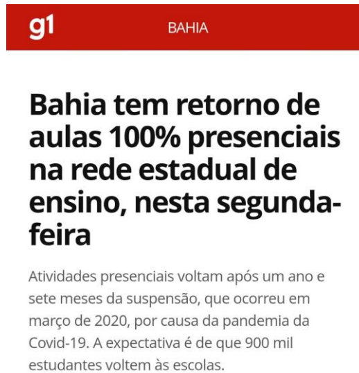
Figura 5: Notícia 5 - Retorno das aulas presenciais na Bahia em 2021.

Fonte: https://g1.globo.com/ba/bahia/noticia/2021/10/18/bahia-tem-retorno-de-aulas-100percent-presenciais-nesta-segunda-feira.ghtml . Acesso em 10/11/2024