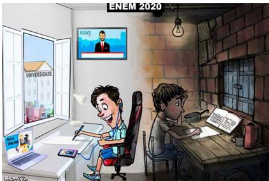
Figura 6: Desigualdades educacionais na Pandemia da Covid-19