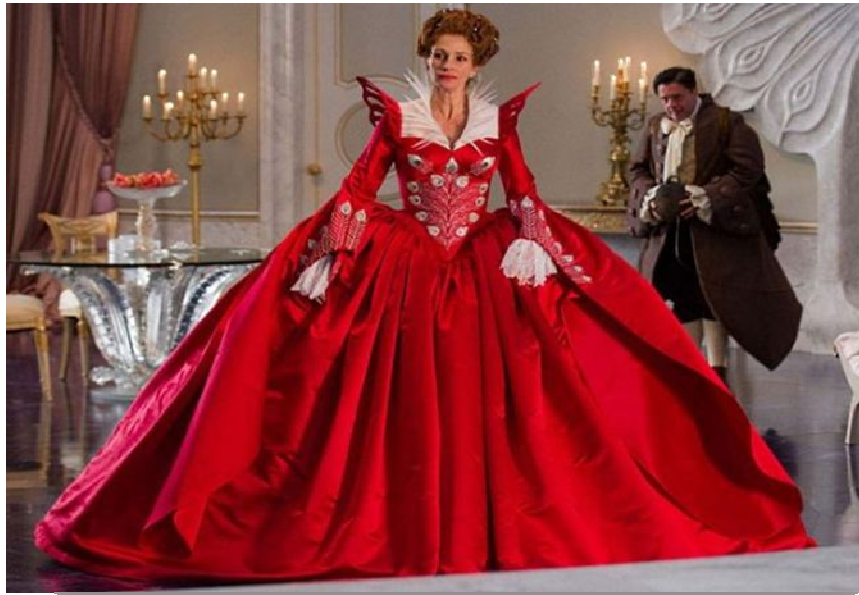
Figura 22. Madrasta da versão Espelho, espelho meu .

Disponível em: http://blog.ewmix.com/2012/04/espelho-espelho-meu/ . Acesso em 13 Jan. 2014