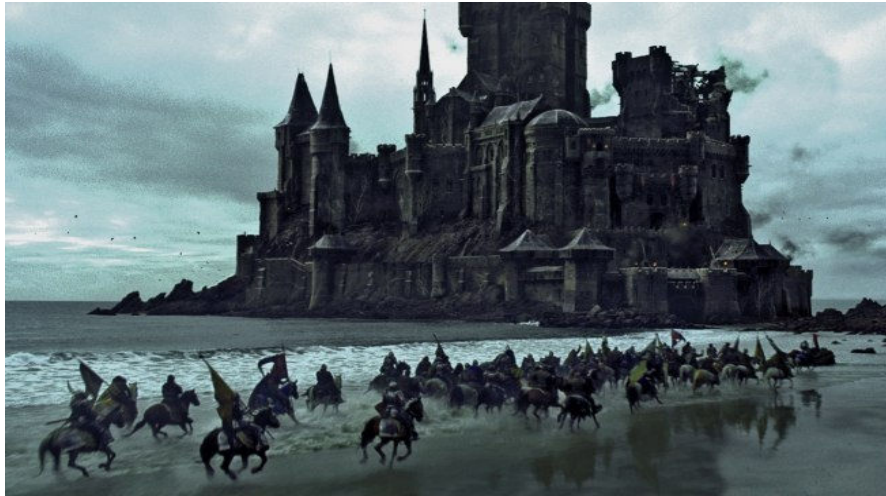
Figura 28. Espaço Nórdico do filme Branca de Neve e o Caçador .