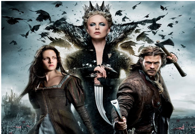
Figura 34. Figurino Branca de Neve e o Caçador .

Disponível em: http://democraciefashion.com.br/2012/06/branca-de-neve-e-o-cacador/ . Acesso em 18 Abr. 2014