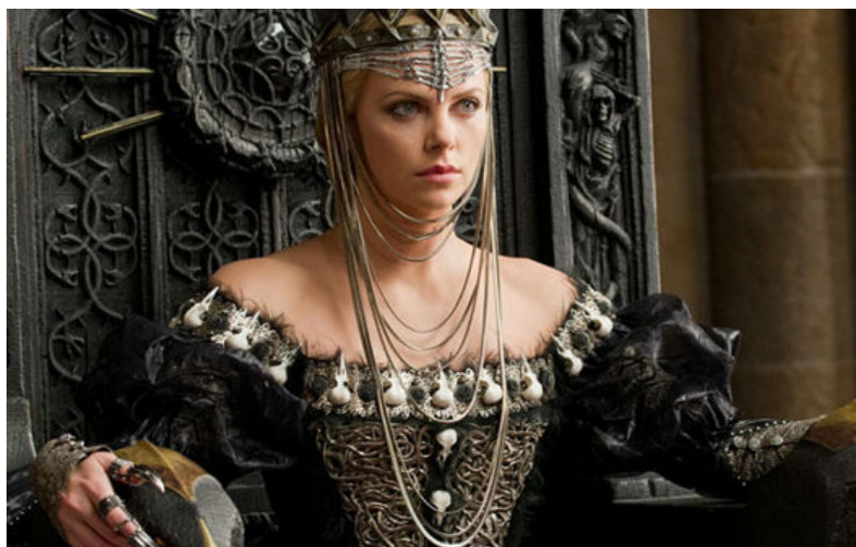
Figura 39. Rainha Ravenna.

Fonte: Disponível em: http://www.phiphices.com.br/opiniaio/figurino-rainha-ravenna-de-branca-de-neve-e-o-cacador . Acesso em 15 Abr. 2014.