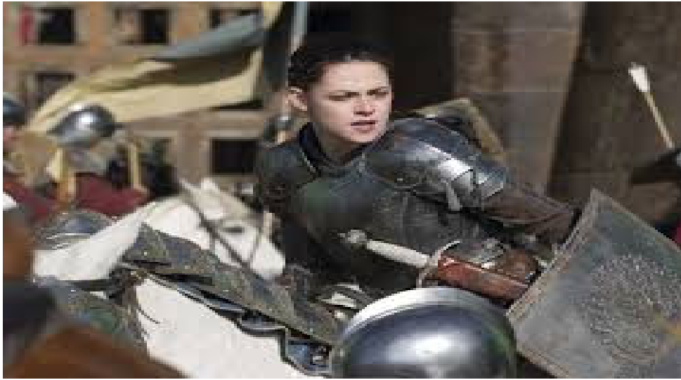
Figura 44. Branca de Neve.