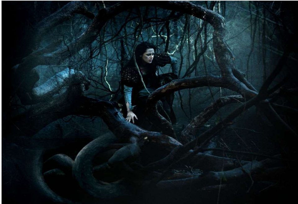
Figura 30. A Floresta da versão cinematográfica.