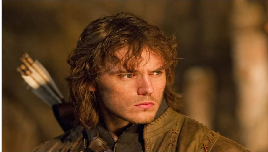
Figura 43. Príncipe William.