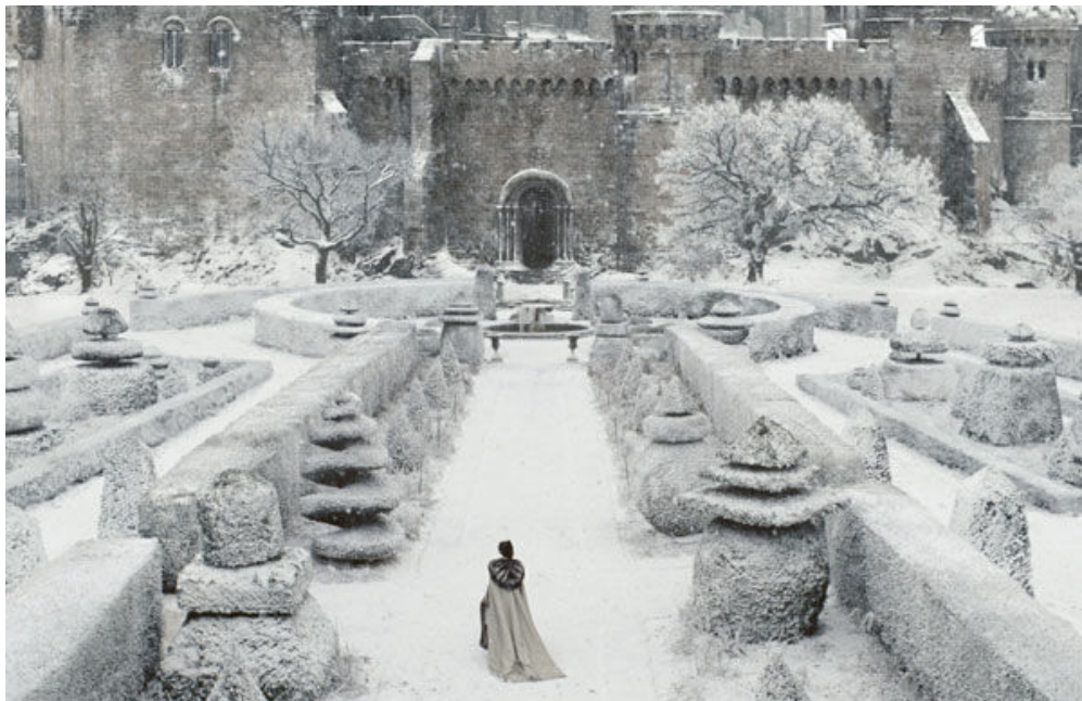
Figura 31. Reino no tempo do inverno.