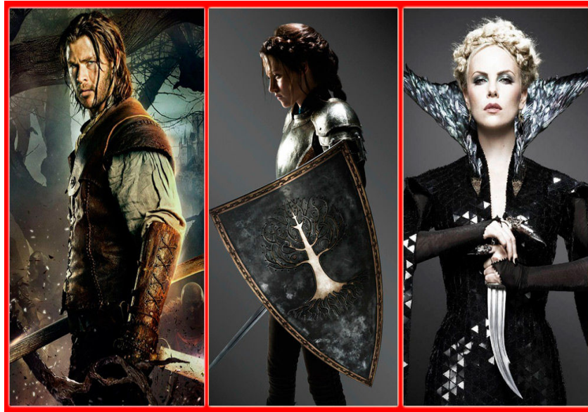
Figura 35. Figurino Branca de Neve e o Caçador .