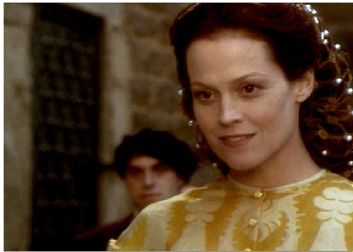
Figura 16. A Madrasta da versão Floresta Negra .