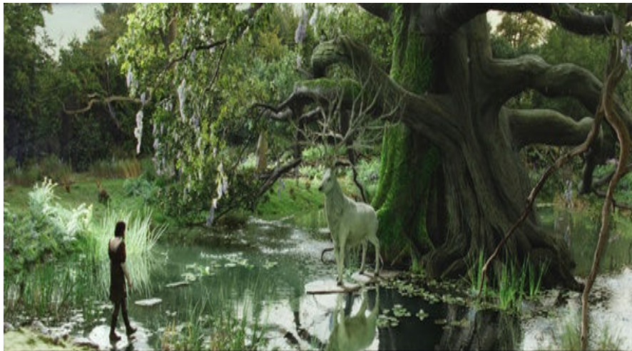
Figura 29. Floresta chamada de Santuário da trama Branca de Neve e o Caçador .