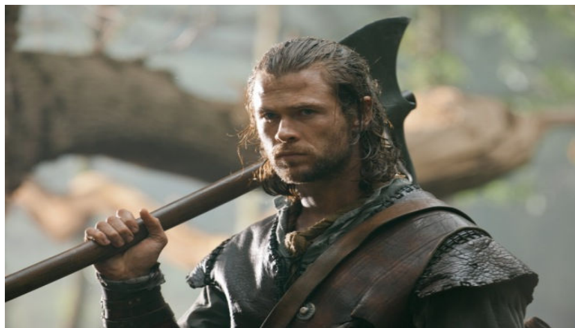
Figura 42. Caçador.

Fonte: Disponível em: http://www.pop.com.br/mundopop/noticias/cinema/766504-Hemsworth-fala-sobre-segundo-Branca-de-Neve-e-o-Cacador.html . Acesso em 21 Abr. 2014