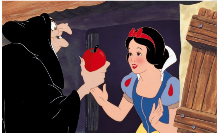
Figura 10. Branca de Neve e a Madrasta da versão Walt Disney .