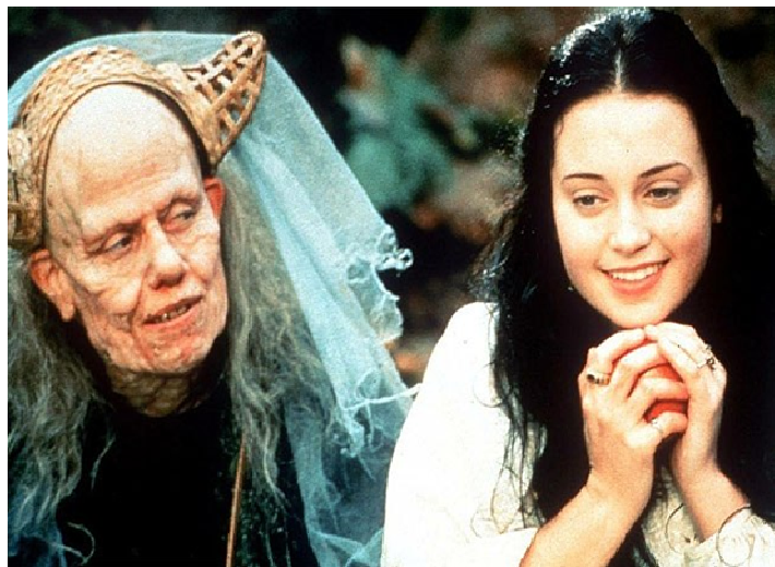
Figura 14. Branca de Neve e a Madrasta da versão Floresta Negra .

Também originada do texto dos Irmãos Grimm, podemos perceber algumas semelhanças com o texto original, como um viúvo que perde sua esposa, casa-se de novo com uma mulher que sente inveja de sua bela filha. Os cenários sombrios, como a floresta, o castelo e a trama desenvolvem-se em uma constante atmosfera de horror. Os anões são mineradores grosseiros e no final da história a madrasta dança pelos corredores do castelo com seu bebê natimorto nos braços.