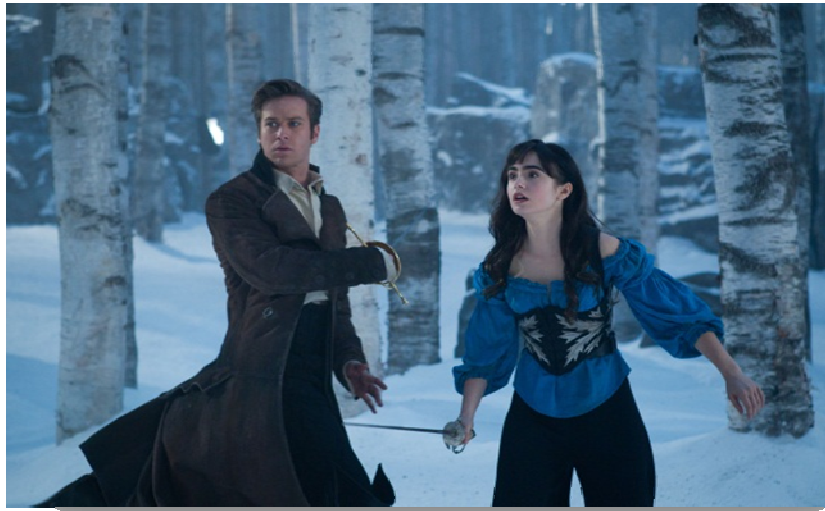
Figura 21. Branca de Neve e o Príncipe da versão Espelho, espelho meu .