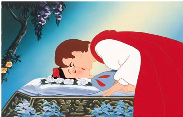
Figura 11. Branca de Neve e o Príncipe da versão Walt Disney .

Fonte: Disponível em: http://sustentavel.blog.br/releituras-de-branca-de-neve/branca-de-neve-e-o-principe/ . Acesso em 13. Abr. 2014