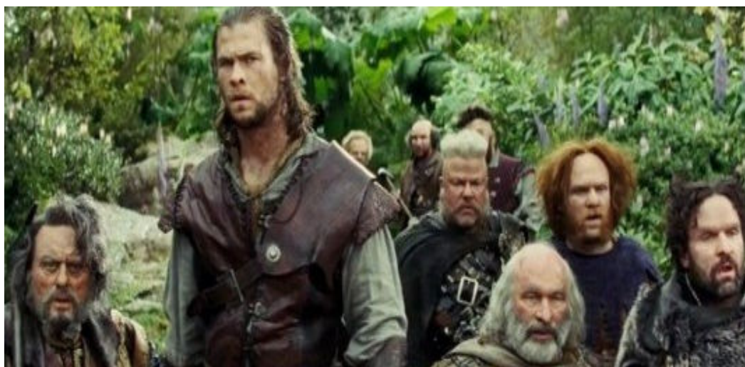
Figura 40. O Caçador e os Anões do filme Branca de Neve e o Caçador .