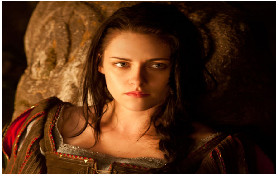
Figura 33. Figurino Kristen Stewart – Branca de Neve.