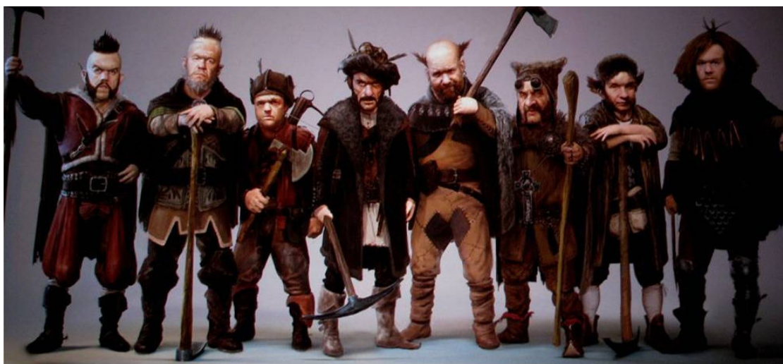
Figura 41. Anões do filme Branca de Neve e o Caçador .